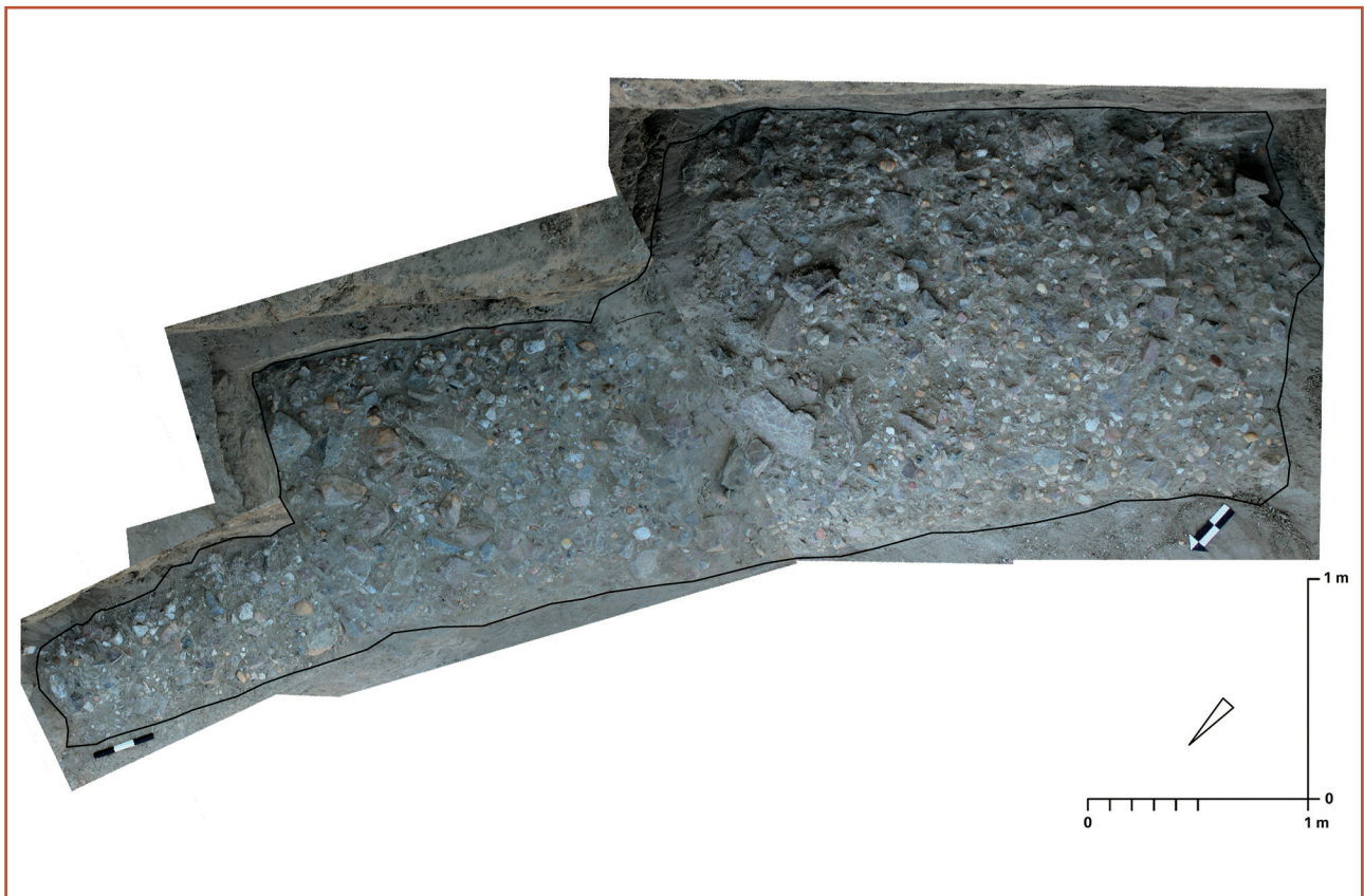
Colour fig. 1: MOG116, Planum 1. Orthophotographical record (lower row, left) and CAD based tracing of different artefact/ecofact classes (field recording: H. M. Alkhidir Ahmed, M. Ehlert; mapping: K. Geßner, A. Dittrich)

Titelbild: Kistengrab auf kleinen ovalen Tumuli am Friedhof site 10607