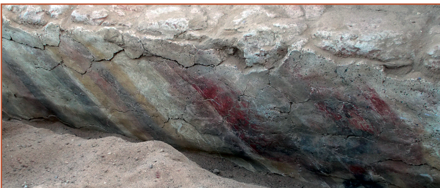
Colour fig. 2: Abu Erteila, Temple K 1000, Outer facing of the southern perimeter wall, Detail of the painting on plaster depicting sunbeams.