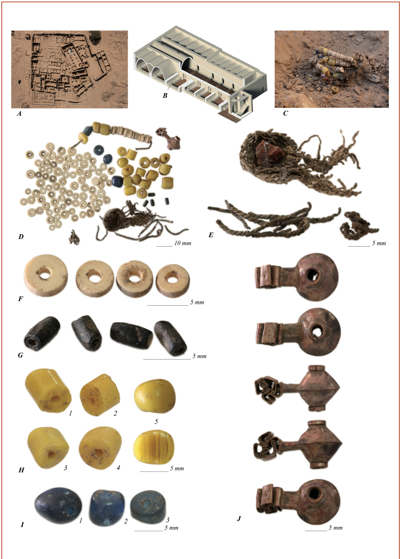
Colour fig. I: (Except to otherwise stated, photos and figure design by J. Then-Obluska) A. Monastery at Ghazali (photo by M. Bogacki) – B. Reconstruction of Ghazali dormitory (by J. Szewczyk) – C. Ghazali beads in situ (photo by A. Obluski) – D. Ghazali beads – E. A fiber case with resin fragments – F. Ostrich eggshell beads – G. Stone beads – H. Drawn yellow beads – I. Drawn blue beads – J. Copper-alloy pendant