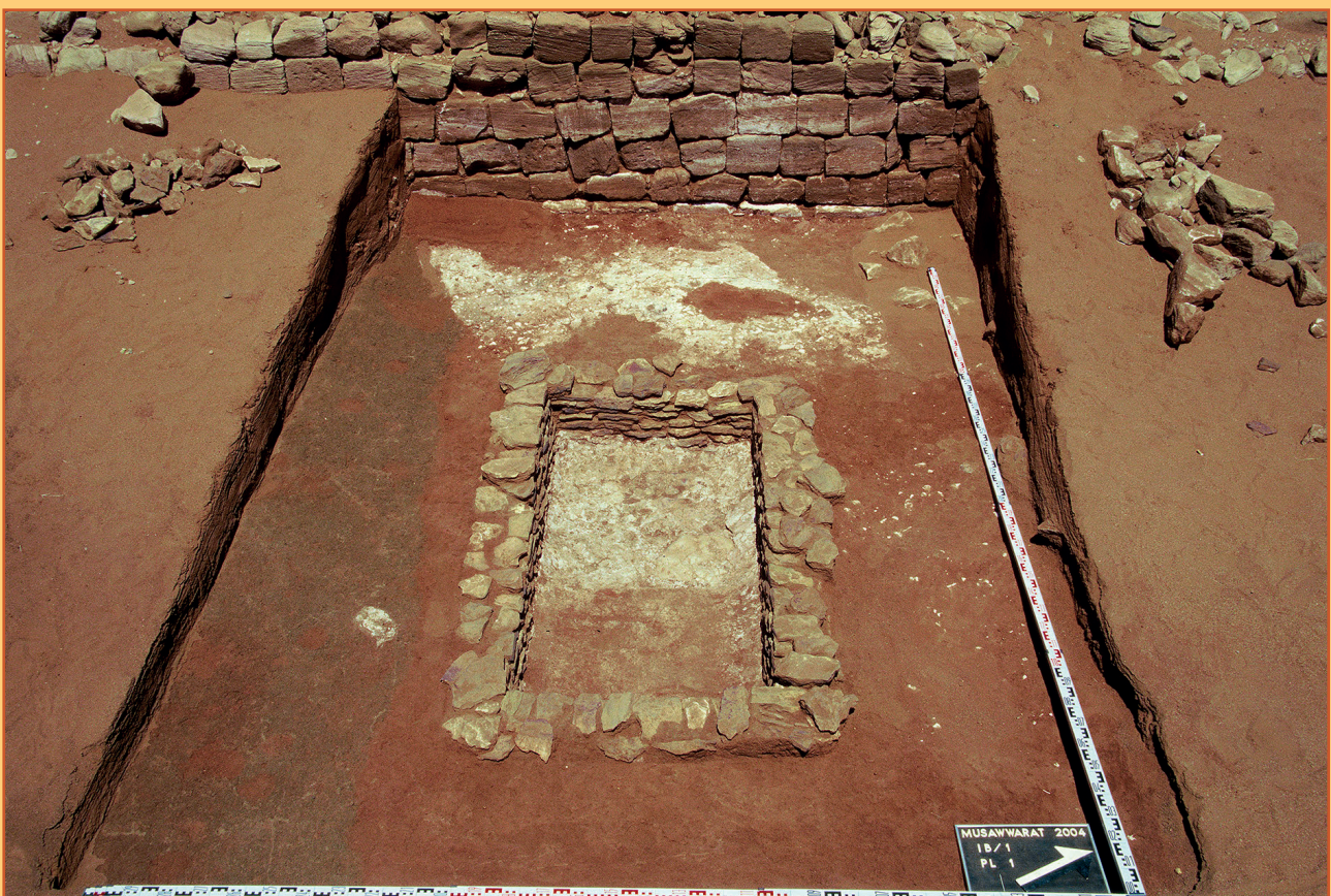
Farbabb. 10: Das Wasserbecken I B/1 und angrenzende Befunde im Planum.