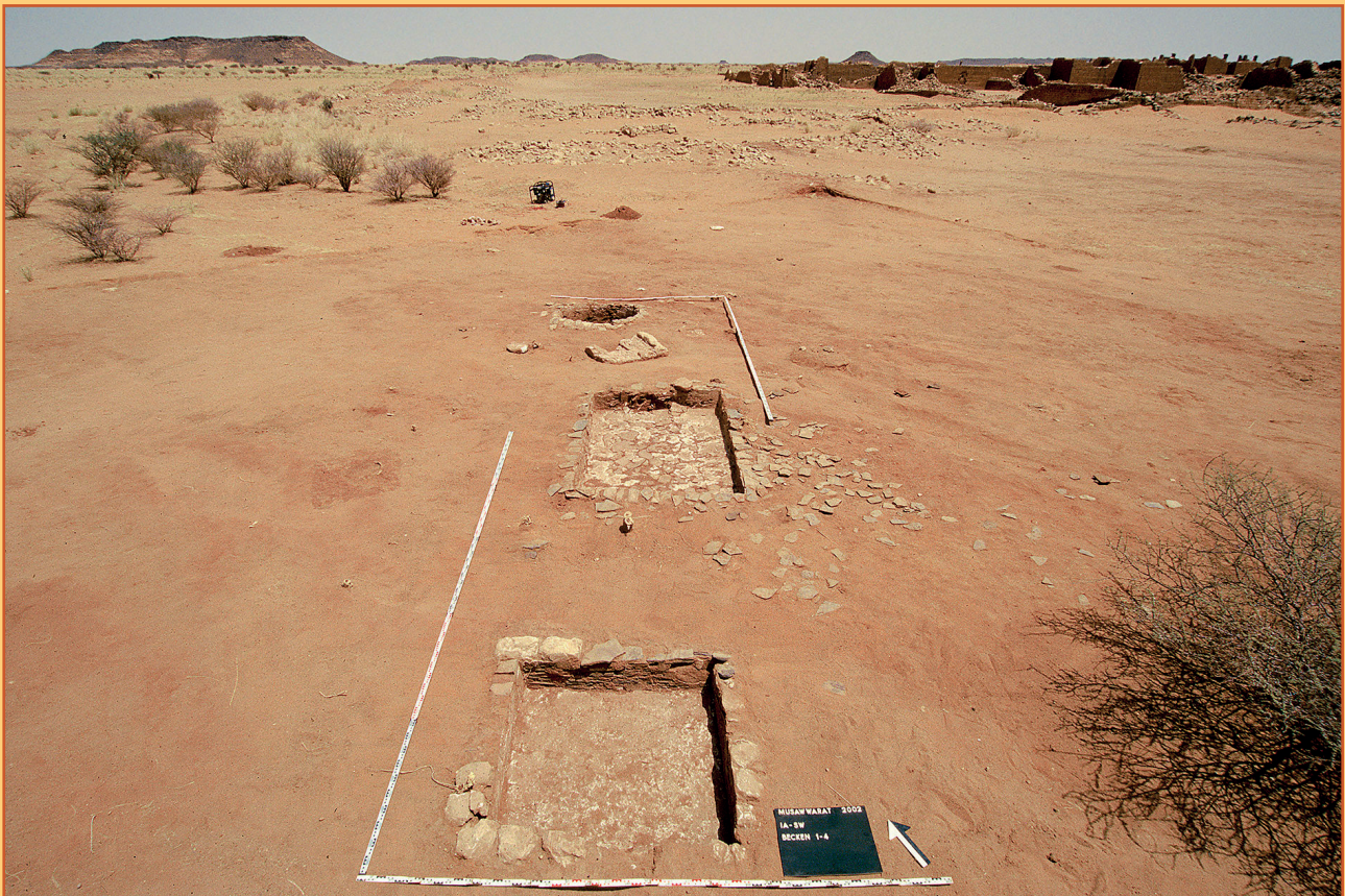
Farbabb. 9: Das Areal I A-SW im Überblick.