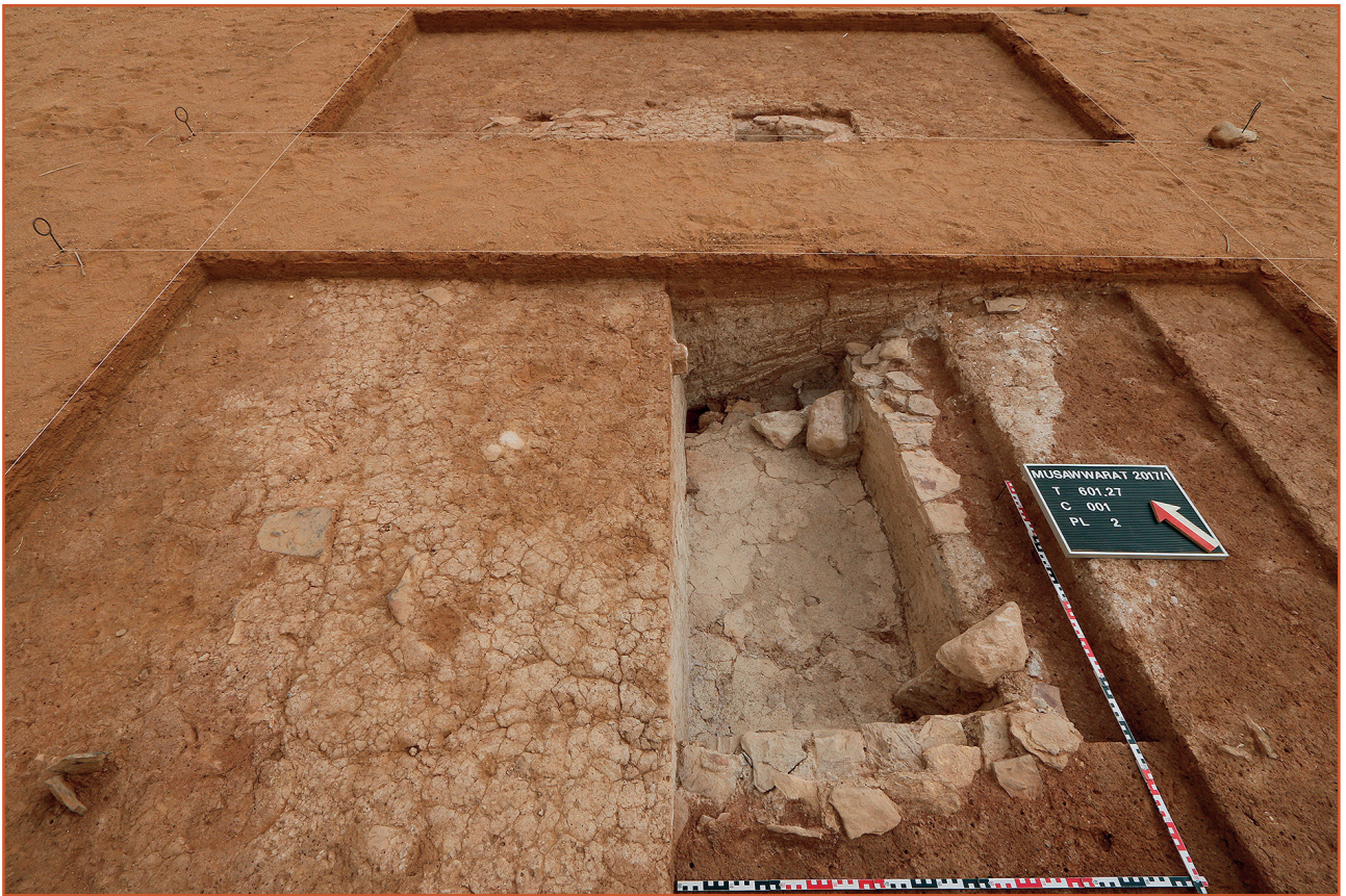
Farbabb. 7: Die Schnitte 601.27+28 mit dem ausgegrabenen SE-Viertel des Beckens IA/6.