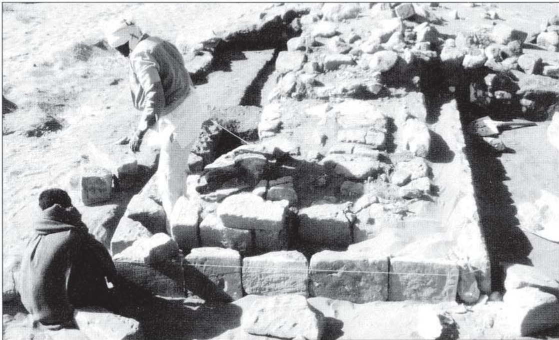
Abb. 4: Schutzmaßnahmen zur Erhaltung der Reste des Haupttores: Ummauerung mit Sandsteinblöcken, Einbettung in reinem Sand (Dia Nr. 2000 - 42/5).

Das Vorhandensein oder Fehlen von Durchgängen sowie ihre Lage und Gestaltung ist der wichtigste Ansatzpunkt für den Versuch einer bauchronologischen und funktionellen Analyse der Großen Anlage. Noch sind hier Fragen offen, etwa scheint Hof 416 nur vom Baukomplex 400 aus betretbar. Eine Verbindung zwischen den Höfen 512-505-501-223 scheint nicht vorhanden zu sein, ebenso scheint sie zwischen den Höfen 120-122-227 zu fehlen. Detaillierte Aufnahmen fehlen noch für die meisten Durchgänge der Komplexe 400 und 200. Daher sollte der Komplex "Durchgänge" auch in kommenden Kampagnen weiter bearbeitet werden.