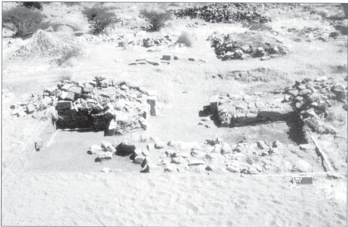
Abb. 1: Das Haupttor der Großen Anlage während der Freilegungsarbeiten der Kampagne 2000, Planum 1 - 2, von Westen gesehen. Im Vordergrund Blockverstoß des Tores, am oberen Bildrand Abraumhalde der Kampagne 1968 (Dia Nr. 2000 - 03/33).