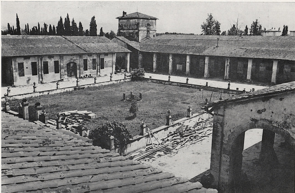
3 The Cascina at Poggio a Caiano. View of Courtyard.