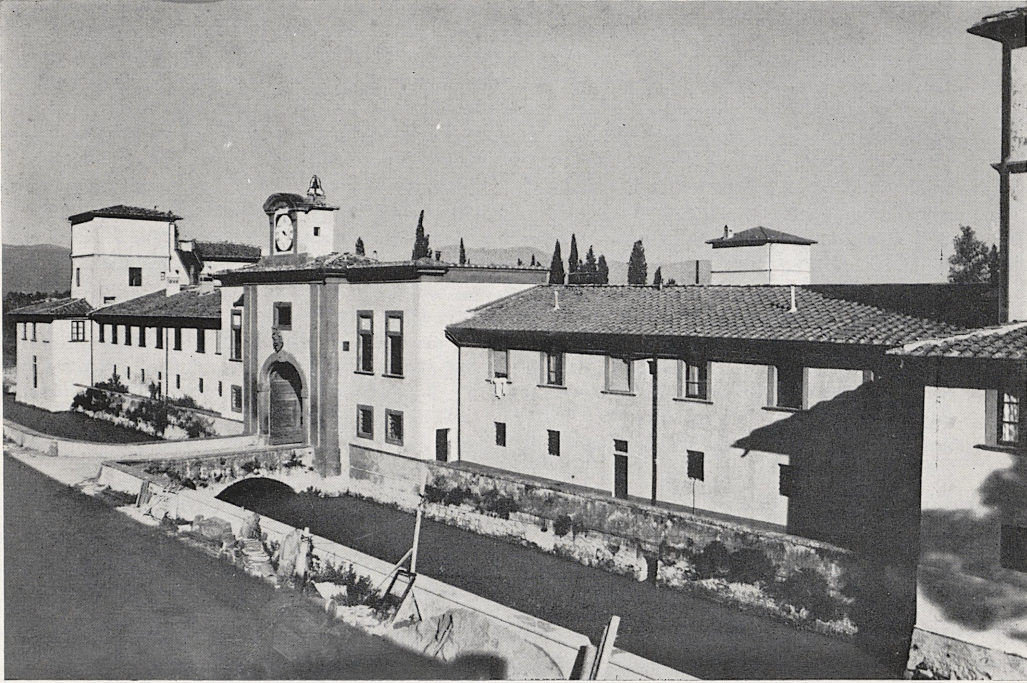
2 The Cascina at Poggio a Caiano. Main Façade.