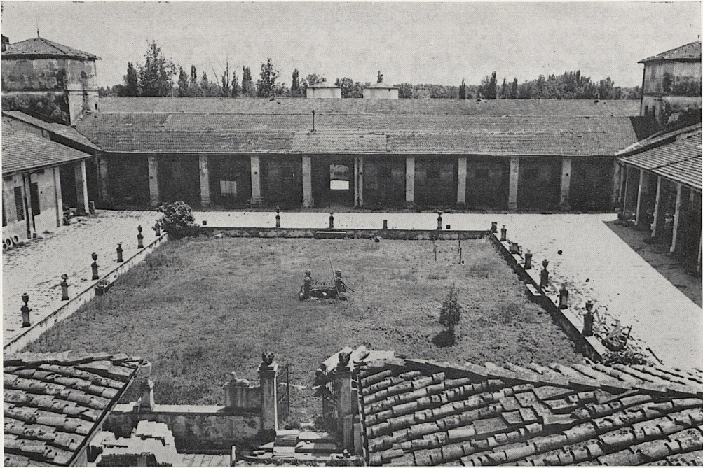
5 The Cascina at Poggio a Caiano. View of Stables.