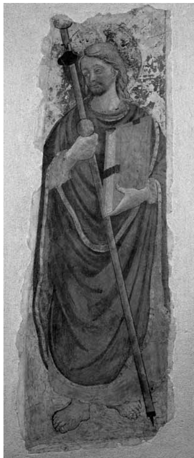
9 Umbrian school around 1500, St. Anthony Abbot. Budapest, Museum of Fine Arts.