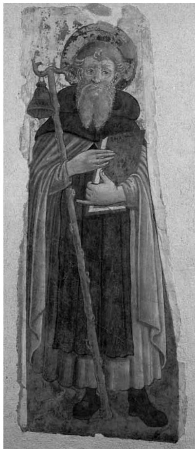
10 Umbrian school around 1500, St. James the Great. Budapest, Museum of Fine Arts.