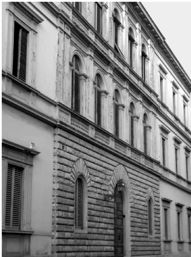
2 Building which housed the gallery of Emilio Costantini in the Corso Regina Elena (now Corso Italia) in Florence.