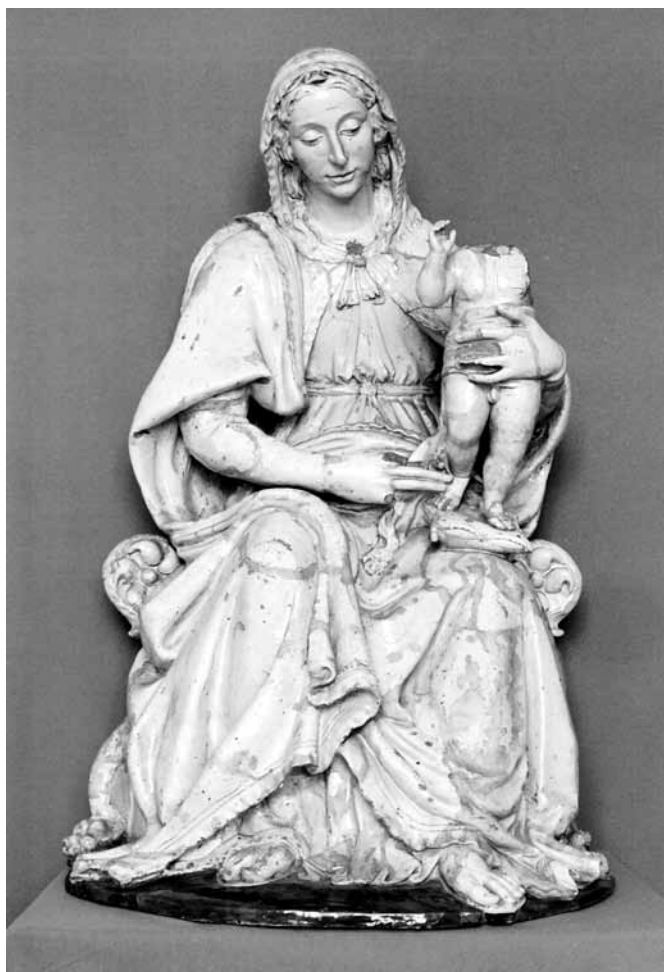
4 Attributed to Baccio da Montelupo, Virgin and Child. Budapest, Museum of Fine Arts.

the director was travelling in Italy, visiting galleries and conducting trade, he had accounting problems with the Hungarian government: he had spent much more money than the ministry had disbursed to him for the given period of time. In March 1895 Wlassics established a committee in Budapest to oversee Pulszky's art purchases. The committee found several mistakes in Pulszky's accounting. Payment slips were missing, since the director often paid out of his own pocket. In a letter dated 10 May 1895, the minister listed several inaccuracies among Pulszky's accounts for his Florentine purchases: "The formal shortcomings of some receipts about certain advance payments [...] are cause for concern. [...] Receipt no. 31 for 25,000 and 20,000 lire from Emilio Costantini and receipt no. 34 from Glisenti for 2,500 lire, and, in particular, the latter's receipt written in pencil on a business card cannot be considered as an invoice document [...]" 63 Costantini also gave Pulszky an advance payment receipt for 7,000 lire written on a business card (fig. 3). 64 The committee's report, however, did not criticize the price Pulszky paid for the works, thus there was no doubt over his professional expertise. He was a scholar with great knowledge