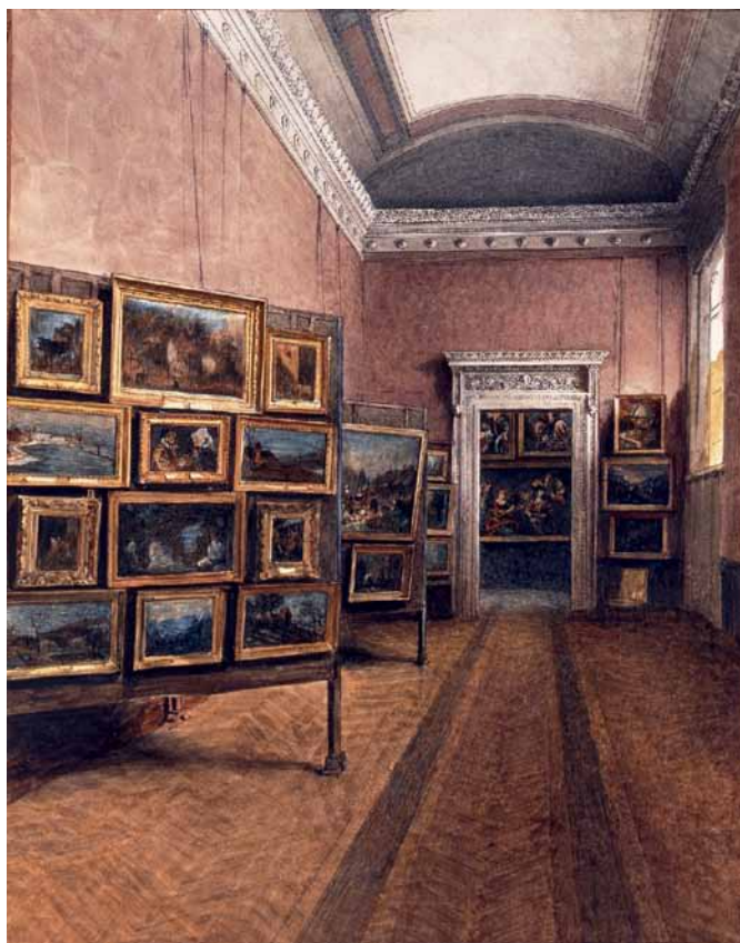
8 Gyula Hári, Exhibition of the works purchased in Italy at the Academy of Sciences, room VII, 1904. Budapest, Museum of Fine Arts.

Similarly, Raffaellino del Garbo's Holy Family with an angel tondo, a St. John the Baptist by an unknown northern Italian painter and a Portrait of a lady from the seventeenth century were mistakenly identified in earlier studies and catalogues as Venice purchases (App. 10b). 99