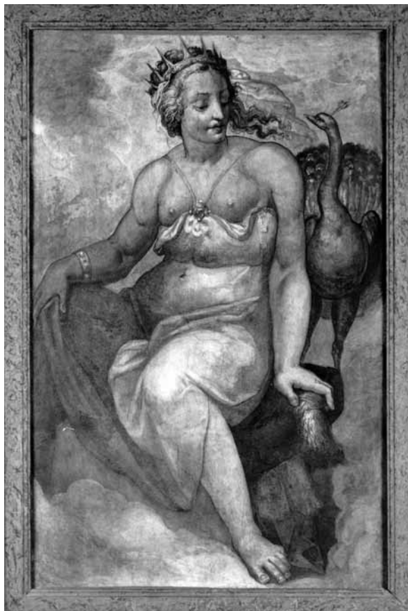
6 Italian school of the second half of the 16th century, Juno with a peacock. Budapest, Museum of Fine Arts.