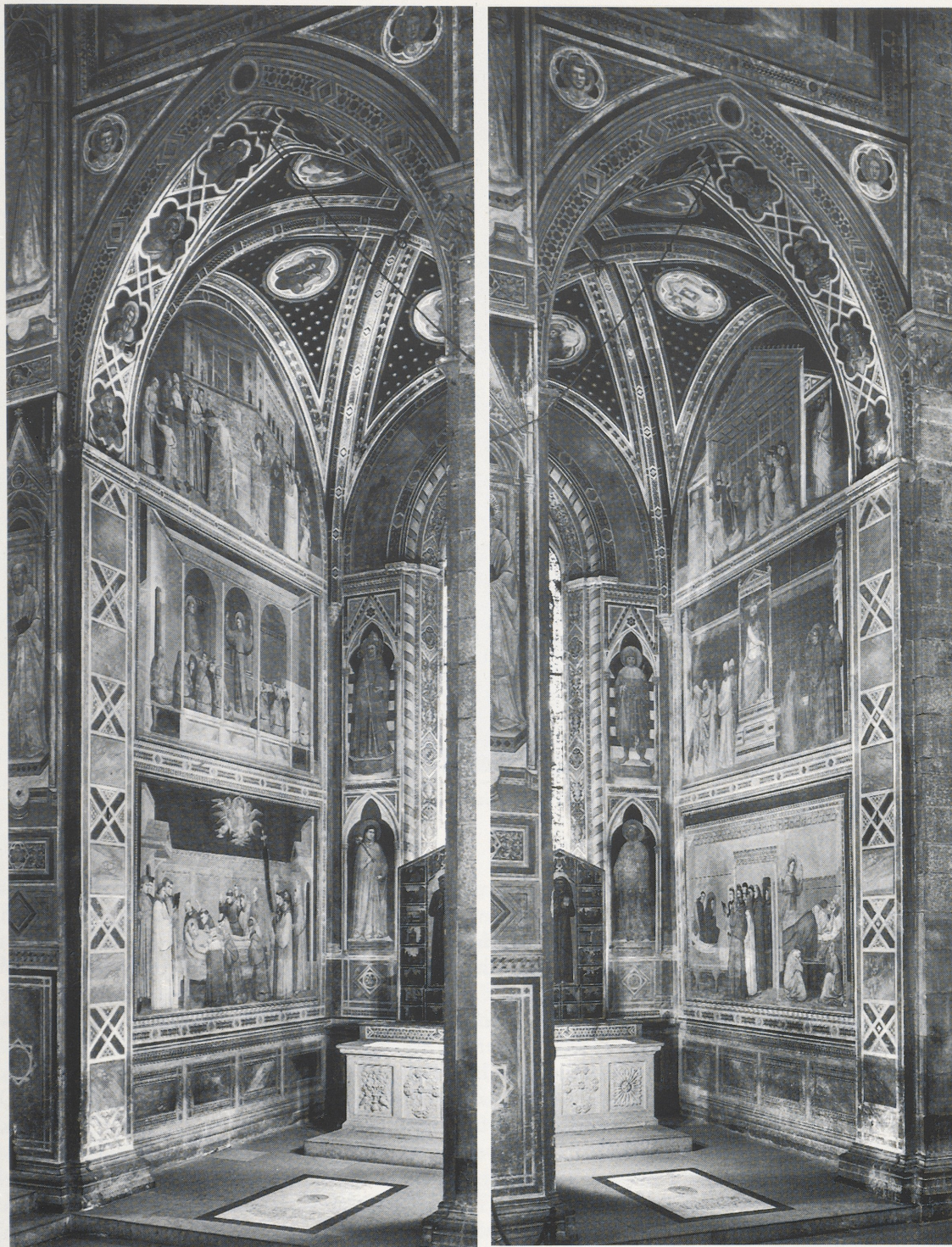
2 e 3 Giotto, Legende des hl. Franz von Assisi. Florenz, S. Croce, Cappella Bardi.