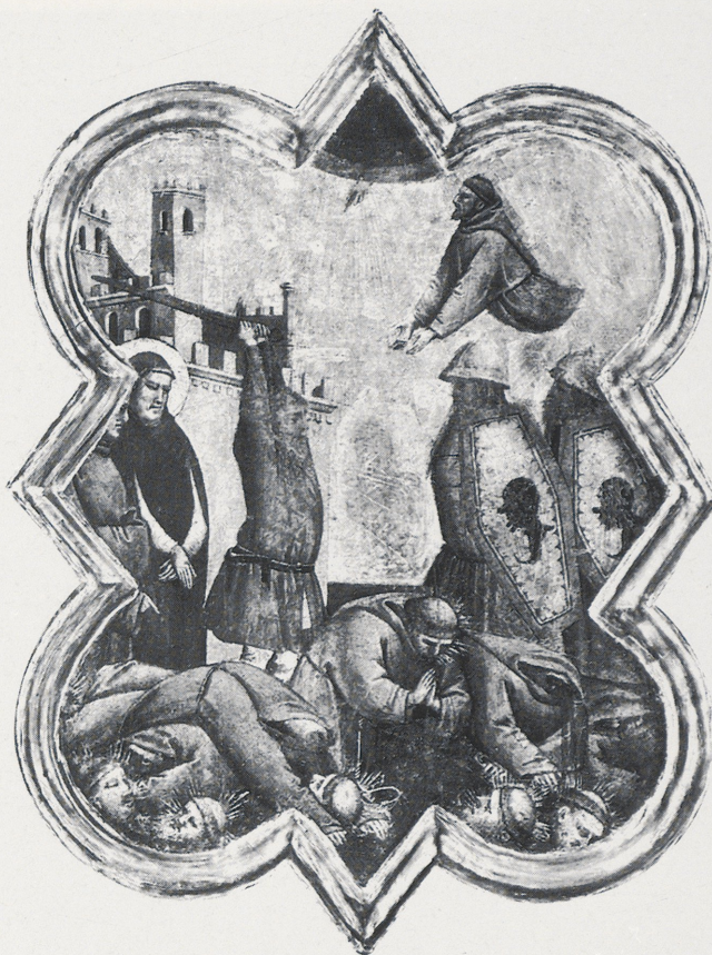
9 Taddeo Gaddi, Das Martyrium der Franziskaner in Marrakesch. Florenz, Accademia.