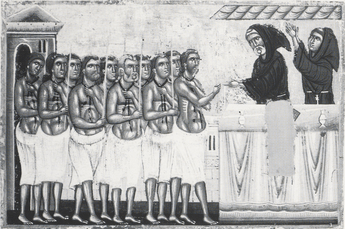
10 Die processio nudorum in Coimbra. Franziskus-Tafel (Ausschnitt), Florenz, S. Croce, Cappella Bardi.