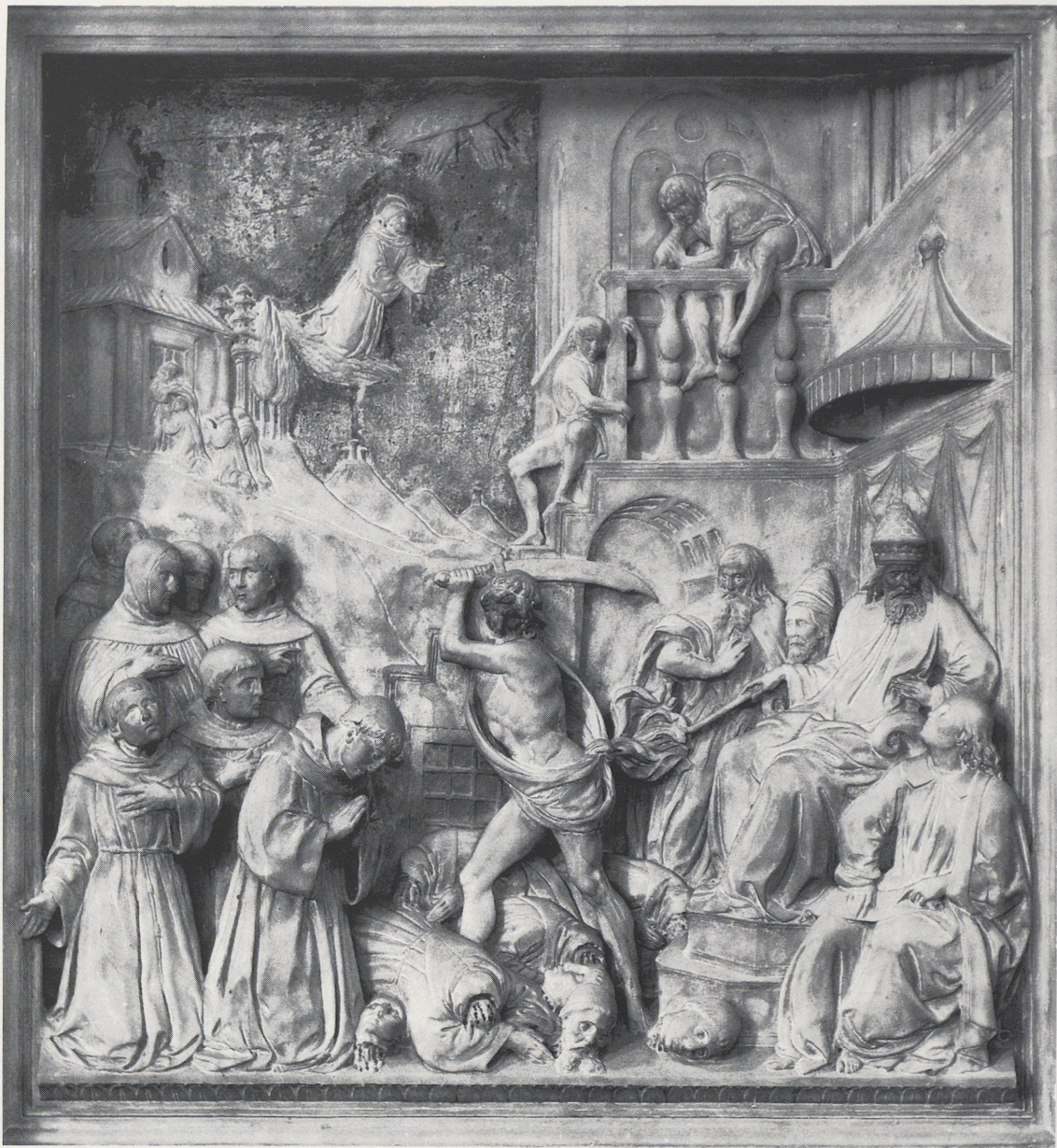
7 Benedetto da Maiano, Die Hinrichtung der franziskanischen Protomärtyrer in Marrakesch. Florenz, S. Croce.

also, an dem die Vertreter der europäischen Mächte zur Beratung der Türkenabwehr in Rom versammelt waren. Auch die schriftliche Bestätigung ein knappes Jahr später, am 7. August 1481, erfolgte in den Monaten, in denen sich die Anstrengungen des Papstes erneut darauf richteten, die europäischen Fürsten von der günstigen Gelegenheit einer endgültigen Vertreibung der Türken zu überzeugen. Angesichts dieser politischen Situation gewinnt die Heiligsprechung der fünf franziskanischen Protomärtyrer und das von den politischen Ereignissen bestimmte 'procedere' des Papstes in dieser Angelegenheit eine Bedeutung, die über ordenspolitische Überlegungen hinausgeht. Sie muß vielmehr als ein religiös-politischer Appell an alle Christen verstanden