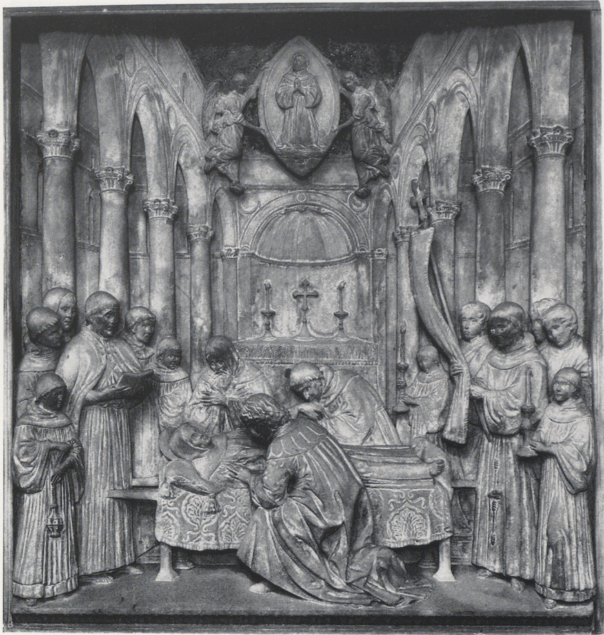
6 Benedetto da Maiano, Die Exequien des hl. Franz von Assisi. Florenz, S. Croce.

für eine gewaltige Vermehrung der Privilegien des Franziskanerordens. Er erhob das Fest des hl. Franz zu einem gebotenen Feiertag, und am 14. April 1482 sprach er Bonaventura heilig. In zwei Bullen von 1482 und 1483 entschied er die jahrhundertlang leidenschaftlich geführte Diskussion zwischen den Dominikanern (Maculisten) und den Franziskanern (Immaculisten) um die Immaculata Conceptio , die gerade durch die Schriften des Dominikaners Vincenzo Bandelli aufs Neue heftig entflammt war 27 , im Sinne der Franziskaner. 28 Schließlich ergriff er auch in dem Streit um die Verehrung der Stigmata der hl. Katharina von Siena zu Gunsten der Franziskaner Partei. In vier Bullen aus den Jahren 1472, 1475, 1478 und 1480 verbot er, sie oder andere Heilige mit Wundmalen darzustellen, so daß der Vorrang des hl. Franz, als des einzigen wahren Nachfolgers Christi, gewahrt blieb. 29