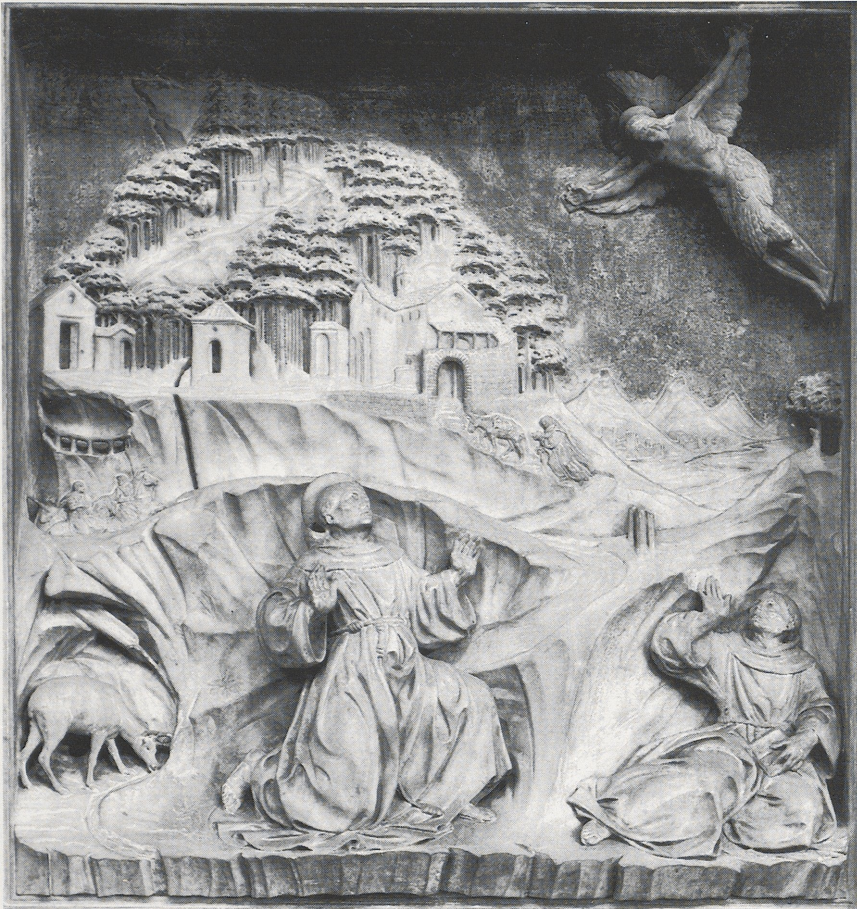
5 Benedetto da Maiano, Die Stigmatisation des hl. Franz von Assisi. Florenz, Santa Croce.

franziskanischen Heiligen sollte die nun glücklich erreichte Heiligsprechung feiern. Mit dieser Feststellung ist zugleich ein sicherer terminus post quem für die Datierung der Kanzel gewonnen, die bislang immer noch überwiegend um die Mitte der 70er Jahre datiert wird. 25 Da die Martyriumsszene — wie wir aus den erhaltenen Terrakottamodellen wissen — von vornherein vorgesehen war, kann das Bildprogramm für die Reliefs der Kanzel erst nach der Heiligsprechung der fünf Protomärtyrer festgelegt worden sein. Die Kanzel und ihr plastischer Schmuck sind also in der ersten Hälfte der 80er Jahre entstanden. 26