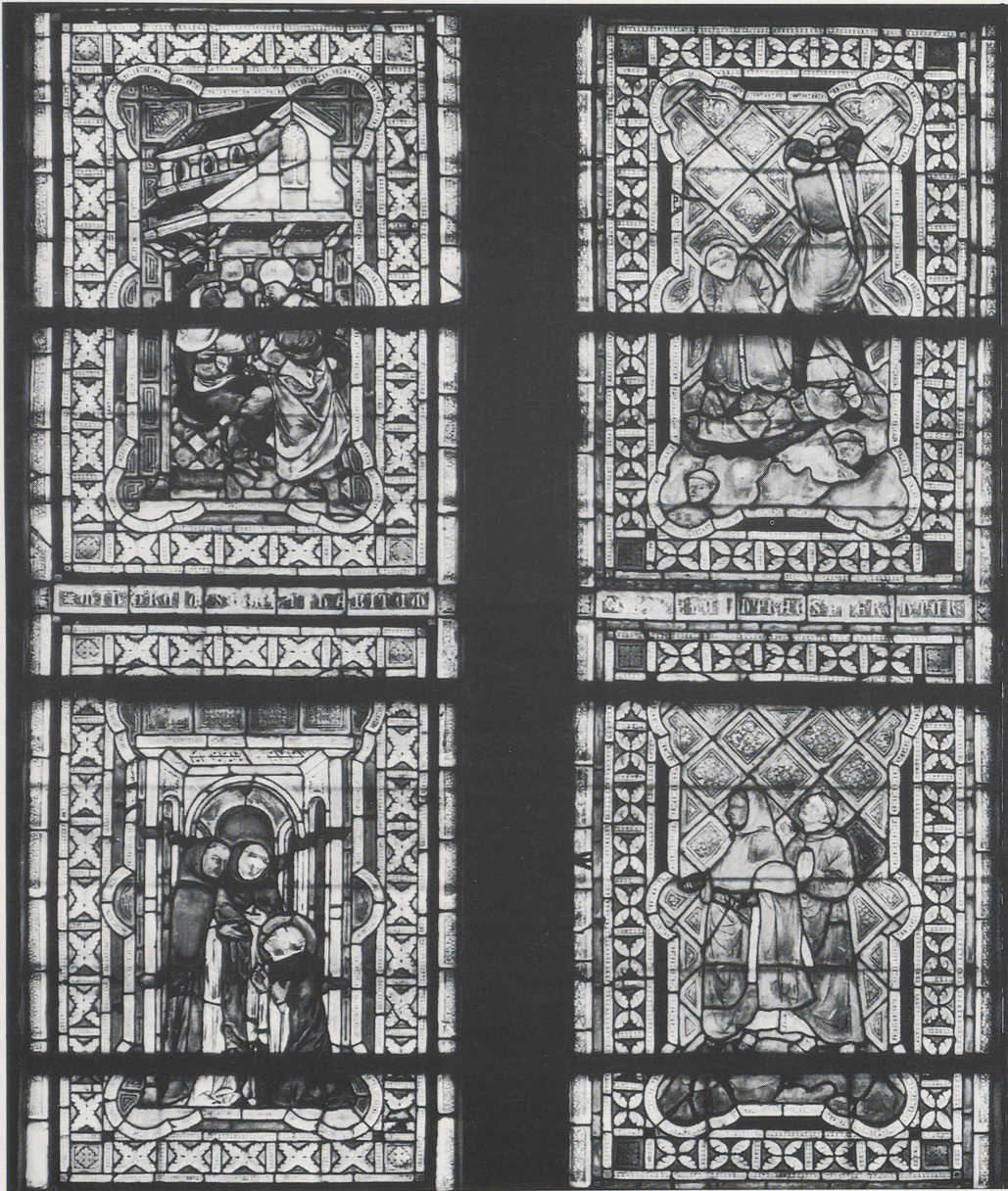
8 Der Martyrium der Franziskaner in Marrakesch und der Abschied des hl. Antonius von Padua aus dem Orden der Augustinerchorherren. Assisi, S. Francesco, Unterkirche, Antonius-Kapelle.

werden, es den Protomärtyrern gleichzutun. Die Erinnerung an die fünf franziskanischen Brüder sollte beispielhaft den Mut und die Opferbereitschaft all derjenigen vor Augen führen, die bereit gewesen waren, für ihren Glauben zu streiten und zu sterben, und — nicht nur im Geiste, sondern auch durch Taten — zur ihrer Nachahmung aufrufen. Wir dürfen also die Heiligsprechung der fünf franziskanischen Protomärtyrer als ein von Sixtus IV. bewußt eingesetztes Mittel religiöser Propaganda verstehen, mit der der Papst den Kreuzzugseifer stimulieren wollte. 34