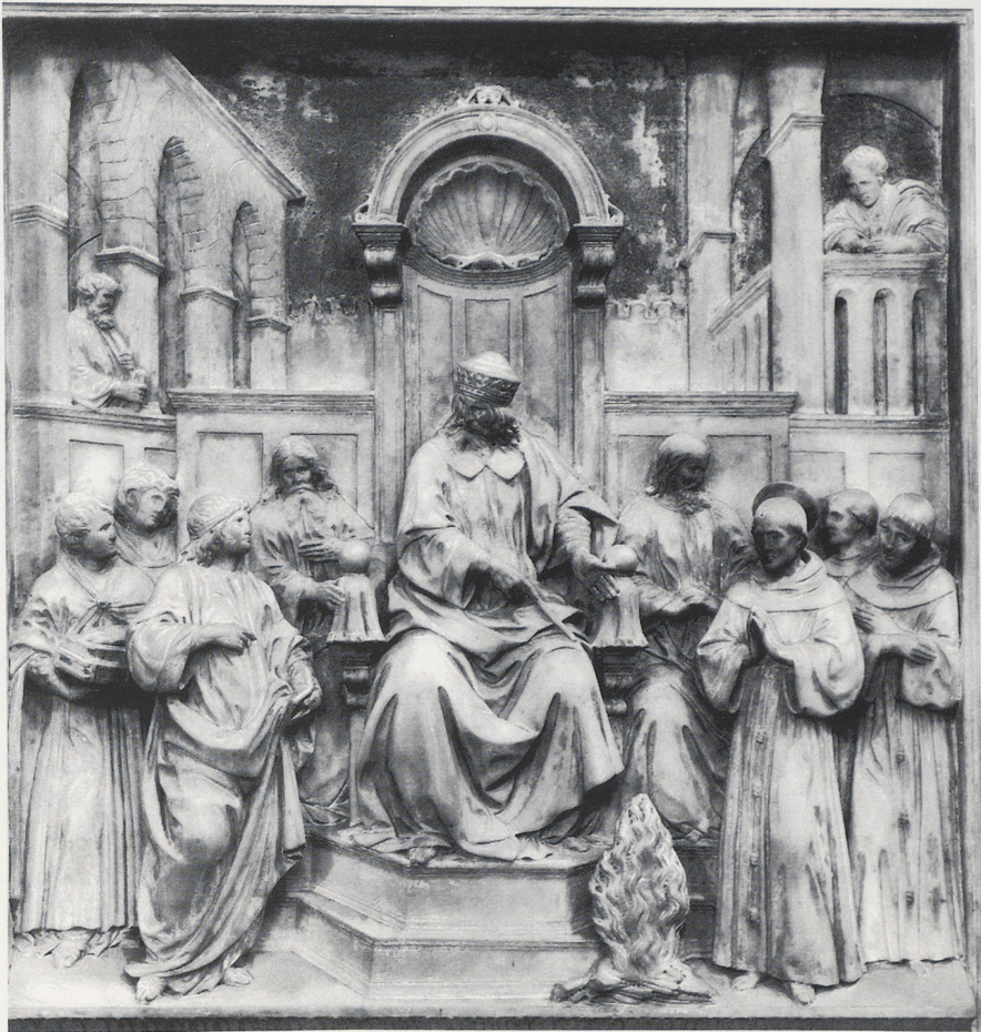
11 Benedetto da Maiano, Die Feuerprobe des hl. Franz von Assisi. Florenz, S. Croce.