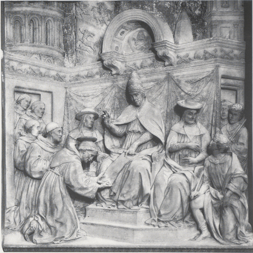
4 Benedetto da Maiano, Die Bestätigung der Regel des hl. Franz von Assisi. Florenz, S. Croce.

1481, erfolgte die schriftliche Bestätigung ihres Kultes (Anhang). 22 Damit waren die Protomärtyrer als Heilige von der Kirche offiziell anerkannt, und so die Voraussetzung für die liturgische Verehrung auch innerhalb des Franziskanerordens geschaffen. 23