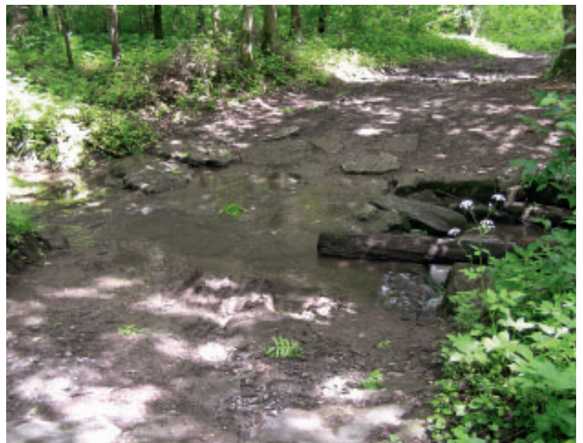
2 Furt durch den Häringswiesenbach.