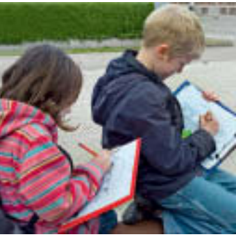
11 Zwei Schüler beim Zeichnen eines der barocken Torhäuser in Ludwigsburg.