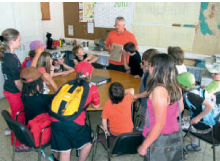
6 Vortrag der selbst erarbeiteten Denkmalbeschreibungen in Herbolzheim.