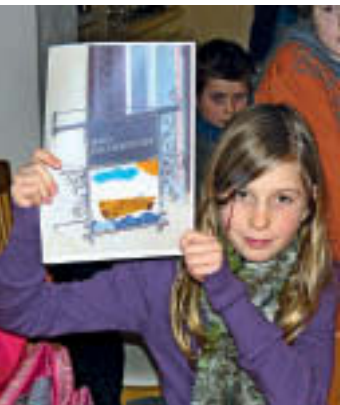
4 Eine Schülerin präsentiert das von ihr gestaltete Steckschild für das Haus Fischerzunft in Bad Säckingen.

fasst. Das Haus Fischerzunft wird derzeit Schritt für Schritt wiederhergestellt und bietet zahlreiche „Sichtfenster“ in die Vergangenheit. Anfassen und Begreifen waren hier ausdrücklich erwünscht. Das Einmessen von Gebäudedetails und deren Einzeichnung in Grundrisse sowie die Gestaltung eines Stechschildes auf Papier bereiteten den Kindern große Freude (Abb. 4).