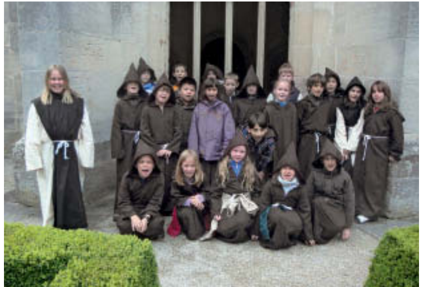
15 Schüler der Grundschule im Aischbach bei der Besichtigung des Klosters Bebenhausen im Mönchskostüm.

Der zeitliche Aufwand für die Projekte auf Seiten der Architekten betrug zwischen 8 und 20 Stunden. Er fiel mitunter höher aus als erwartet, was auch der Tatsache geschuldet war, dass in der Pilotphase altersspezifische Materialien zur Einführung in die Grundlagen der Denkmalpflege nicht vorlagen. Großer Dank gebührt den Architekten, die bereit waren, neben ihrer Berufstätigkeit ehrenamtlich mit Grundschulklassen zusammenzuarbeiten. Erst durch ihren Einsatz wurde die Aktion überhaupt möglich. Trotz dieser Arbeitsbelastung haben alle beteiligten Architekten angekündigt, weiterhin Denkmalprojekte für Schüler anzubieten. Erwartet wird, dass sich der zeitliche Aufwand für die Organisation reduziert, weil zum Beispiel Arbeitsblätter für den Einstieg und kreative Ideen von den bisherigen Projektteilnehmern weiter verwendet werden können. Außerdem stellt die Denkmalpflegepädagogik des Landesamtes für Denkmalpflege altersspezifische Materialien zusammen und kann „Tipps und Tricks“ nennen. Herzlich bedanken möchten sich die Aktionsinitiatoren auch bei den beteiligten Lehrern, die trotz des zusätzlichen Vorbereitungs- und Zeitaufwandes bereit waren, sich auf diese neue Herausforderung einzulassen.