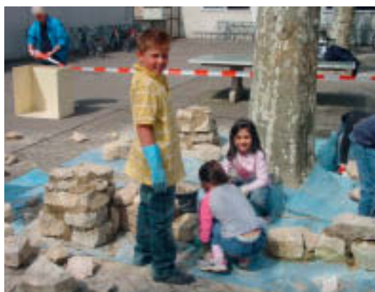
10 Nach der Besichtigung des Denkmals gestalten die Kinder auf dem Schulhof die Burgarchitektur nach.