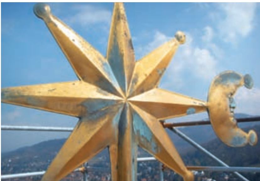
4 Freiburg Münster. Korrodierte Wetterfahne vor der Restaurierung.

architektur genauer untersucht (Stefan King: Zum Schöpfungsportal des Freiburger Münsters, in: Denkmalpflege in Baden-Württemberg 37/2, 2008, S. 69–77).