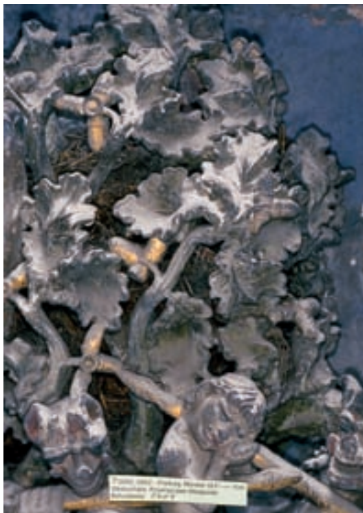
1 Freiburg Münster. Turmhalle, Tympanon: Detail der Judasszene mit Staub, Vogelkot und Schmutzkruste.

Jahrhundertealte Staubschichten, Vogelkot und Verwitterung setzen dem Buntsandstein zu. Bekannt sind die Bilder der bis zur Unkenntlichkeit entstellten mittelalterlichen Bauskulpturen und Bildwerke, die nach ihrer Reinigung die fragile Patina des Alters in ihrer herben Schönheit zeigen. Gotische Figuren mit Dübeln beziehungsweise Nadeln aus Glasfasern zu sichern, ist neben der steinmetzmäßigen Kopie inzwischen Alltag am Freiburger Münster. Dem Laien weniger bekannt dürfte die Methode sein, Zierarchitekturen und Skulpturen durch Stabilisierung des geschädigten Buntsandsteins mit Kieselsäureester zu festigen. Die Kanülen und Schläuche, mit denen Kieselsäureester in den Stein eingetragen wird, erinnern an intensivmedizinische Eingriffe, weniger an steinerhaltende Sicherungen. Die aktuellen Konzepte der Landesdenkmalpflege am Münster zielen darauf, Architektur und gotische Bildwerke an ihren originalen Standorten zu bewahren. Denkmalpflegerische Forderungen wie Konservieren statt Erneuern, Restaurieren statt Kopieren stehen dabei im Vordergrund (Abb. 1).