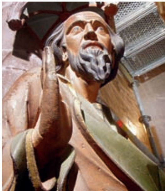
5 Freiburg Münster. Vor Ort gesicherter Wasserspeicher während der Festigung mit Kieselsäureester.