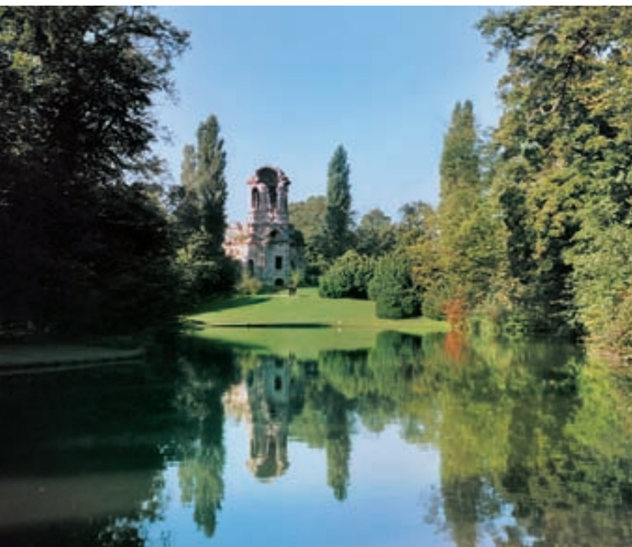
7 Merkurtempel, freigelegt, 2004.

ten insbesondere zur Freihaltung der Aussichten abermals geschnitten werden. Das Ergebnis dieser „Baumverjüngung“ wurde noch Jahrzehnte später in Fachkreisen als beispielhaft herausgestellt und in dieser Pflegemethode die Hauptaufgabe des Gärtners einer solchen Anlage gesehen, nämlich das Konservieren des Vorhandenen, was in Schwetzingen nach den Gegebenheiten als gelöst galt.