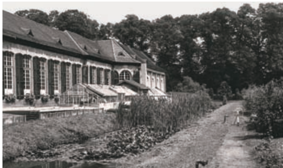
5 Orangerie mit Kanal, 2005.