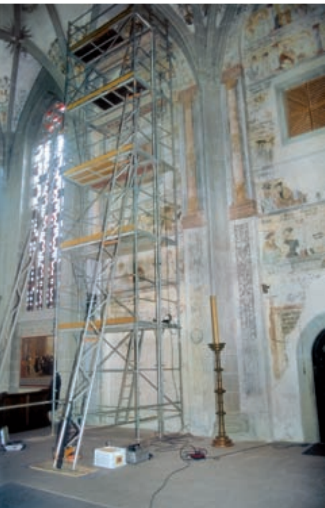
6 Einrüstung Südwand September 2002.