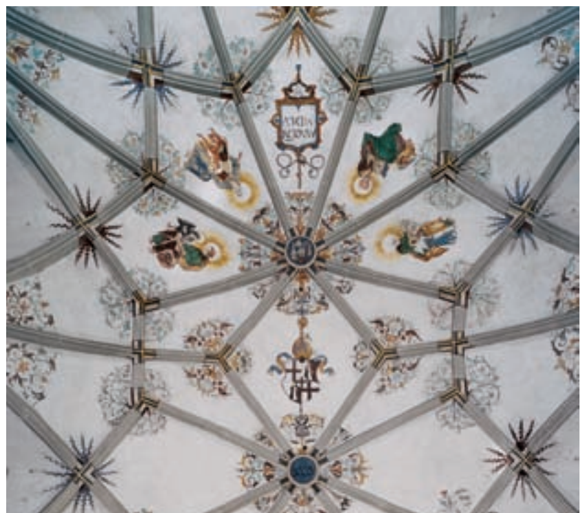
2 Chorgewölbe mit der Ausmalung von Marx Weiß d. J. von 1555, nach der Restaurierung.

Chor (Abb. 6). Noch vor der Untersuchung konnten über die Auswertung des Archivmaterials in der Außenstelle Freiburg des damaligen Landesdenkmalamtes erste Erkenntnisse über die Restaurierungsgeschichte gewonnen werden. Nähere Einblicke am Bestand ergaben sich mit der kompletten Einrüstung des Chors ab Juli 2005.