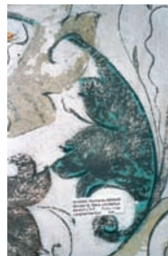
7 Gewölbe, Rankenmalerei mit verschwärztem Malachit.

Erheblich gravierender waren die Eingriffe dieser Restaurierungsphase im Bereich der Wandflächen. 1968 wurden die Wandmalereien im Auftrag des staatlichen Hochbauamtes Konstanz freigelegt und restauriert. Nach historischen Aufnahmen zu urteilen, hatten sich Teile der Wandmalereien seinerzeit bereits selbst freigelegt. Starke mechanische Beschädigungen der Malerei sind auf die unsachgemäße Freilegung zurückzuführen (Abb. 9). Um einen geschlossenen Gesamteindruck zu erhalten, wurden die Fehlstellen der Malerei mit einer Farblasur der Umgebung angeglichen. Je nach Erhaltungszustand und Größe beschränkte man sich dabei auf die Fehlstellen oder lasierte teilweise stark interpretierend großflächig über. Stellenweise konnten auch unterschiedliche unsachgemäß aufgetragene