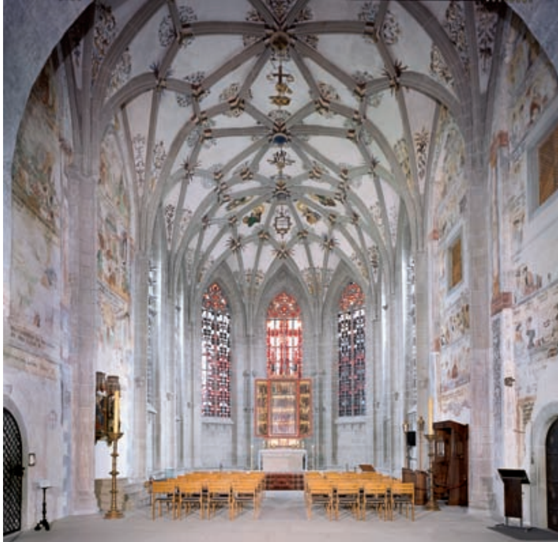
1 Münster St. Maria und Markus, Blick in den Chor, nach der Restaurierung.

Höhe der Joche beträgt ca. 12 m, die Breite annähernd 4 m. Die Sockelbereiche in einer Höhe von ca. 3 m sind monochrom gefasst.