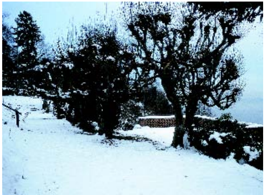
Die von Demme erbaute Terrasse mit dem Hainbuchengang von Westen aus gesehen im Winter und zeitigem Frühjahr.

Der Bericht mag deutlich machen, dass die lange überfälligen Pflegemaßnahmen nicht zu einem