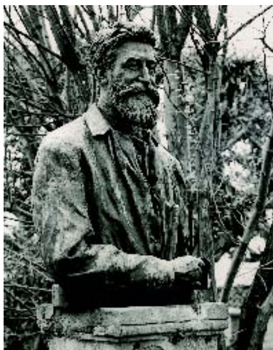
1 Die Büste Fritz Mauthners zwischen den Rosen im Garten des Glaserhäusle vom Bildhauer Max Klein (1847 bis 1908).

Mauthner, der in den knapp anderthalb Jahrzehnten ab 1909 die Gartenflächen weiter parkartig ausgestalten ließ, hat uns mit seinem um-