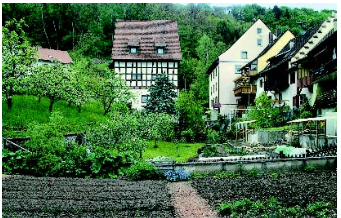
7 Die Bewohner der Gerberstraße bewirtschaften bis heute die unterhalb ihrer Häuser im Grabenbereich liegenden Gärten.

Stühlingen steht am Scheidepunkt, ein stolzes, noch immer im Wesentlichen in seine historische Kulturlandschaft eingebettetes Bürgerstädtchen mit wiederherstellbarer Sichtbeziehung zum