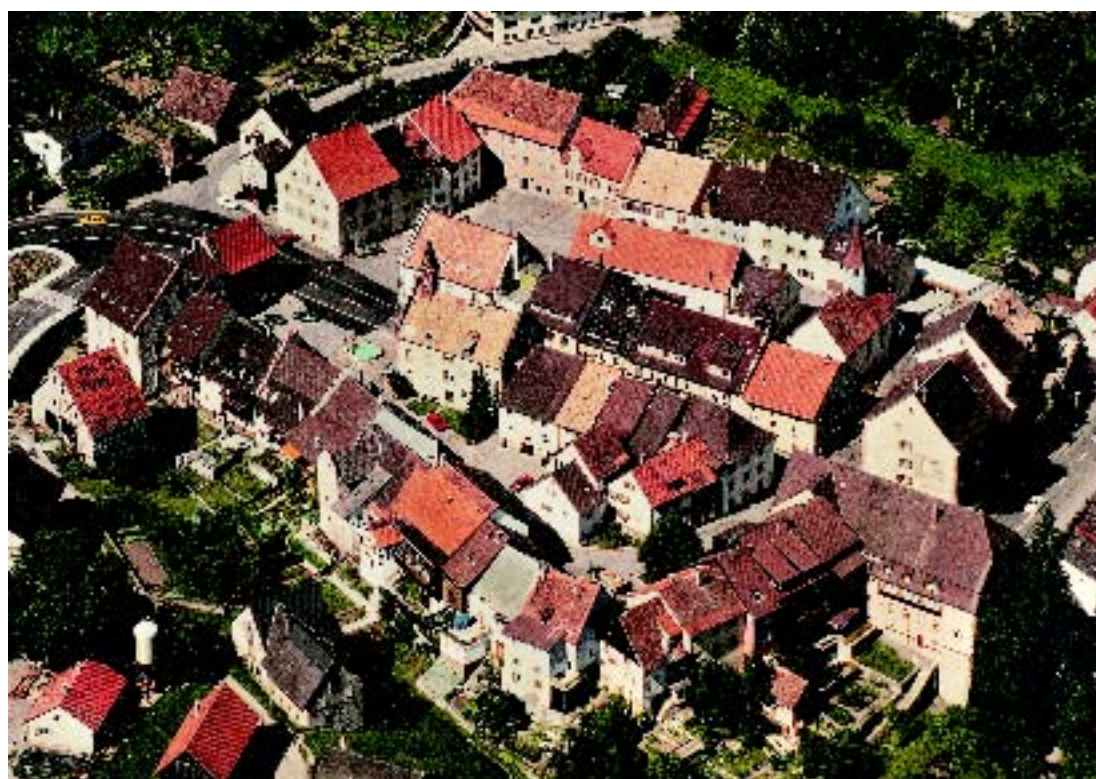
3 Stühlingen von Südosten, Luftbild von 1986/87. Im Vordergrund sind die Bürgergärten im Grabenbereich zu erkennen, links oben die Gärten am Fuß der Schlosshalde, die jetzt überbaut werden sollen, rechts oben die große Grünfläche des ehem. Balbach’schen Gartens.

Etwa dreiviertel der Bürgerhäuser in der Stühlinger Altstadt sind entlang der Stadtmauer gebaut. Der Plan des Geometers Johann Michael Mayer von 1848 und die heutige Aufteilung zeigen, dass jedem dieser Häuser der vorgelagerte Gra-