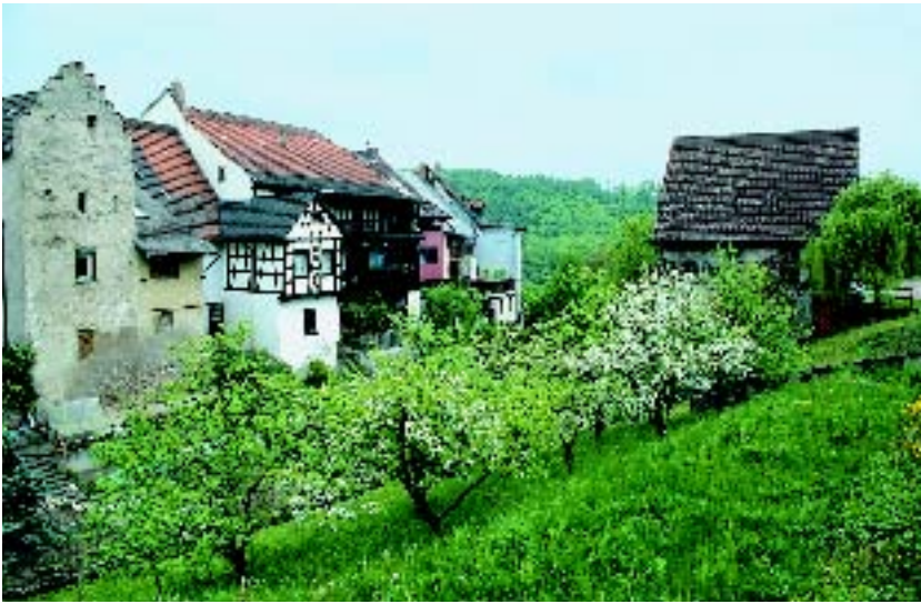
6 Der Grabenbereich der Gerberstraßenhäuser südwestlich der Stadt von Süden aus gesehen.

Gartengrundstücken, lässt sich bis heute an der kleinteiligen Parzellierung ablesen, jedes Fleckchen wird genutzt, zwischen den Gartengrundstücken sind schmale Wege zur Erschließung der Baumgärten am Gegenhang des Grabenbereiches ausgeschieden.