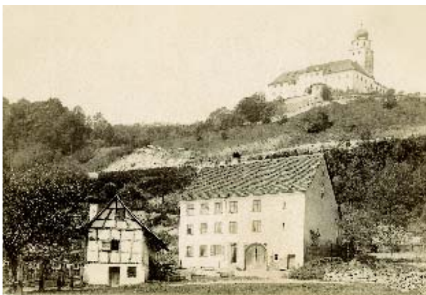
2 Der offengehaltene Stühlinger Schlossberg in den 1880er Jahren.

wehrtechnischen Bedeutung vieler Befestigungsanlagen und schließlich ihrer Aufgabe – wurden die Gärten zur Dauereinrichtung. 1770 bis 1830, die Goethezeit, gilt als Blütezeit der bürgerlichen Gartenkultur in Deutschland. Allerorten wurden Gärten mit Hecken umpflanzt, umzäunt oder ummauert und das Gelände, wo notwendig, terrassiert, Gartenhäuschen entstanden gerade von der Barock- bis in die Biedermeierzeit. Historische Karten, Flurnamen, Stiche und da und dort erhaltene Teilbereiche überliefern uns diese frühneuzeitliche Gartenkultur. Es sei beispielhaft erinnert an die in „Denkmalpflege in Baden-Württemberg“ vorgestellten vier Gartenhäuschen aus dem frühen 19. Jahrhundert, die sich in Tübingen am Ammerufer erhalten haben.