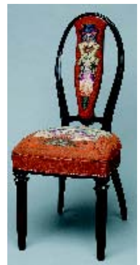
Bernhard Pankok, Stuhl vom Haus Rosenfeld.