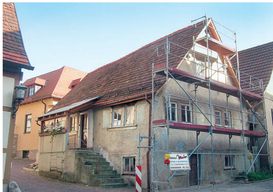
6 Handwerkerhaus aus dem 18./19. Jh. (Wilhelmstr. 4) in Weikersheim, das – als Teil der Gesamtanlage Weikersheim – vom Altstadtverein seit 2001 instand gesetzt wird, Zustand 2004.