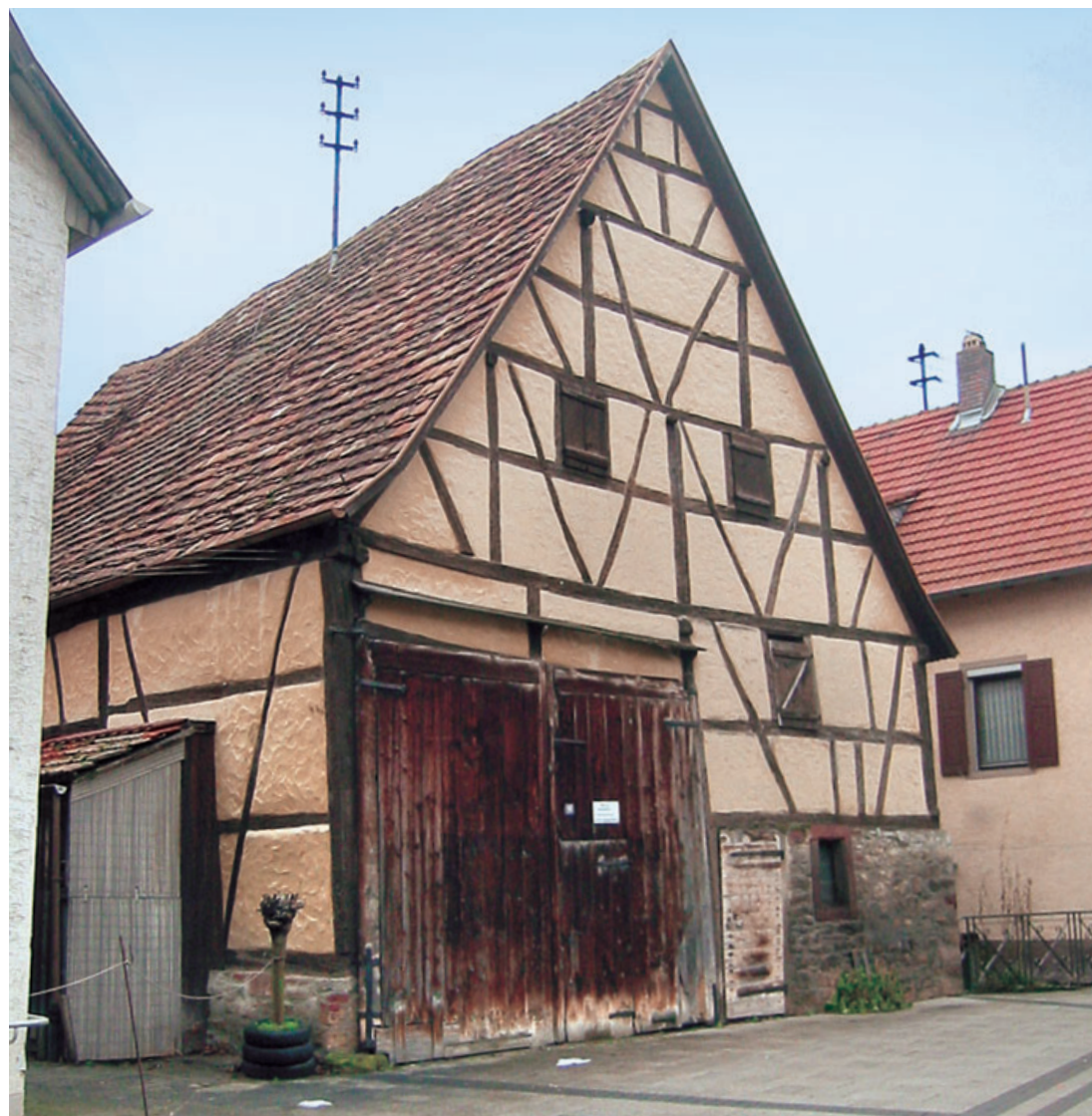
1 Scheune Bachgasse 16 in Tauberbischofsheim, erbaut 1675 (d), Zustand 2005.