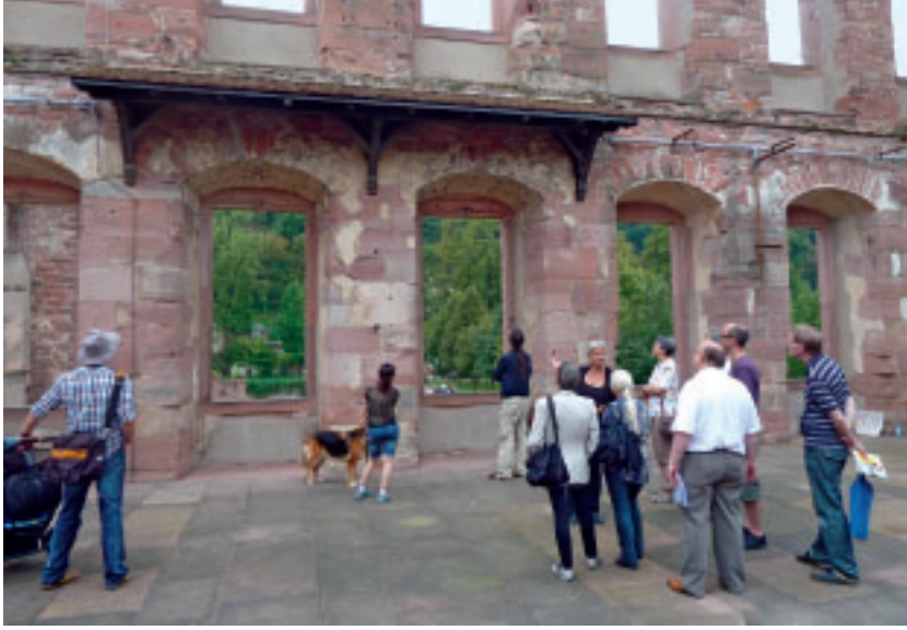
11 Heidelberg, Führung im Englischen Bau.

denkmalpflegerischen Werteplan für Riedlingen vor, und es war ein Film über die Landesdenkmalpflege in Baden-Württemberg zu sehen.