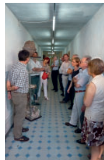
6 Exkursionsteilnehmer in einem der Kavaliershäuser der Eremitage Waghäusel.