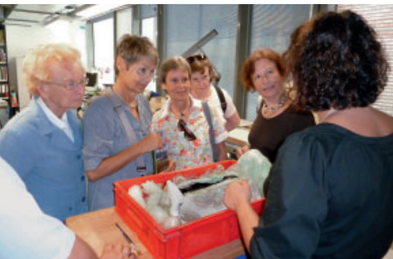
3 Führung durch die Restaurierungsateliers der Bau- und Kunstdenkmalpflege im Landesamt für Denkmalpflege Esslingen.