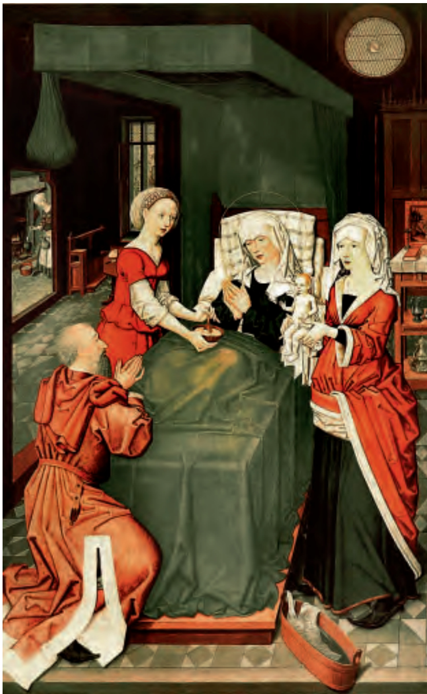
7 Ausstattung einer historischen Stube mit schwarz gefasstem Täfer, Schwäbischer Meister, Gemälde von 1489 mit der Geburt Maria (Staatliche Kunsthalle Karlsruhe).

handen ist oder nicht. Die Möglichkeit, dass Bretter oder Balken ganz einfach nur verschmutzt sind, kann bis zum eindeutigen Nachweis eines Anstriches nie ausgeschlossen werden. Außerdem sind in der Nähe von Beleuchtungsquellen und im Umfeld von Küchen Rußablagerungen, wie sie durch die Art der Beleuchtung (Ölleuchten und Kerzen) und durch die offenen Herdstellen im ganzen Haus vorkommen können, möglich. Die Bestätigung, dass es sich bei einer Oberflächenfärbung nicht um eine Verschmutzung, sondern tatsächlich um einen Anstrich handelt, kann vor allem bei rußpigmentierten Farben nur durch den Nachweis eines Bindemittels erfolgen. Erst in den Proben lassen sich die verwendeten Pigmente und Farbstoffe verlässlich von vermeintlichen Verschmutzungen unterscheiden.