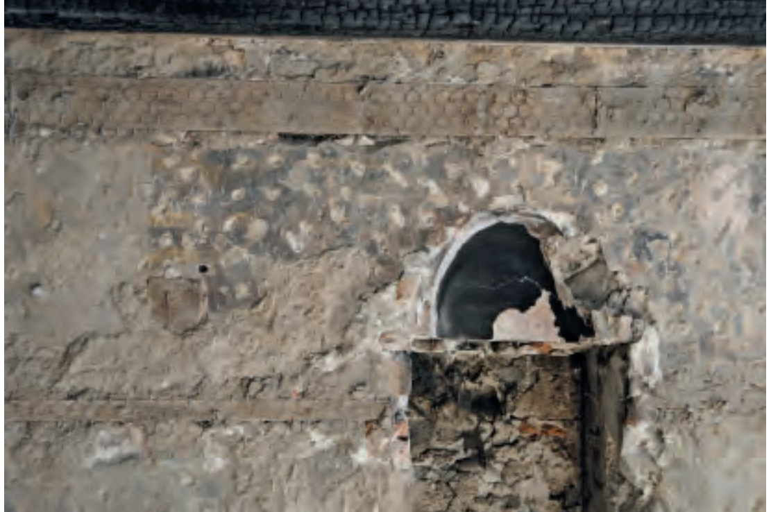
4 Überlingen am See, Franziskanerstraße, Stube mit schwarzen Wand- fassungen auf Putz vor 1434 (d).

mikrochemisch differenziert werden. Interessant war zudem das Untersuchungsergebnis, dass die beiden Vertäfelungen, die auf den Fensterlaibungen übereinanderlagen, exakt je einer der beiden Farbfassungen zugewiesen werden konnten. So war der Anstrich des älteren, unteren Täfers ausschließlich mit Ruß und Ocker pigmentiert, während der Anstrich des darüberliegenden Täfers ausschließlich Kasslerbraun enthielt. Das legt den Schluss nahe, dass bei einer Renovierung, bei der die Fehlstellen an Wänden und Decke ausgebessert wurden, die Fensterlaibungen ein neues Täfer bekamen. Über einen Zeitraum von mehr als 200 Jahren gab es hier also keine farblichen Veränderungen. Die Renovierung der Stube musste spätestens im 17. Jahrhundert erfolgt sein, denn im 18. Jahrhundert wurde der Raum durch eine abgehängte Decke und überputzte Wände völlig überformt.