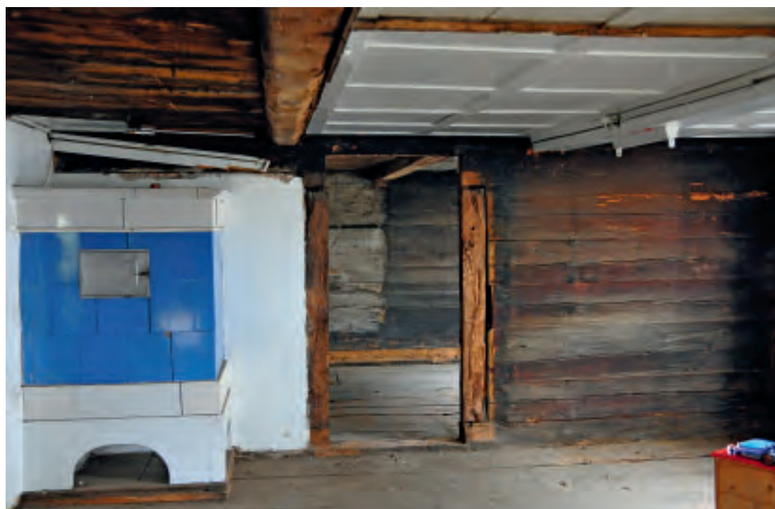
3 Ländlicher Blockbohlenbau aus Walchwil im Kanton Zug (CH), Stube von 1580 mit Schwarzfassungen. Der Bau wurde im August 2011 abgebrochen.