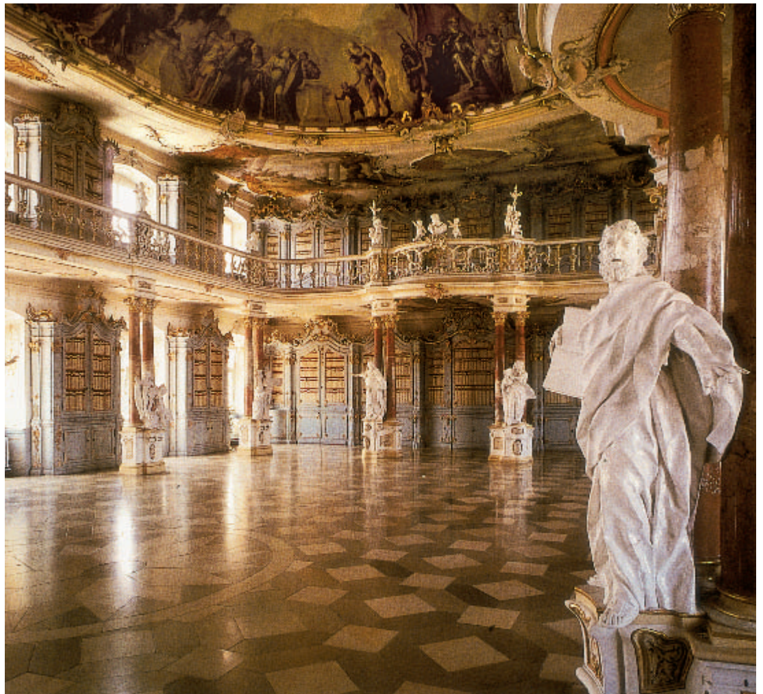
3 Bibliothekssaal im Kloster Schussenried.

Natürlich waren dann nach fast 200 Jahren intensiver Nutzung bei immer knappen Mitteln und vielleicht auch nicht allgemein verbreitetem Verständnis für den architektonischen und künstlerischen Wert dieser Anlage viele Dinge nachzuholen, das war zunächst die Substanzerhaltung,