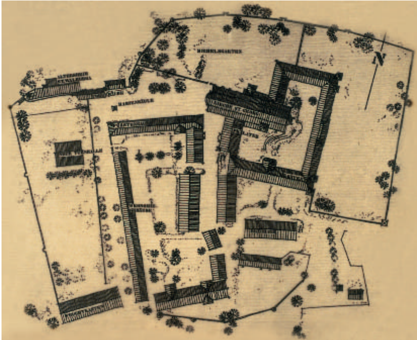
2 Grundriss der Klosteranlage Ochsenhausen.