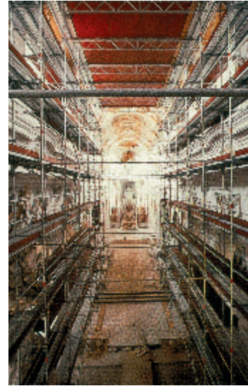
1 Kloster Ochsenhausen.

An wenigen Beispielen soll dies im Folgenden erläutert werden.