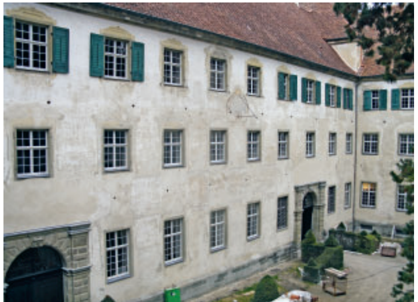
15 Fassade im Tafelobstgarten (Westflügel) nach der Konservierung.