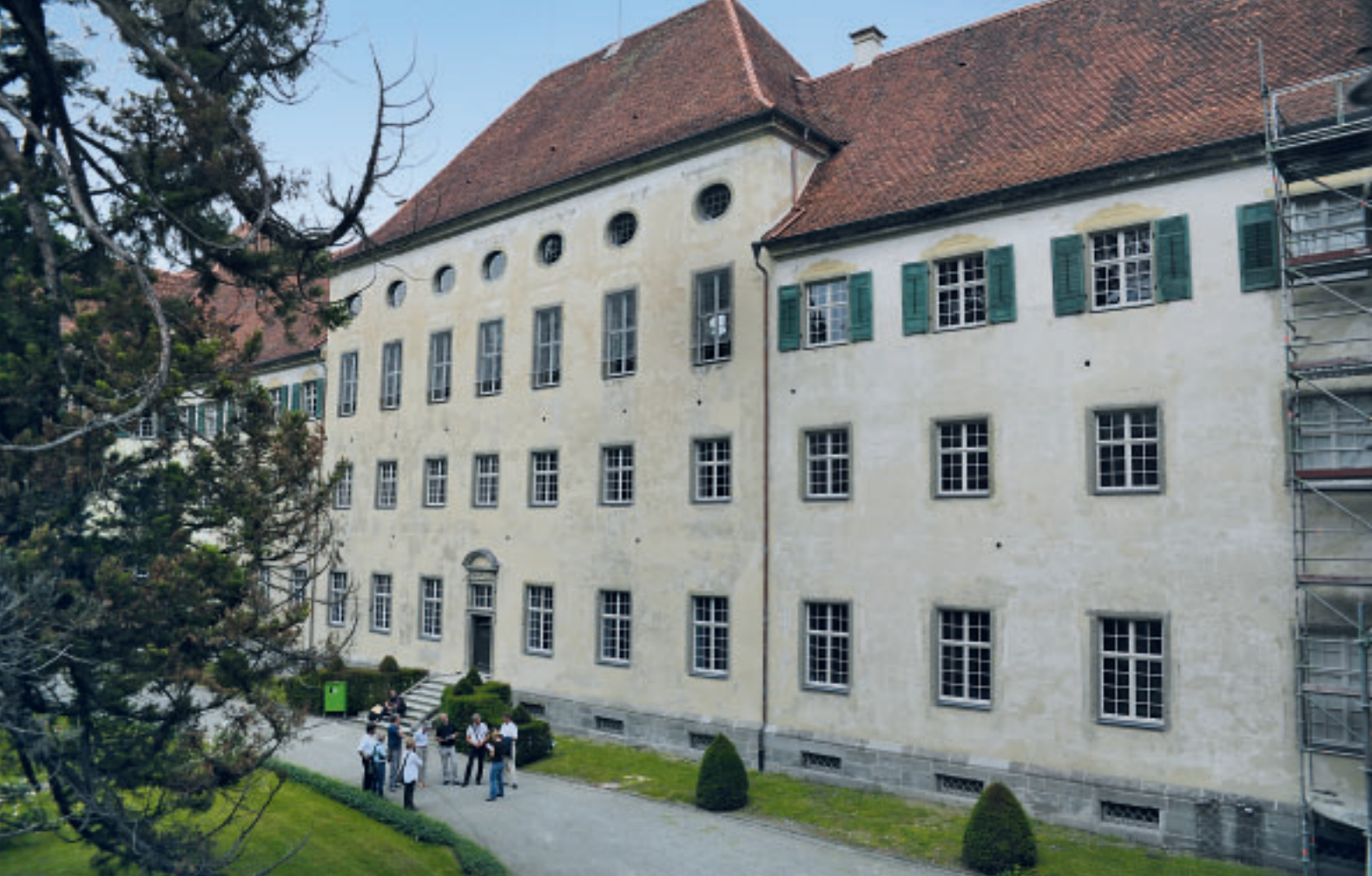
16 Fassade im Sternenhof (Ostflügel) nach der Konservierung.

Konzept von Beginn an nicht nur mitgetragen, sondern gegenüber Andersdenkenden auch verteidigt. Sie haben damit einen entscheidenden Beitrag zur Akzeptanz einer reinen Konservierung der Fassaden geleistet. Ein weiterer Dank geht an Vermögen und Bau Baden-Württemberg, Amt Ravensburg und an die Planer und freiberuflichen Architekten und Restauratoren, die in konzeptionellen Fragen immer wieder den Schulterchluss mit der Denkmalpflege gesucht haben.