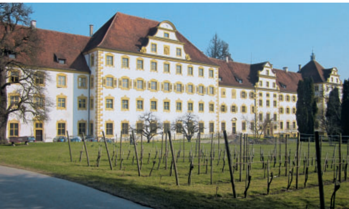
5 Schloss Salem, Gesamtaufnahme des Konvents von Süden mit rekonstruierter Gelbfassung nach Vorbild der Gestaltung von 1789.