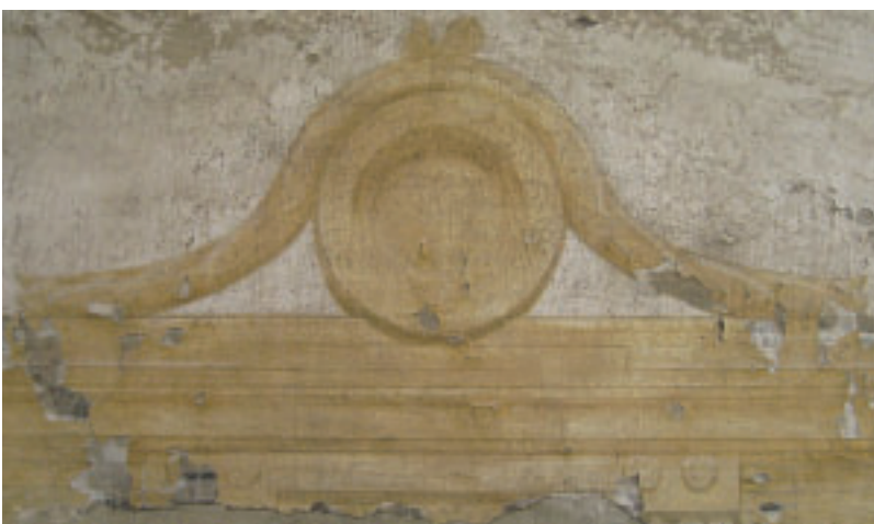
11 und 12 Vergleich von zwei Fassungsdetails: Fenster Malerei 1789 und 1986.

Die Wertigkeit dieses mit allen Alterungserscheinungen überlieferten Bestandes ließ im Hinblick auf seinen dokumentarischen Charakter aus denkmalpflegerischer Sicht kein anderes Konzept zu als eine reine Konservierung. Mit der Sicherung der Substanz und der zurückhaltenden Ausführung von neutralen Mörtelergänzungen wurde ein Konzept angestrebt, das alle Spuren der Geschichte von der Entstehung der Putze, der maltechnischen Ausführungen mit Ritzungen, der künstlerischen Gestaltungen bis hin zu den unterschiedlichen Alterungen ablesbar lässt. Ausgangspunkt der Überlegungen war auch, dass sich – zumindest in Baden-Württemberg – kein derartig umfangreicher Putzbestand mit Malerei aus der Zeit des 18. Jahrhunderts im Außenbereich erhalten hat. An den Außenfassaden sind alle Informationen, die die historischen Schichten in sich bargen, bei der Neuverputzung und der Rekonstruktion der 1980er Jahre verloren gegangen. Vergleicht man die Details der Bemalungen, so wird deutlich, dass die historischen Fassungen viel differenzierter und malerischer gestaltet sind als die Kopien (Abb. 11; 12).