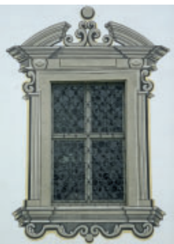
9 Die Rekonstruktion der Außengestaltung trifft auf die Rekonstruktion des halbseitig geschlosse- nen Innenhofes (Novizen- garten).

Fassungen mit modernen Werkstoffen rekonstruiert werden und der „Befund“ dann noch als Alibi herhalten muss.