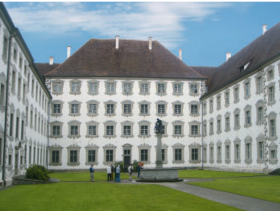
6 Blick in den „Novizen- garten“ mit der rekon- struierten Graufassung nach Vorbild von 1706.