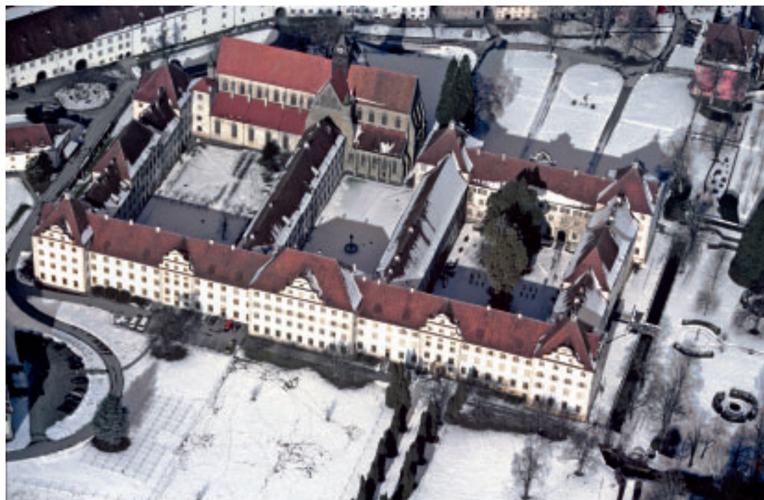
1 Schloss Salem, Luftbildaufnahme.

Die Mittel- und Eckrisalite der sonst dreigeschossigen Anlage weisen eine vierte Geschossebene beziehungsweise ein Mezzaningeschoss mit Okuli für die höheren Prunkräume auf, wie zum Beispiel den Kaisersaal. Gesteigert wurde die repräsentative