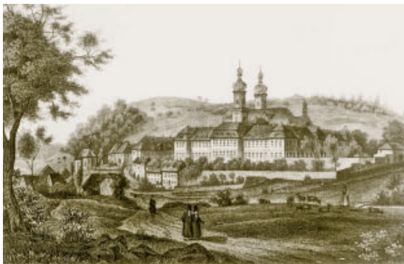
4 und 5 St. Peter im Schwarzwald. Barocke Klosteranlage mit vorgelagertem Grün- zug von Südosten, um 1840 und 2008.

Eine besondere Bedeutung kommt den Ortsrändern zu, dem Übergang vom historischen Ortskern in die Landschaft. In Lenzkirch-Saig, einem Ort im