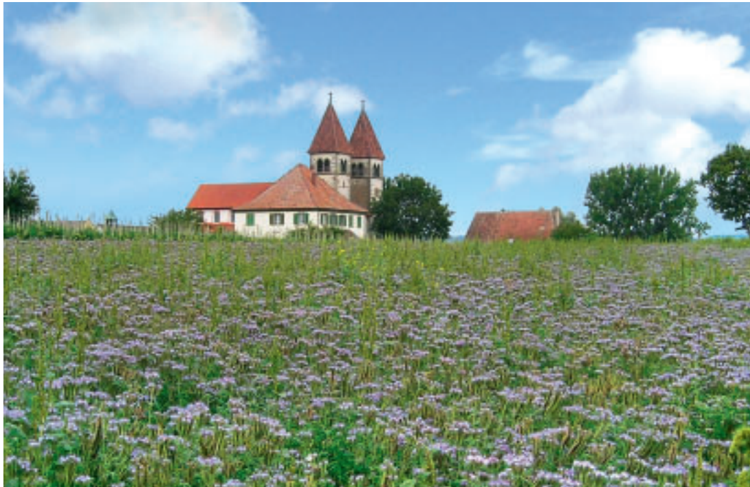
6 Reichenau-Niederzell. Landwirtschaftliche Fläche im Innern der Gesamtanlage mit der ehemaligen Stiftskirche St. Peter und Paul und dem Pfarrhaus, 2009.

Ortskern mit der Landschaft verbinden, tragen wesentlich zur landschaftlichen Einbindung des Klosters und des Dorfes bei. Im Flächennutzungsplan sind sie – ihrer Bedeutung für die erhaltenswerte Siedlungsstruktur entsprechend – als Grünflächen dargestellt oder gehören zum Außenbereich. Der Grünzug, der von Osten bis in die Ortsmitte reicht, steht in unmittelbarer Sichtbeziehung zur Südfassade der Klosteranlage, ihrer Hauptfassade zur Landschaft (Abb. 5). Dass dieser Situation schon in früherer Zeit eine besondere Bedeutung beigegeben wurde, zeigen historische Ansichten, so zum Beispiel ein Stahlstich, der um 1840 entstanden ist (Abb. 4). Überlegungen von Seiten der Gemeinde, den Flächennutzungsplan zu ändern und im Vorfeld des Klosters eine Baufläche für einen Lebensmittelmarkt auszuweisen, hätten eine erhebliche Beeinträchtigung der geschützten historischen Situation zur Folge gehabt. Es ist erfreulich,