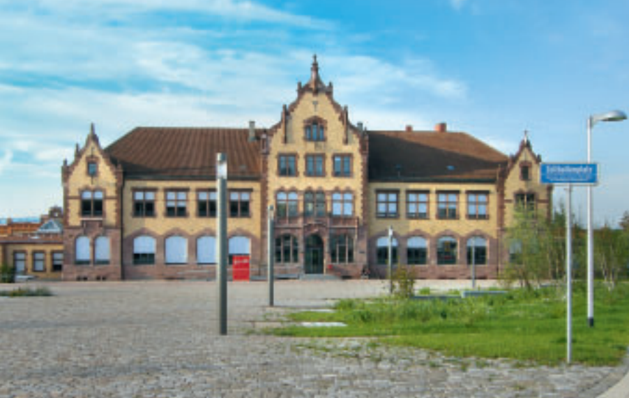
9 Freiburg i. Br. Güterbahnhof Nord, ehemaliges Verwaltungsgebäude, daran anschließend Zoll- und Güterhallen, 2011.