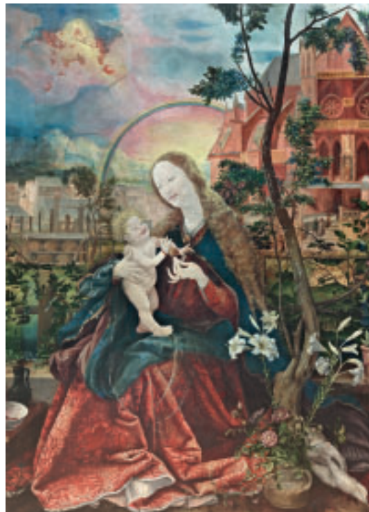
2 Zustand vor der Restaurierung 2012.

„Himmlicher Glanz“ vom vergangenen Jahr in der Dresdner Galerie Alte Meister, die prominente Madonnenbilder Dürers, Cranachs und vor allem Raffaels zeigte: Zwischen dessen „Sixtinischer Madonna“ und der „Madonna di Foligno“ aus den Vatikanischen Museen wurde die „Stuppacher Madonna“ präsentiert. Dies, obwohl Holztafelgemälde zu den empfindlichsten Kunstobjekten gehören und die 500 Jahre seit ihrer Entstehung teilweise heftige Spuren auf dem Tafelbild Grünewalds hinterlassen haben. Deshalb waren sich alle Beteiligten einig, die Ausleihe nur unter Einhaltung höchster Maßstäbe bei Transport und Klimastabilität zu gestatten und für den zukünftigen Erhalt der Madonna zusätzlich alle weiteren notwendigen Maßnahmen zu treffen. Hierzu gehört neben