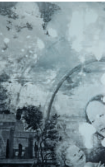
1 Zustand 1928 nach Abnahme der Übermalungen des 19. Jahrhunderts.