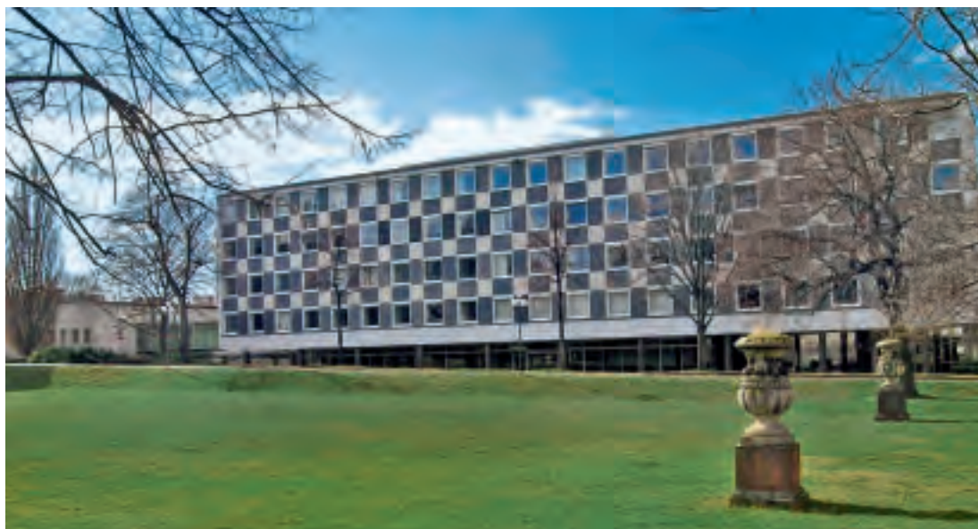
3 Gesamtansicht von der östlichen Parkseite.

Dr. Clemens Kieser Regierungspräsidium Karlsruhe Ref. 26 – Denkmalpflege