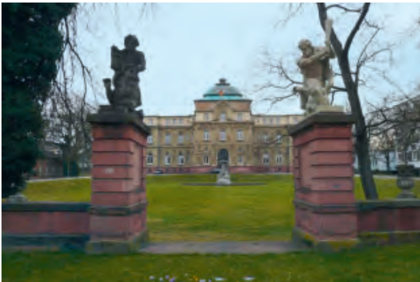
2 Karlsruhe, historische Südansicht Erbprinzpalais um 1910.