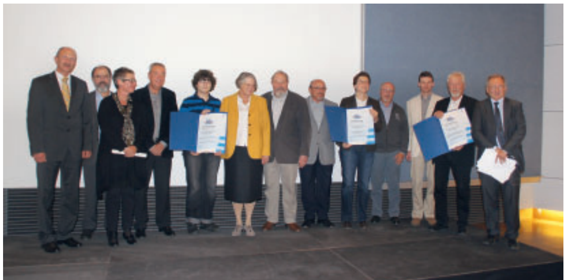
Verleihung des FörderPreises der Region Stuttgart 2012.

Beim dritten Preisträger handelt es sich um ein ebenfalls sehr systematisch und vor allem auch nachhaltig angelegtes Ehrenamtsprojekt. Die alte