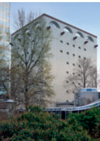
Zu den „unbequemen“ Denkmalen zählen auch Bunker wie dieser so genannte MVV-Bunker im Jungbusch in Mannheim.

Die Gespräche mit den Besuchern am Stand der Landesdenkmalpflege haben gezeigt, dass ein großes Interesse an der Arbeit der Denkmalpfleger in der Öffentlichkeit besteht. Viele Fragen beschäftigten sich zum Beispiel mit dem Umgang mit Kleindenkmalen oder Leitfäden für Denkmaleigentümer. Die Denkmalpflege hofft, auch im nächsten Jahr wieder am Baden-Württemberg-Tag präsent sein zu können.