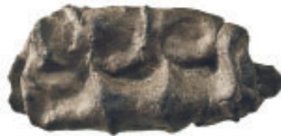
7 Brotlaibförmiges, von einem juvenilen oder frühadulten (ca. 14- bis 25-jährigen) Individuum auf der rechten Seite gekautes Birkenpech (23 mm × 10 mm × 6 mm; 0,9 g).