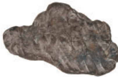
8 Unregelmäßig flaches, mit insgesamt 18 Zahnabdrücken mehrfach von einem Kind gekautes Birkenpech. Zueinander parallel verlaufende Schleifspuren vermitteln den Eindruck eines Geflechtabdrucks (41 mm × 21 mm × 10 mm; 1,9 g).

den Schneidezähnen des Ober- und Unterkiefers gerollt wurde. Als ein Ergebnis dieser Analyse kann festgehalten werden, dass das Kauverhalten der Neolithiker offenbar dem heute zu beobachtenden Verhalten beim Kaugummikauen entspricht. Das Pech wurde nicht mit den Schneidezähnen abgebissen, um ein Stück abzutrennen – wie man es unter Umständen bei einem handwerklichen Prozess erwarten könnte. Es wurde hin- und hergeschoben, mit den Zähnen und der Zunge gerollt, flach gekaut und wieder zusammengedrückt und in den meisten Fällen wurde vor dem Ausspucken noch einmal kräftig zugebissen. Alles Verhaltensweisen, die üblicherweise mit „Kauen um des Kauens Willen“ einhergehen (Abb. 7; 8).