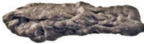
6 Länglich-zylindrisches, durch Drehen mithilfe der Zunge zwischen den Frontzähnen gerolltes Birkenpech (34 mm × 8 mm × 6 mm; 0,6 g).

Die 190 im Rahmen dieser Studie untersuchten Birkenpechfunde von Hornstaad Hörnle IA waren größtenteils gut erhalten und konnten daher in vielerlei Hinsicht beurteilt werden. Neben allgemeinen Merkmalen wie Größe, Gewicht, Färbung und Erhaltungszustand wurden alle sichtbaren Abdrücke möglichst genau erfasst und identifiziert. 110 Stücke weisen mehr oder weniger deutliche Zahnabdrücke auf. Hier wurde besonders auf die Art der Kauspuren geachtet, die anzeigen, auf welche Weise das Material gekaut wurde. Einige Objekte sind vollständig flach gekaut, andere zeigen sehr deutliche Negative eines bestimmten Abschnitts der Zahnreihe. Bei manchen Pechstücken war klar erkennbar, dass das Material zwischen