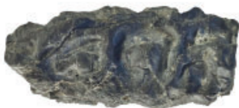
1 Zungenförmiges, von einem frühadulten (ca. 20- bis 30-jährigen) Individuum auf der rechten Seite gekautes Birkenpech (25 mm × 11 mm × 7 mm; 1 g).

Pech und vergleichbare Substanzen wie Harz oder eine Mischung aus beidem finden sich besonders häufig in Seeufer- und Pfahlbausiedlungen sowie in Mooren und Feuchtgebieten. Viele Fundstellen liegen in Mitteleuropa und entlang der skandinavischen Küsten. Außerdem wurden Harz- und