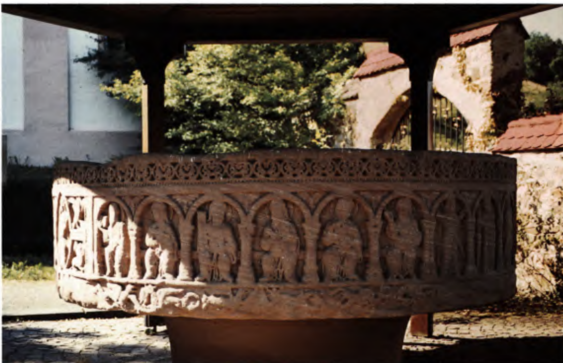
1 Der „Teufelsstein“ im Hof der Kirche von St. Ulrich.