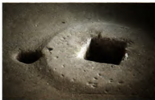
4 Das Innere der Brunnenschale.

Um das quadratische Loch herum erkennt man in der Mitte der Schale eine ebene Fläche von et- wa 85 cm Durchmesser (vgl. Abb. 2, 2). Bei leerer Mühle war diese Fläche die alleinige Berührungs- fläche der beiden Mahlsteine, abgesehen von ein- em schmalen Bereich am Austragsspalt, der sich erst bei Betrieb der Mühle durch das einge- brachte Mahlgut ein wenig öffnete (vgl. Abb. 4). Dieses Mahlgut von etwa Erbsen- bis Haselnuss- größe verursachte natürlich unmittelbar nach