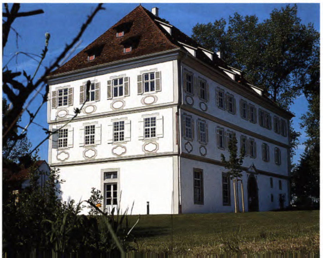
1 Schloss Köngen nach Abschluss der Außen- renovierung, 2000.

Wie wir aus Archivalien und aus den jüngeren, vor Ort gewonnenen Beobachtungen und Berichten wissen, lässt sich die Baugeschichte des Schlosses am heutigen Gebäude bis in die Zeit der mittel-