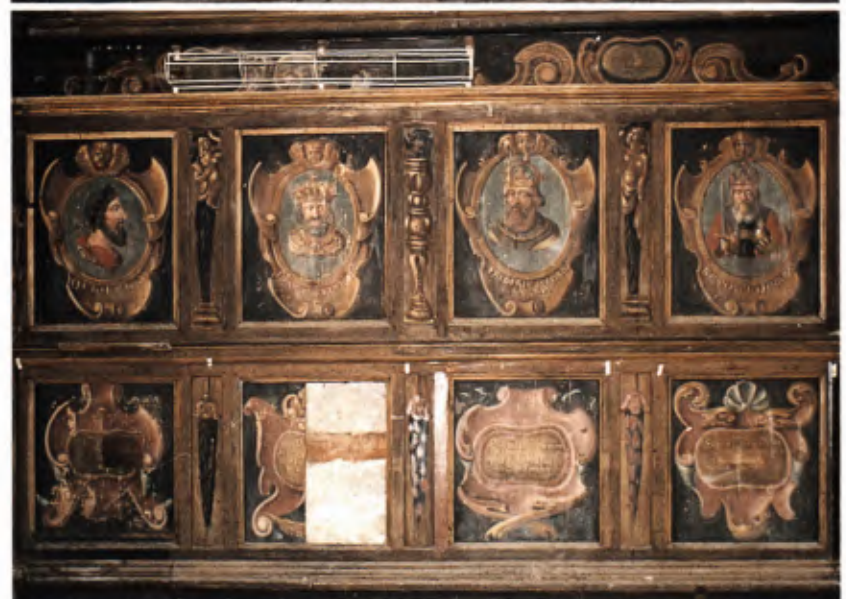
5 Ritteraal im 1. OG mit bemalter Täferwand, Beginn 17. Jh.: Herrscherbildnisse und Sinnsprüche. Zustand 1988.