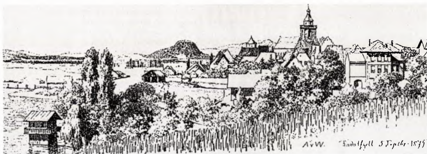
4 Das Badehaus Noppel (Hohner) nach einer Zeichnung von Anton von Werner, 1875.

u. 5). Das vor der Ufermauer im See erstellte Badehaus ist bereits auf einem Stich von Anton von Werner 1875 dargestellt. Der kleine, rechteckige Holzbau unter flach geneigtem Satteldach ist zweigeschossig. Das auf Höhe der Oberkante der Ufermauer gelegene Obergeschoss ist von einer Veranda vom Garten her zugänglich. Stilistisch ist das Gebäude mit seinem weiten Dachvorsprung, der von laubsägeverzierten Sparren und Kopfbändern getragen wird, durch den Schweizerhausstil geprägt. Die Außenwände erhalten durch beschnitzte, dunkel abgesetzte Holzbalken eine Vertikal-Horizontal-Struktur. Dazwischen gesetzt sind die durch Klappläden geschützten Fenster mit ihrer kleinteiligen Sprossierung und Buntglas-scheiben. Innen sind die Umkleidekabinen. Ursprünglich führte eine Innentreppe zum Untergeschoss. Im Untergeschoss befand sich das durch eine Holzverkleidung vor fremden Blicken