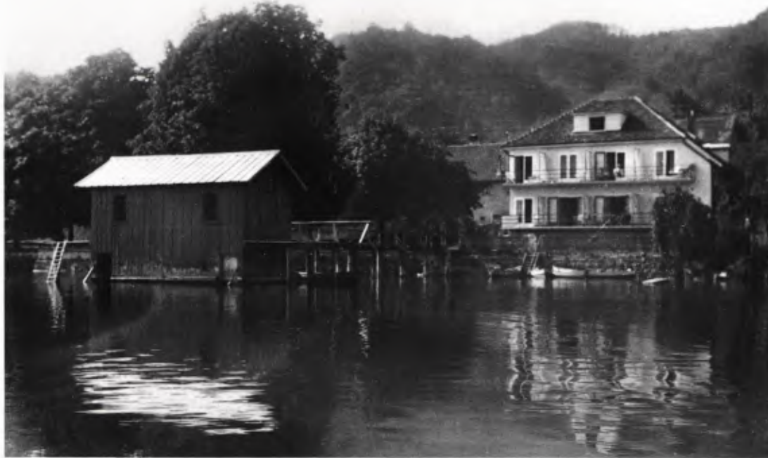
7 Das Badehaus des Hotels Linde in Bodman, Öffnungen ermöglichen es an der Männer- und an der Frauenseite aus dem Badehaus in den See zu schwimmen (im Hintergrund die Dependance des Hotels Linde), Foto 1938.

Die Badehäuschen mit ihren Frauenbädern stellen ein interessantes Stück Kulturgeschichte des 19. und frühen 20. Jahrhunderts dar. Die Hinwendung zu Licht, Luft, Sonne und die Freikörperkultur einer jungen Avantgarde zu Beginn des 20. Jahrhunderts führte allmählich zu einer Verschiebung der Schamgrenze. Binnen einer Generation war es selbstverständlich, dass auch Frauen im See schwammen. Die Badehäuser wurden mit Sonnenterrassen ausgestattet, die Frauenbäder aufgegeben und bei den regelmäßig notwendigen Renovierungen diese Teile der Badehäuschen nicht mehr instandgesetzt. Das Ende der Badehäuser kam vonseiten des Naturschutzes. 1936/38 wurde das Landschaftsschutzgebiet Bodenseeufer zunächst provisorisch ausgewiesen, in den 1950/60er Jahren wurden dann abschnittsweise Naturschutzverordnungen erlassen. Hinfort durften – dies variiert je nach Schutzgrad – im Allgemeinen weder neue Uferabschnitte durch Stützmauern befestigt werden, noch durften neue Badehäuser oder andere Wassereinbauten errichtet werden. In anderen Fällen wird seitens der Wasserrechtsbehörden der Abbruch erwünscht.