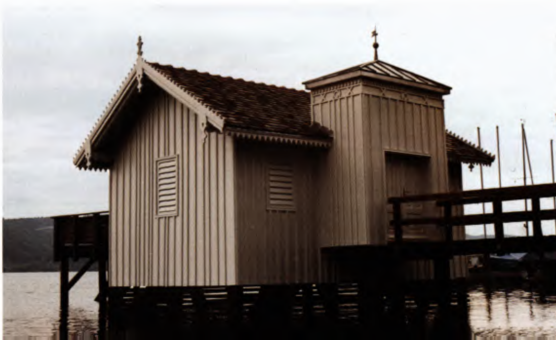
1 Badehaus der Grafen Bodman zu Bodman, Zustand nach der Renovierung von 1990.