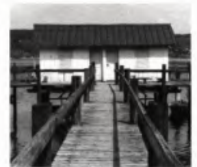
8 Das Badehaus des Hotels Linde, Foto 1997.