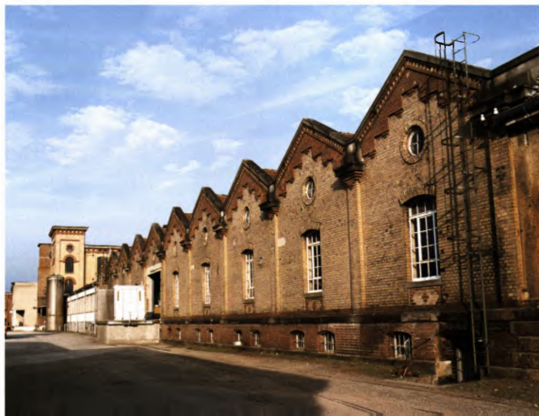
1 Wendlingen, Ansicht der Spinnerei von Nordwesten.

Die Weberei – aus Sicht der Denkmalpflege Herz-