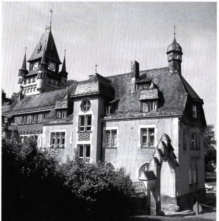
■ 6 Schloß Gondelsheim bei Bretten; 1906–1908 errichteter Anbau mit „Taubentürmchen“ (rechts).

Andererseits waren aber auch Tauben-Fraßschäden an Saaten (trotz zeitweiser Einsperrung der Vögel) und am Erntegut unvermeidlich. Im Hinblick darauf gab es früher fast allerorten behördliche Kontingentierungen