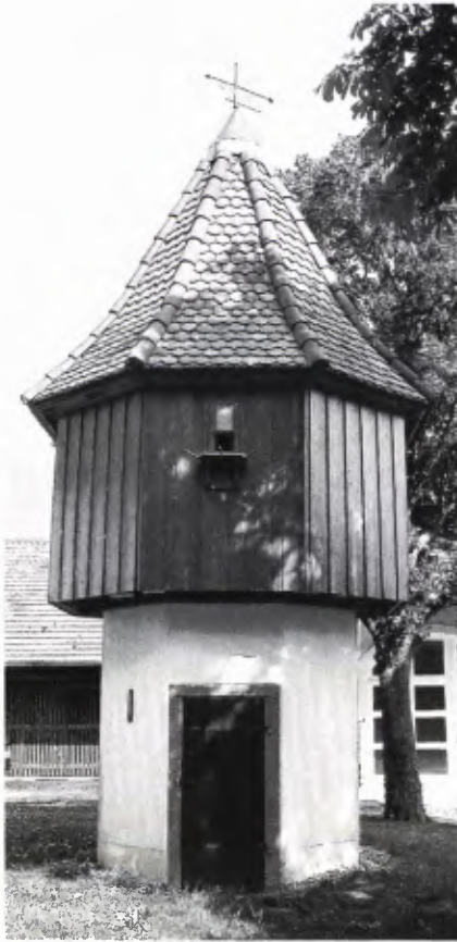
■ 2 Heutiger Zustand des restaurierten Taubenhauses auf dem Weinstetter Hof (Westseite).