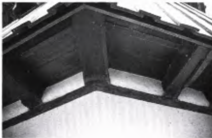
■ 3 Taubenhaus Weinstetter Hof; das hölzerne Obergeschoß überragt das massive Erdgeschoß an allen acht Seiten um rd. 59 cm.