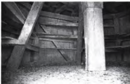
■ 4 Taubenhaus Weinstetter Hof; Innenansicht des Obergeschosses.