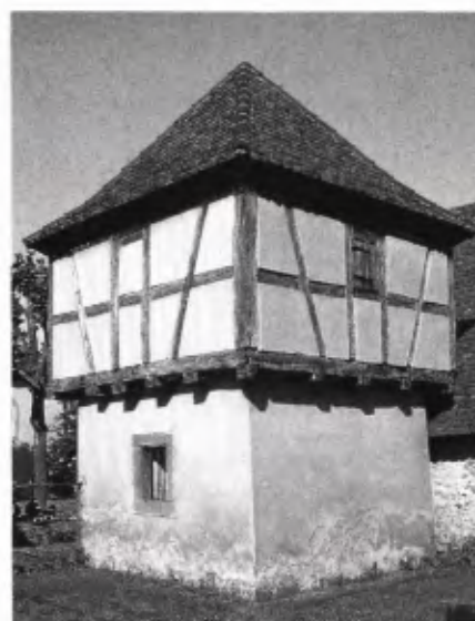
■ 5 Nord- und Westseite (rechts) des Grezhauser Taubenhauses.

Beide Taubenhäuser – in Eschbach-Weinstetten und in Breisach-Grezhausen – zeigen eine heute wohl ansprechende, dennoch recht schlichte Architektur, ausgerichtet auf die damaligen bäuerlichen Nutzungsinteressen. In diesem Zusammenhang sei erwähnt, daß vor allem in der Barockzeit reichere Bauherren ihrem Repräsentationsbedürfnis bei der Gestaltung von Taubenhäusern Ausdruck gaben. In diesem Sinne überregional bekannt ist das 1723 erbaute, 8,80 m