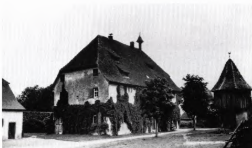
■ 1 „Schlößle“ des Weinstetter Hofes mit Taubenhaus (etwa 70 Jahre alte Aufnahme).

Der berechtigte Verdruß der Denkmalpfleger über die durch Tauben an wertvoller Bausubstanz verursachten Schäden sollte nicht vergessen lassen, daß es in Europa mindestens seit dem Ausgang des Mittelalters dekorative Taubenhäuser gegeben hat. Sie dienten der Taubenhaltung, welche früher wesentlich größere Bedeutung als heute hatte, und sie waren – meistens inmitten der Hofräume plaziert – eine Zierde der ländlichen Siedlungen. Gegenwärtig existieren nur noch sehr wenige solcher Bauten. Zwei im Breisgau erhaltene und von der hiesigen Denkmalpflege betreute Taubenhäuser sind Anlaß für diesen Beitrag.