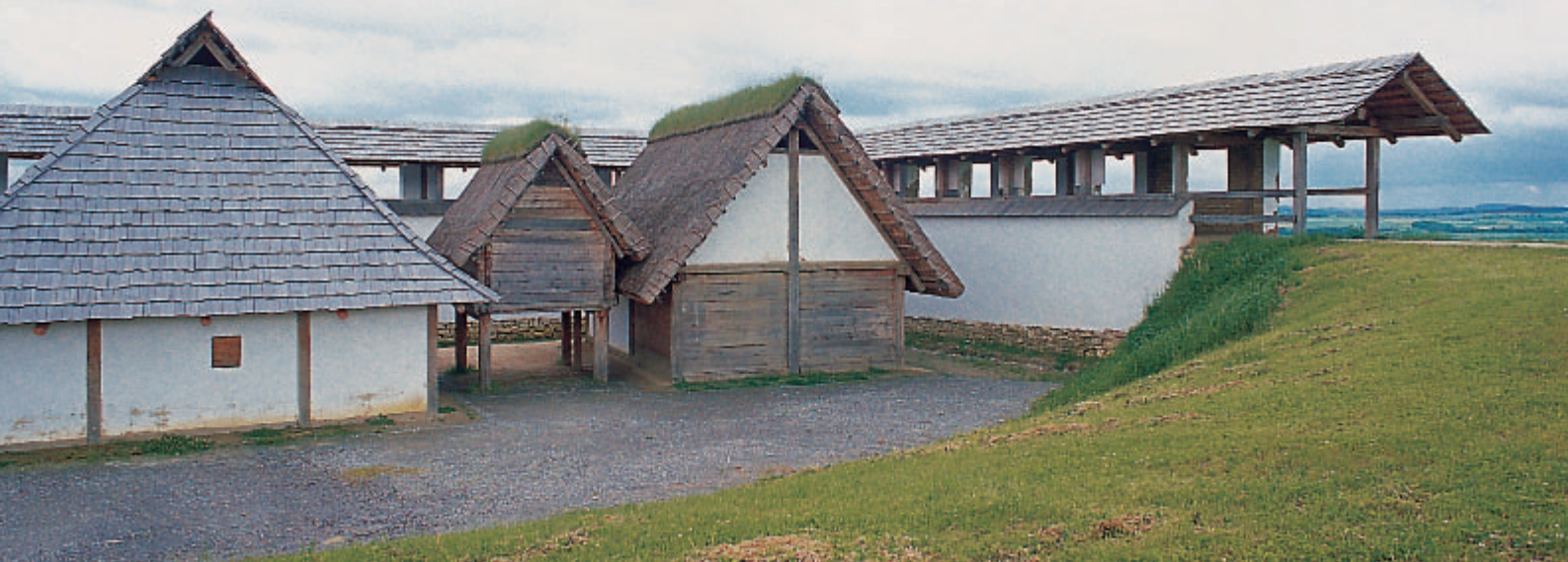
13 Freilichtmuseum Heuneburg. Die drei rekonstruierten Bauten einer Häuserzeile der lehmziegelmauerzeitlichen Heuneburg.

cher vor dem Beginn der Rekonstruktionsarbeiten für das Freilichtmuseum immer wieder in diesem Sinne geäußert. Es soll aber auch nicht in Abrede gestellt werden, dass In-situ-Rekonstruktionen durchaus Probleme in sich bergen können. Was das Freilichtmuseum auf der Heuneburg anbetrifft, ist in diesem Zusammenhang in erster Linie auf die infrastrukturelle Erschließung des Burghügels hinzuweisen, so war zum Beispiel die Errichtung eines Kioskes mit kleinem Museumsshop am Westrand des Burgplateaus beim Zugangsweg zum Freilichtmuseum erforderlich, auch musste der bestehende Parkplatz im Vorfeld der Heuneburg vergrößert werden. Wenngleich die für die Realisierung des Freilichtmuseums Verantwortlichen der Auffassung sind, dass der kleine Flachdachbau und dessen zurückhaltende architektonische Gestaltung denkmalverträglich ist und das Erscheinungsbild der Heuneburg nicht beeinträchtigt, sei nicht verschwiegen, dass es auch kritische Stimmen zu dem Kiosk und zum Freilichtmuseum überhaupt gegeben hat und wohl auch noch gibt.