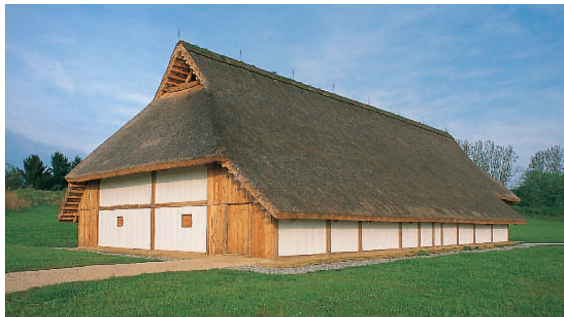
14 Der zu einer Hofstelle gehörende herrschaftliche Großbau als Beispiel für die Neustrukturierung der Bebauung auf der Heuneburg nach der Zerstörung der Lehmziegelmauer.

Das Freilichtmuseum auf der Heuneburg und das Keltenmuseum in Hundersingen stellen ohne Zweifel eine willkommene Bereicherung der vielfältigen Museumslandschaft Oberschwabens dar. Zusammen mit dem Federseemuseum in Bad Buchau und dem dortigen Freilichtmuseum sowie dem Römermuseum in Mengen-Ennetach ermöglichen sie eine lehrreiche und lebendige Zeitreise in die frühe Geschichte unseres Landes.