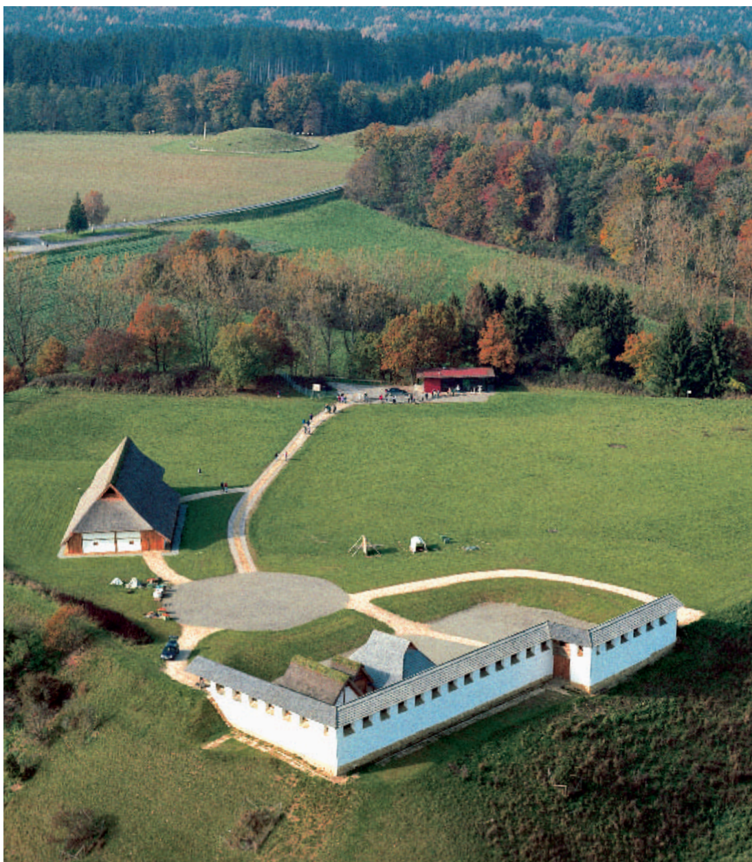
15 Das Freilichtmuseum Heuneburg von Südosten aus gesehen. Die schmalen Zugangswege und die Freiflächen für museumspädagogische Aktionen werden im Laufe der Zeit ein schotterrasenartiges Aussehen erhalten, sodass der Bereich des Freilichtmuseums auch optisch in die Fläche der Heuneburg eingebunden wird und nicht als Fremdkörper erscheint. In der Bildmitte, am Eingang zum Freilichtmuseum, liegt der Kiosk. Im Bildhintergrund erhebt sich Hügel 1 des nach der Zerstörung der Außensiedlung angelegten Grabhügelfriedhofes.

Heuneburgmuseum Ortsstraße 2 88518 Hunderringen Telefon / Fax: 07586 / 9173 03 flm.heuneburg@t-online.de www.heuneburg.de