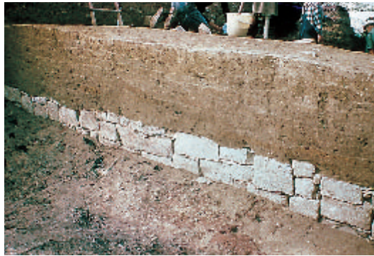
2 Die Lehmziegelmauer an der Südfront der Heuneburg mit Kalksteinsockel und Ziegelaufbau. Im Vordergrund verbrannte Holzteile des Wehgangs.

Wenige Jahre zuvor waren die archäologischen Denkmäler im Umfeld der Heuneburg in einen mit Erläuterungstafeln versehenen, etwa 8 km langen Rundwanderweg einbezogen worden (Abb. 5). Dieser beginnt beim Heuneburgmuseum in Hundersingen und führt über den 1897 angegrabenen frühkeltischen Großgrabhügel „Lehenbühl“ zur mittelalterlichen Turmhügelburg „Baumburg“, die, so ist zu vermuten, über einem Großgrabhügel errichtet wurde, und von dort zur Heuneburg. Im nordwestlichen Vorfeld der Burg können die vier Großgrabhügel jener