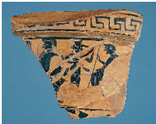
3 Auf dem Bildfries eines Volutenkraters (Mischgefäß) sind zum Kampf ausziehende Krieger dargestellt. Die auf der Heuneburg gefundene schwarzfigurige Scherbe gehört zu einem etwa 57 cm hohen Gefäß, das 520/510 v. Chr. in Griechenland gefertigt wurde.

Nekropole aufgesucht werden, die in der 2. Hälfte des 6. Jahrhunderts v. Chr. auf dem Ruinenfeld der zerstörten Außensiedlung errichtet worden sind. Drei der Hügel, die zwischen 1954 und 1989 vollständig ausgegraben wurden, sind wieder zur alten Höhe aufgeschüttet und 1993 in ein kleines Freilichtmuseum einbezogen worden (Abb. 6). Sie weisen Durchmesser von etwa 50 m auf und sind ungefähr 7 m hoch. Bei den Hügeln werden in den kommenden Jahren Nachbildungen frühkeltischer Grabstelen aufgestellt finden. Vom Grabhügelriedhof führt der Wanderweg durch Waldgelände in westliche Richtung und nach der Durchquerung des „Soppenbachtals“ wird der „Hohmichele“ erreicht, der mit einem Durchmesser von etwa 85 m und einer Höhe von nahezu 13 m zu den größten keltischen Grabmonumenten Mitteleuropas zählt. 1937/38 wurden Grabungen im Zentrum und in der Osthälfte des Hügels durchgeführt. Das Zentralgrab, eine 5,7 m lange und 3,5 m breite Holzbohlenkammer, war nur kurze Zeit nach der Beisetzung eines Mannes und einer Frau nahezu vollständig ausgeplündert worden. Einige im Raubschacht zurückgelassene Gegenstände aus Metall erlauben die Datierung des Grabes in das ausgehende 7. Jahrhundert und es ist nicht unwahrscheinlich, dass im Zentrum des Hügels einer der Gründer der Heuneburg seine letzte Ruhe gefunden hat. Wenige Meter vom „Hohmichele“ entfernt liegt eine Viereckschanze aus spätkeltischer Zeit. Von dort führt der Wanderweg nach Hundersingen zurück.