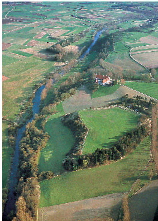
1 Blick von Norden auf die Heuneburg. Das etwa 300 m lange und 150 m breite Plateau erhebt sich 60 m über die Donauniederung. In der oberen Bildhälfte liegt die Staatsdomäne Talhof.

Im Vorfeld der frühkeltischen Heuneburg erstreckte sich eine zeitgleiche offene Ansiedlung, die als Außensiedlung bezeichnet wird, und, wie die archäologischen Ausgrabungen der Tübinger Denkmalpflege in den Jahren 1954–63, 1978–82, 1988–89 und 2000 erwiesen haben, mit mindestens 10 Hektar den Burghügel an Fläche weit übertraf. Zusammen mit der lehmziegelmauerumwehrten Heuneburg fand die Außensiedlung