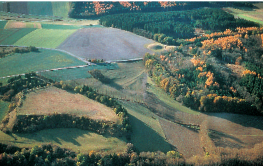
4 Die Luftaufnahme zeigt die Heuneburg von Osten. In der rechten Bildhälfte sind die wieder aufgeschütteten Hügel 1 und 2 des Bestattungsplatzes im „Gießbübel/Talhau“ zu erkennen. 1876 haben dort erste Grabungen stattgefunden.