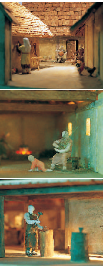
9 Die von einem Stuttgarter Künstler gestaltete Schaufensterwand im Obergeschoss des Museums bietet in fünf Szenen Einblicke in das Leben der Heuneburg-Bewohner und soll den Betrachter auf den Besuch des Freilichtmuseums einstimmen. 1 Alltag auf der Heuneburg; 2 Frauen beim Hauswerk; 3 In der Schmiedewerkstatt.