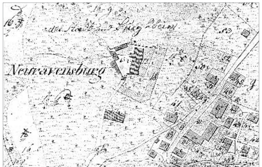
5 Schlossberg und Schloss Neuravensburg. Ausschnitt aus der Urnummernkarte der württembergischen Landesvermessung Blatt SO 8647 von 1828.

Das Gelände der „Altstadt“ dürfte bis zum Ausgang des Mittelalters teils als Wirtschaftsfläche zum Burggut gezogen, teils aber auch an bauer-