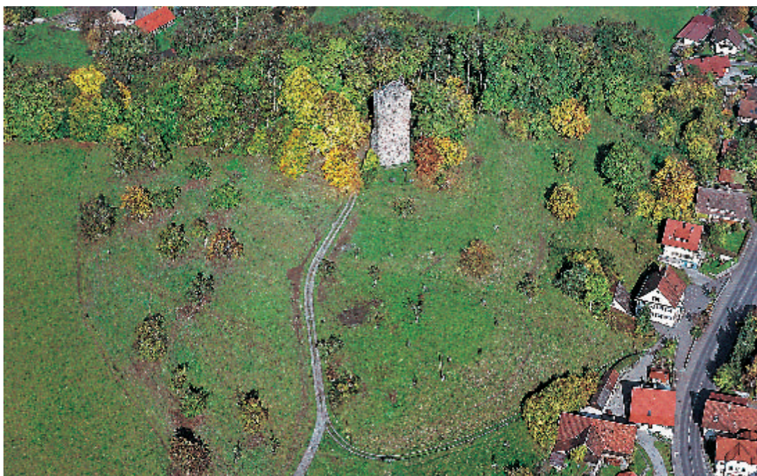
1 Neuravensburg. Oberer Teil des Schlossberges mit Bergfried von Südwesten.