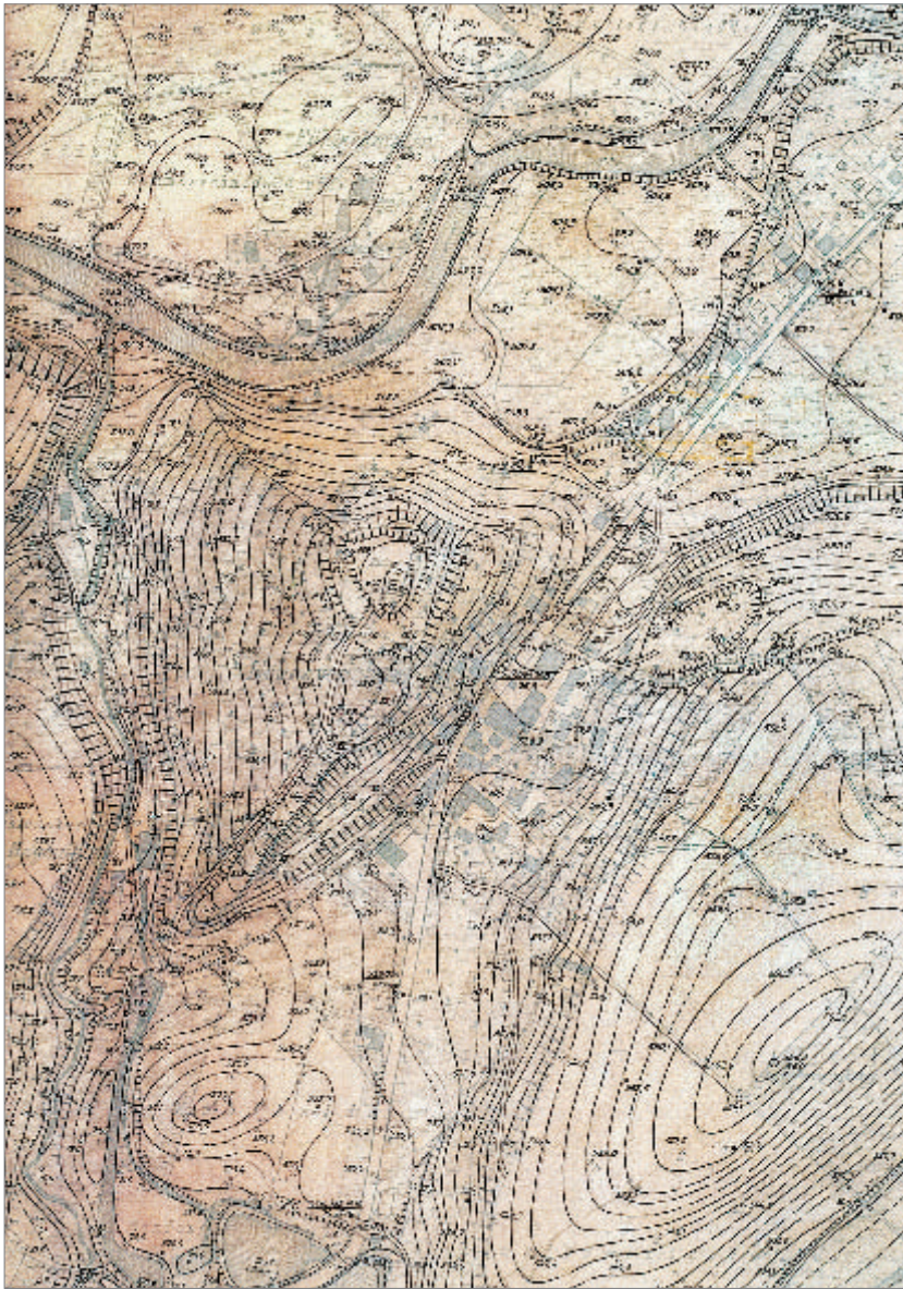
2 Schlossberg. Ausschnitt aus der Höhenflurkarte Blatt SO 8647, Geländeaufnahme von 1952.

renzierte Morphologie in zahllosen kleinen, oft bewaldeten Kuppen, vielen abflusslosen Wannen mit Seen, Mooren und Feuchtwiesen sowie einer Vielzahl von häufig tobeltartigen Bachtälern ihren unverkennbaren Ausdruck findet. Der alte Ortskern Neuravensburgs entwickelt sich an der Straße nach Lindau, die hier von Wangen her aus der Flussaue der Oberen Argen zu einem tiefen und schmalen Sattel zwischen zwei würmeiszeitlichen Moränenhügeln aufsteigt. Auf der Spitze der nordwestlichen dieser beiden Erhebungen, an deren Hangfuß die straßenzeilige Bebauung im südlichen Ortsteil unmittelbar anstößt, steht, weithin sichtbar, der Bergfried der „Neuravensburg“. Der 28 m hohe Turm, der vor wenigen Jahren durch einen erheblichen Instandsetzungsaufwand aufrecht erhalten werden konnte, repräsentiert den letzten obertägigen Bauzeugen der mittelalterlichen Ansiedlung. Der isolierte Hügel (564,2 ü. NN) fällt im Norden und Nordosten mit einem stellenweise kaum begeharen Hang etwa 55 m tief zu der Oberen Ar-