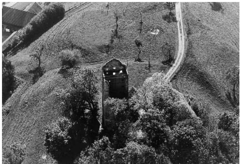
3 Burghügel mit Bergfried und Resten der Hanggräben am West- und Südhang des Schlossberges.

Für eine in der älteren Literatur postulierte Nutzung des Burgberges während der römischen Zeit gibt es keine sicher dokumentierten archäologische Zeugnisse. Den Ausgangspunkt der mittelalterlichen Ansiedlung Neuravensburg markierte die Burg auf dem Bergkegel. Ihre Entstehungszeit ist aus den verfügbaren Quellen nicht genau zu bestimmen, dürfte aber in die 1. Hälfte des 13. Jahrhunderts datieren. Die Burg „Neuravensburg“ geht offenbar auf eine Gründung von Reichsministerialen zurück, die ehemals auf der Veitsburg oberhalb der Stadt Ravensburg ansässig waren. Das Geschlecht mit den Leitnamen Dioto und Heinrich, dessen älteste bekannte Vertreter mit der Stammburg in Ei(ch)stegen (abge-