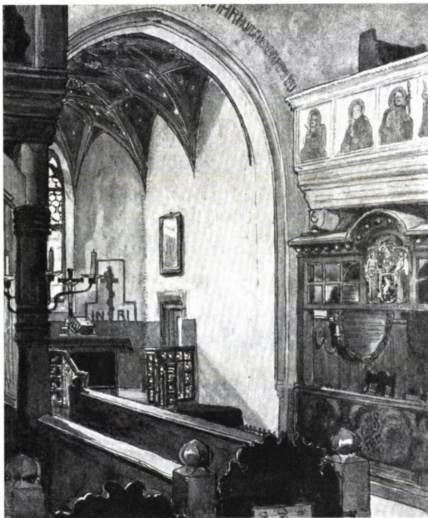
■ 1 Renovierung der Kirche zu Unterriexingen. Entwurf zur inneren Veränderung. Architekt: Bruno Taut. (Aus: Bauzeitung für Württemberg 1907, S. 381).

Bei der letzten größeren Instandsetzung der ev. Pfarrkirche in Unterriexingen 1986 wurde zwar eine restauratorische Untersuchung durchgeführt, aber der Wert und die Rangstellung der noch bestehenden Ausstattung und der gefundenen Farbigkeit aus der Zeit der Jahrhundertwende konnte aufgrund fehlender Forschungen nicht angemessen eingeschätzt werden. Deshalb wurde eine Farbfassung beschlossen, die historisierend auf eine Farbigkeit vor 1906 zurückgreift, nachdem die Kirche in den vergangenen 80 Jahren mehrmals „neutral“ überfaßt worden war.