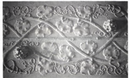
■ 7 Universität Jena. Kleines Vestibül. Stuckdecke mit Traubenmotiv. Entwurf Bruno Taut, 1906. Zeitgleich zu Unterriexingen von Bruno Taut entworfen. Er arbeitete im Architekturbüro von Theodor Fischer als entwerfender Architekt an mehreren Bauvorhaben.