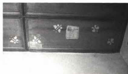
■ 5 Decke vor den Instandsetzungsarbeiten 1986. Faltermotive in Schablonenmalerei von Bruno Taut.