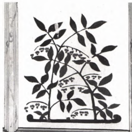
■ 4 Bruno Taut. Blütenpflanze an der Brüstung der kleinen Empore.