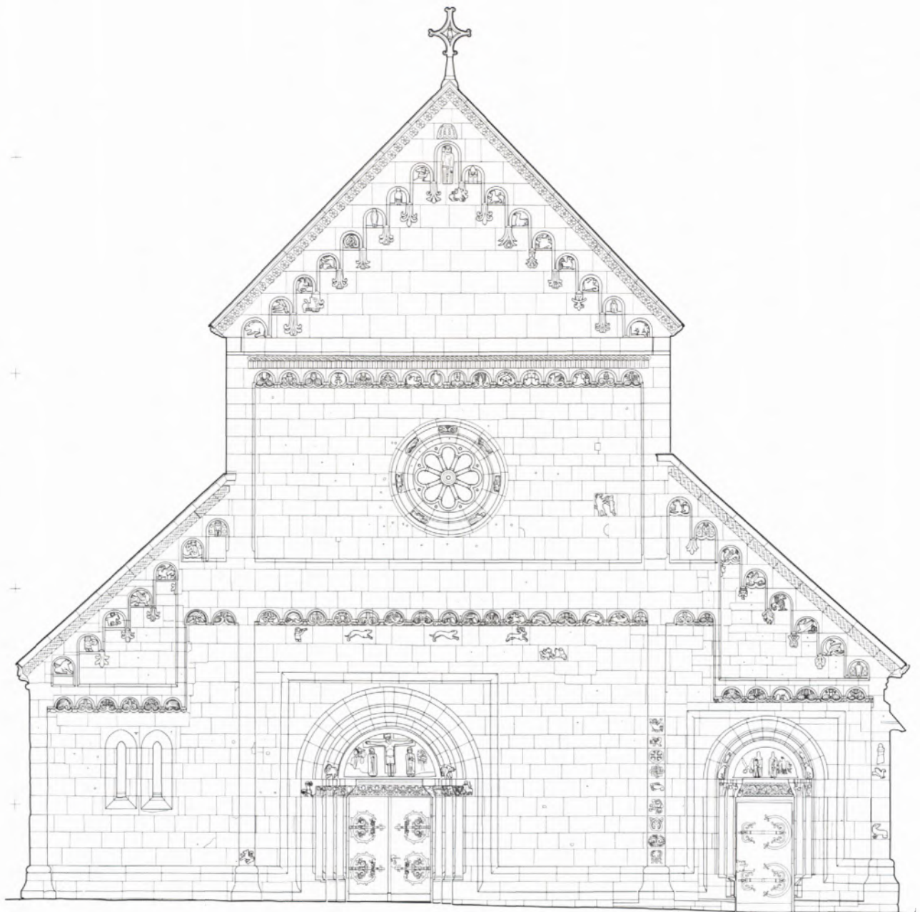
1 JOHANNISKIRCHE, Westfassade. Photogrammetrische Auswertung im Maßstab 1 : 50, verkleinert auf den Abbildungsmaßstab für den Inventarband 1 : 200. Die photogrammetrische Aufnahme wurde vom Landesdenkmalamt durchgeführt, die graphische Umsetzung erfolgte durch das Ingenieurbüro Fischer, Müllheim. Bei der Auswertung wurde besonderer Wert auf die Architekturgliederung und auf die Ornamente und figürliche Details gelegt. Bau- und Steinschäden wurden nur bei gravierenden Erscheinungen dargestellt. Die photogrammetrischen Aufnahmen erlauben jedoch, z. B. im Vorfeld von künftigen Instandsetzungsarbeiten, eine nachträgliche detaillierte Schadensinterpretation.