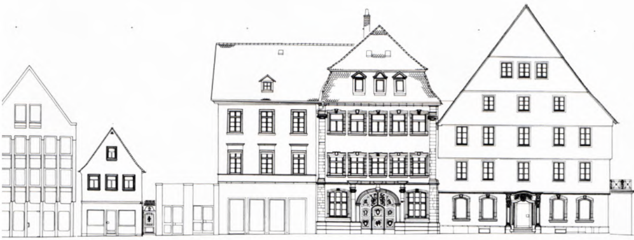
▲ 4 BOCKSGASSE, Fassadenabwicklung Nordseite, Haus-Nr. 18–38. Photogrammetrische Auswertung im Maßstab 1 : 50, verkleinert auf den Maßstab 1 : 333⅓. Die Fassadenabwicklung des Straßenzuges zeigt Zusammenhänge und Proportionen auf, und es wird deutlich, wo das ursprüngliche Erscheinungsbild bewahrt wurde und wo störende Eingriffe stattgefunden haben. Weitgehend unverändert sind die Gebäude 20, 32 und 34. Bei den Gebäuden 18 und 38 sind die ursprünglichen Türblätter nicht mehr vorhanden oder in Funktion, bei 22, 26 und 30 wurden die gesamten Erdgeschosßzonen umgebaut. Die beiden Gebäude 28 und 36 fallen als Neubauten von 1976 bzw. 1963 auf.