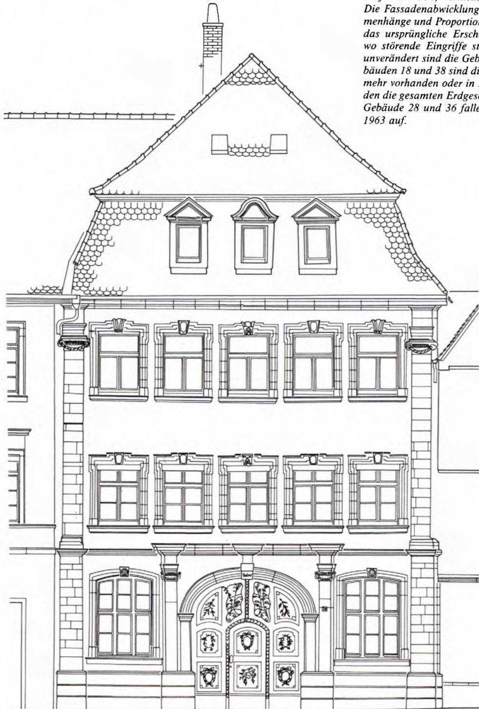
◀ 3 BOCKSGASSE 20. Photogrammetrische Auswertung im Maßstab 1 : 50, verkleinert auf den Maßstab 1 : 100. Bei der graphischen Auswertung wurden exakt maßstäblich die Fassadengliederung gezeichnet und die für den Baustil typischen Merkmale hervorgehoben. Wegen der vorgesehenen Verkleinerung auf den Maßstab 1 : 200 im Inventarband konnten nicht alle erforderlichen Linien dargestellt werden. Die photogrammetrischen Aufnahmen erlauben aber jederzeit weitere detailliertere Umzeichnungen, ggf. im größeren Maßstab. Bei der Auswertung der Stereoaufnahmen wird eine strenge Orthogonalprojektion erzeugt, eine Photographie ist dagegen eine Zentralprojektion, die zwar in der Fassadenebene in bestimmten Toleranzen maßstäblich vergrößert oder entzerrt werden kann, bei stärkeren Vor- oder Rücksprüngen aber perspektivische Verzerrungen aufweist. Sehr deutlich kommt dies im Dachbereich zum Ausdruck, wo die photogrammetrische Auswertung die wahre Höhe zeigt, die photographische Aufnahme aber stark verkürzt abbildet.