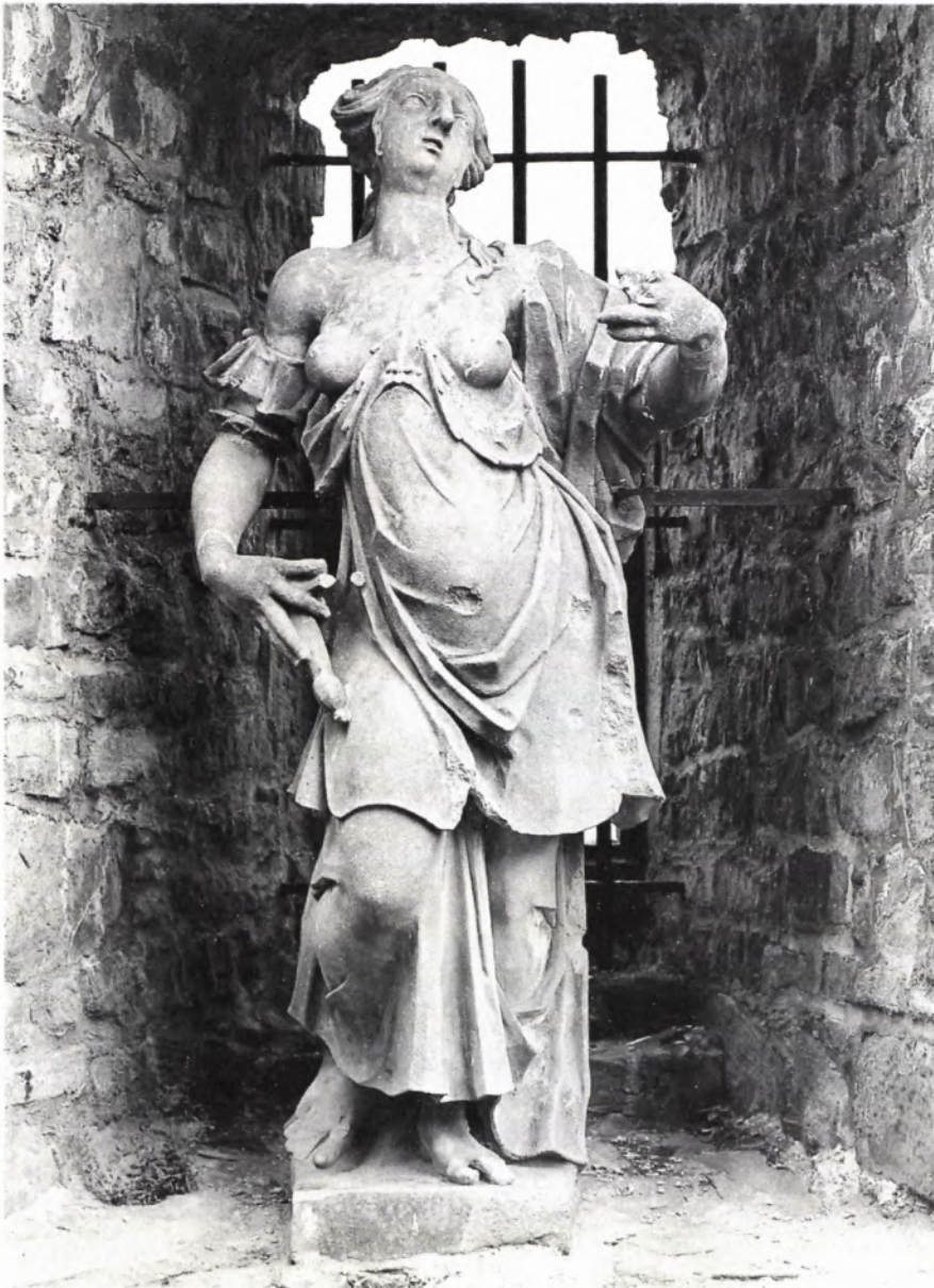
■ 5 Justitiafigur, Sebastian Götz, 1604/05. Heidelberg, Schloß, Friedrichsbau Hofseite, heute im Lapidarium.