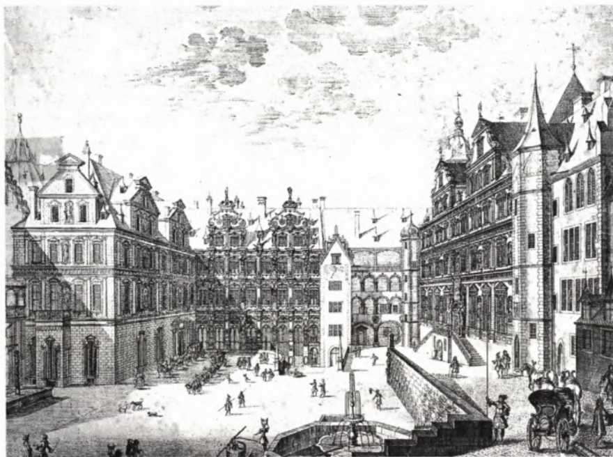
■ 4 Heidelberg. Schloßinnenhof mit Friedrichsbau, Ott-Heinrichsbau (rechts, mit Treppenaufgang) und Frauenzimmerbau (links). Radierung des Augsburger Kupferstechers J. U. Kraus. 1683. Die Justitiafigur thront zwischen den Zwerchgiebeln des Friedrichsbaus. Im Erdgeschoß des Frauenzimmerbaus haben Sebastian Götz und seine acht Gesellen den Figureschmuck des Friedrichsbaus gefertigt.