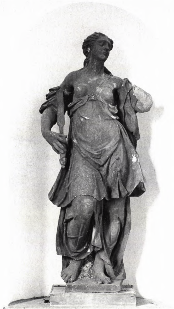
■ 1 Justitiafigur, Sebastian Götz, 1604/05. Mannheim, Schloß, östlicher Ehrenhofflügel (ursprüngl. Heidelberg, Schloß, Friedrichs- bau).

Es ist der 31. Januar 1994. Beim östlichen Ehrenhofflügel des Mannheimer Schlosses soll zusammen mit den Kollegen der Staatsbauverwaltung eine steinerne Frauengestalt begutachtet werden. Die Skulptur ist von außerordentlicher Qualität und es besteht der Wunsch, dem linken Arm die amputierte Hand neu zu formen.