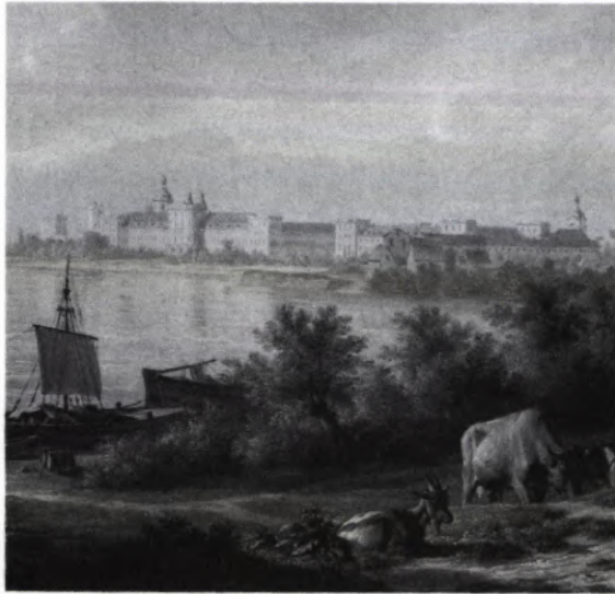
Die Kunstdenkmäler in Baden-Württemberg

wertenden Darstellung geschichtlicher Überlieferung (abgedruckt in: Erfassen und Dokumentieren im Denkmalschutz, Schriftenreihe des deutschen Nationalkomitees für Denkmalschutz, Band 16, Stuttgart 1982, Sei-