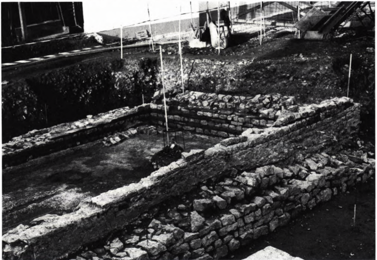
3 BAU I mit Kaltwasserbecken auf den Fundamenten eines älteren Gebäudes. Gut erkennbar Estrichauskleidung des Innenraumes und Ausgleichschichten des Mauerwerkes mit flachen Ziegelplatten.