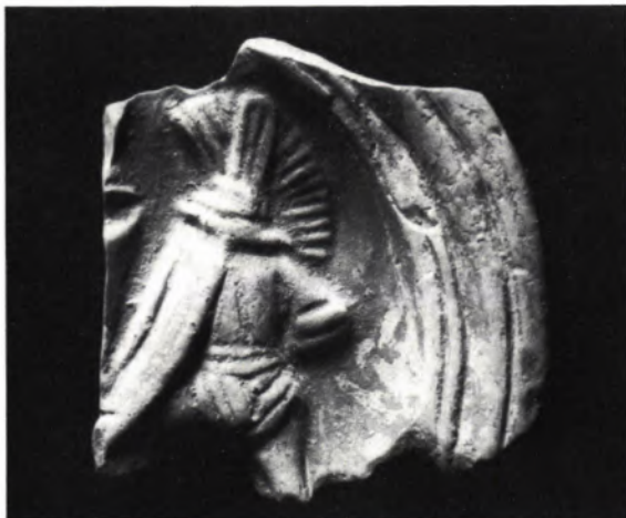
8 BRUCHSTÜCK einer Tonlampe mit Darstellung eines Gladiatorenkampfes: Erkennbar ein Fechter mit Helm und Schild. Maßstab ca. 2 : 1.