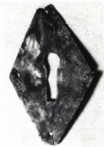
7 FIBELN (Gewand- schließen) aus Bronze. Maßstab ca. 1 : 1.