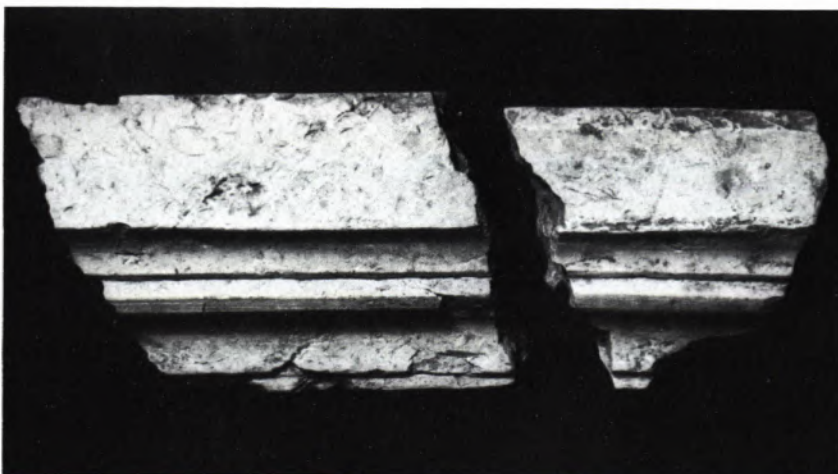
5 PROFILIERTES Tür- oder Fenstersims aus weißem Marmor.

Leider war das um einen rechteckigen Innenhof angelegte mehrflügelige Wohngebäude (II) durch verschiedene neuere Störungen beeinträchtigt. Ein Kellerraum beispielsweise (Abb. 4) wurde nach den hier gefundenen Scherben im 15. und 16. Jahrhundert wiederbenutzt, wahrscheinlich als Weinkeller wie schon in römischer Zeit. Folge dieser Störung ist eine gewisse Armut an Funden, wenn auch, wie bei den früheren Grabungen, erneut Säulenfragmente, Marmorprofile (Abb. 5), Reste von Wandmalereien und diesmal auch von Mosaikböden entdeckt worden sind. Entschieden geht hier Qualität vor Quantität! So vermitteln Bruchstücke bemalter Stuckleisten mit eingepreßten Muschelornamenten eine Ahnung vom Reichtum und der Kostbarkeit antiker Raumausstattung, von einem Interieur, das mit der architektonisch reichen Gestaltung des Äußeren korrespondiert. Auch unter den übrigen Funden überwiegt das Besondere. Selten nur sind Details wie das Schloßblech aus Bronze überliefert (Abb. 6), das wohl zu einer Außentür gehört hat. Den Bewohnern und Benutzern der Villa begegnen wir in Bronzefibeln, Gewandschließen der Alltagstracht (Abb. 7), in Resten von Tonlampen (Abb. 8), die zur Erhellung von Räu-