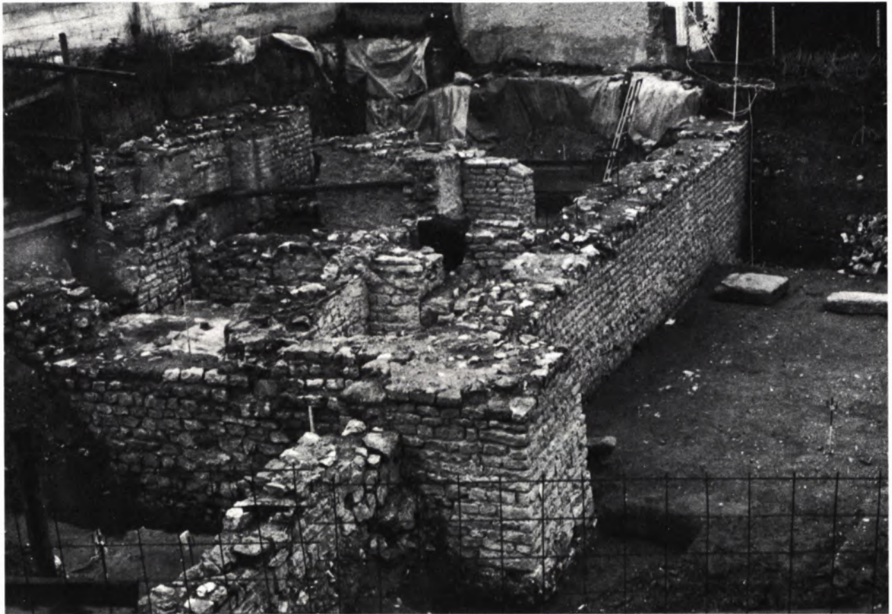
2 GRENZACH, Eckbereich des großen Hauptgebäudes II nach seiner Freilegung.