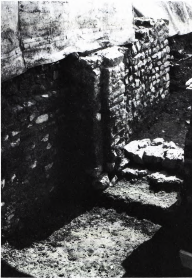
4 KELLEREINGANG in Gebäude II. Die grobklotzigen Stufen stammen von der mittelalterlichen Wiederbenutzung.

Gutshöfen umgeben, von denen die örtlichen Märkte vor allem mit Lebensmitteln, aber auch mit handwerklichen Erzeugnissen beliefert wurden.