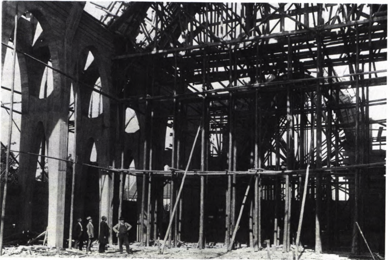
6 DIE BAIENFURTER MARIENKIRCHE IM BAU. Die damals neue Technik des Stahlbetonbaues ermöglichte die für den Expressionismus typischen Bogen- und Wölbungsformen.

tischen Überhöhung des menschlichen Lebens dar, wie sie auch für die Gegenwart mit aller Kraft von ihnen angestrebt wurden.