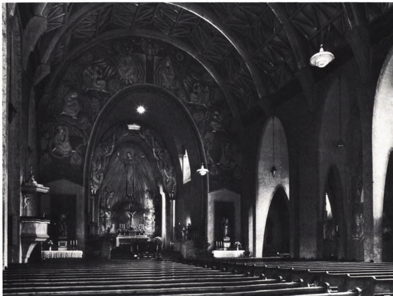
3 DER INNENRAUM. Blick in Gemeinderaum, Sanktuarium und Chor. Rechts ein Seitengang, der von Nische zu Nische führt. Die Lampen in der Mitte wurden inzwischen durch neue ersetzt, die in der Form denen in den Nischen entsprechen.

Läßt sich die Beschränkung auf wenige ungewöhnliche und expressive Formen als gestalterisches Prinzip der Architektur erkennen, so gilt sinngemäß das gleiche für die äußerst intensive, ja im ersten Augenblick fast rücksichtslos wirkende Farbigekeit des Innenraums. Grundton ist ein dunkles