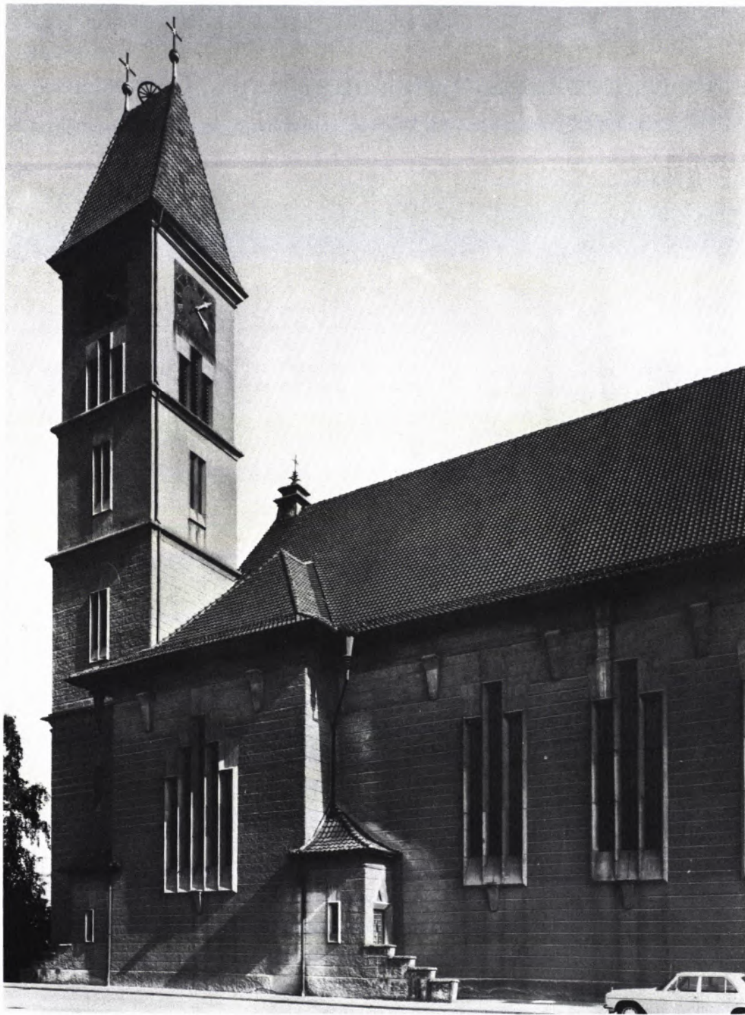
2 DIE MARIENKIRCHE IN BAIENFURT, aufgenommen vor der Instandsetzung. Der verschmutzte Außenputz erhielt inzwischen einen Anstrich im Naturton. Die Kunststeinteile wurden neu gefaßt.

Die Katholische Kirchengemeinde Baienfurt hat sich erst 1917 als selbständige Pfarrei von dem nur drei Kilometer entfernten Altdorf (Weingarten) gelöst. Ursache war das starke Anwachsen der Bevölkerung seit der Gründung der Baienfurter Papierfabrik 1871. Die junge Gemeinde mußte sich zunächst mit einer 1891 errichteten Kapelle begnügen, ehe 1925 mit dem Bau der neuen Pfarrkirche begonnen wurde. Am 6. Juli 1927 fand die Weihe der Kirche statt.