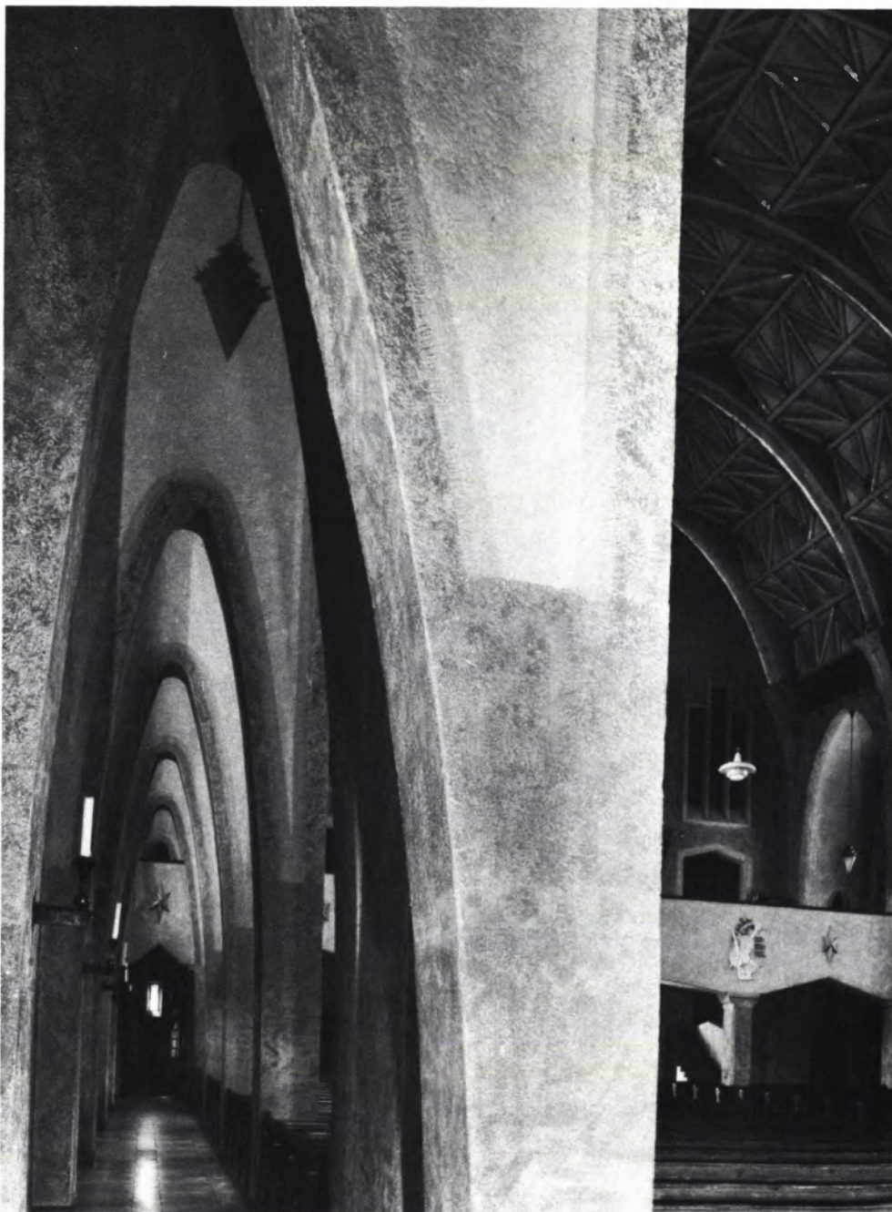
4 EIN SEITENGANG mit hohen, engen Parabelbögen. Links schließt die Außenwand der Kirche mit den Fenstern an. Nach rechts führen große, elliptische Bögen in den Gemeinderaum.

Bauformen und Farbwahl weisen die Baienfurter Kirche als typisches Werk des Expressionismus aus. Die neuen Bogen- und Wölbungsformen waren nur möglich aufgrund einer