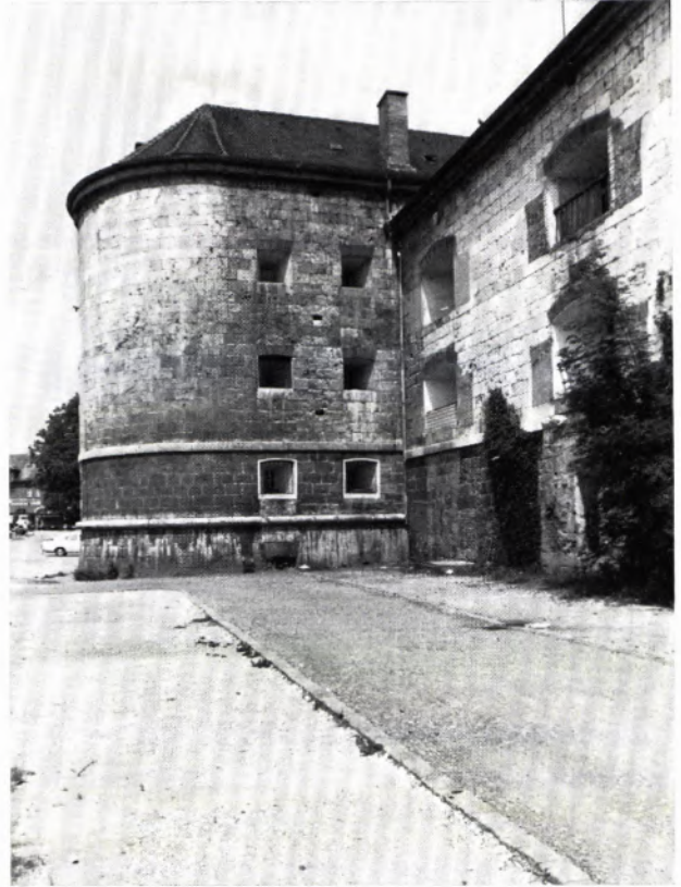
1 und 2 DIE DEFENSIVKASERNE DER OBEREN DONAUBASTION. Auf der Kehlseite gegen die Stadt springt ein runder Flankenturm vor. Die Kasernenfront mit ihren Wohnfenstern ist in den beiden unteren Geschossen aus Juraquadern, in den beiden oberen aus Backstein erbaut. Auf der Verteidigungsseite, einst gegen den Wall gerichtet, steht ein Bestreichungsturm für ein Geschütz vor der Frontmitte. Diese Seite der Kaserne ist in Quaderbauweise errichtet und besaß einst zwei Geschützcharten pro Kasematte.

chen gegeneinander. Die streng und knapp, aber sehr gut proportionierten architektonischen Details gehören dem romantischen Klassizismus an.