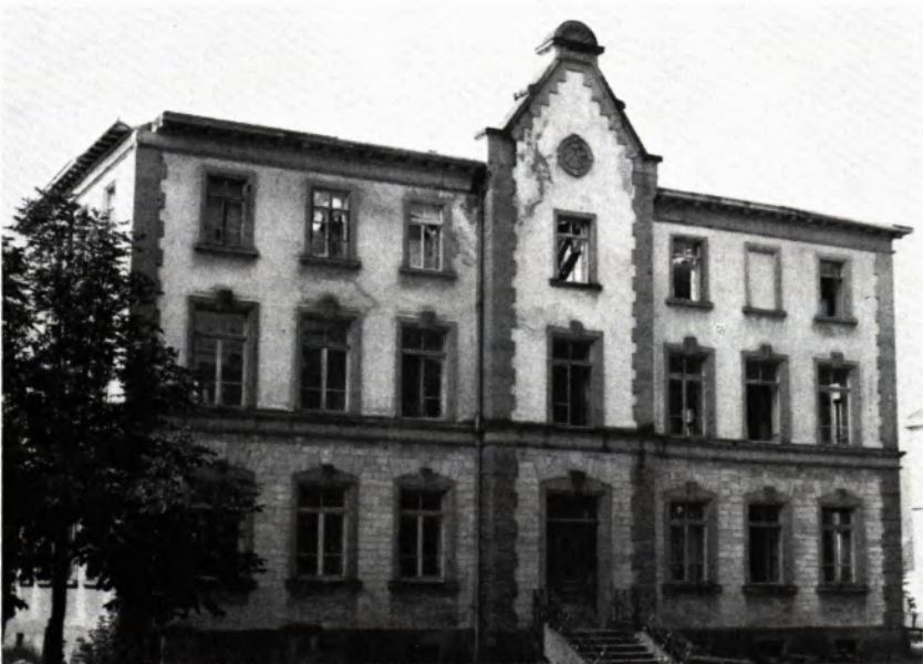
Geisingen (Kreis Tuttlingen): Altes Schulhaus

1733 erbaut, einzelnes Gehöft im Untertal, ein typisches Schwarzwaldhaus mit Schindeldach. Im Frühjahr 1975 abgebrannt. Trotz mangelnder Bauunterhaltung wäre bei einer sinnvollen Nutzungsänderung der stattliche Bauernhof zu retten gewesen.