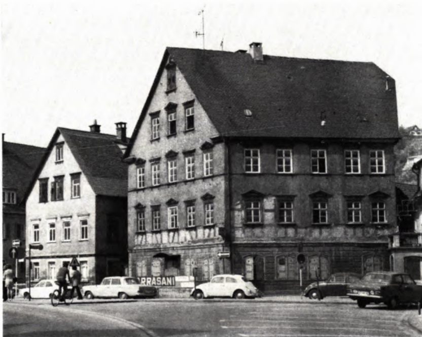
Schwäbisch Gmünd (Ostalbkreis): Hintere Schmiedgasse 45

Stattliches Eckhaus, im Kern frühes 16. Jahrhundert, Erdgeschoß-Umbau im späten 18. Jahrhundert, Obergeschoße um 1850. Das Gebäude wurde Mitte 1974 anlässlich einer Routine-Anfrage der Stadt als hochqualifiziertes Kulturdenkmal eingestuft. Mit seinen auffälligen Fluchtlinien vertritt es an markanter Stelle die auf die Zeit vor dem Dreißigjährigen Krieg zurückgehende historische Situation einer wesentlich breiteren, von der Rems durchflossenen Straße der bedeutenden Gmünder Schmiedezunft.