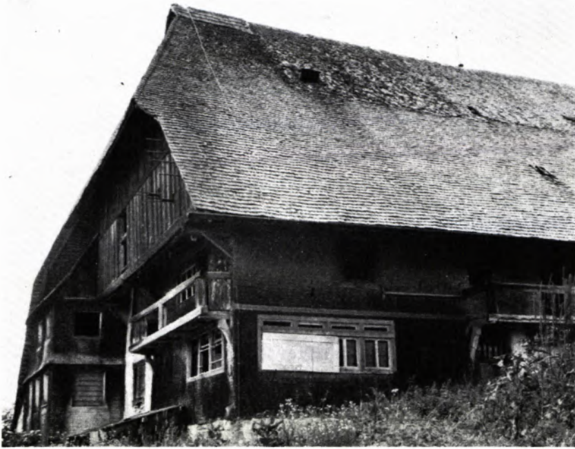
Unterkirnach (Schwarzwald-Baar-Kreis): Wurstbauernhof

Der Hof stand jahrelang leer, letzter Eigentümer war die Gemeinde. Mehrere Verkaufsverhandlungen mit Privatinteressenten waren gescheitert. Im Herbst 1974 brannte der Hof vollständig ab. Die Brandursache blieb ungeklärt.