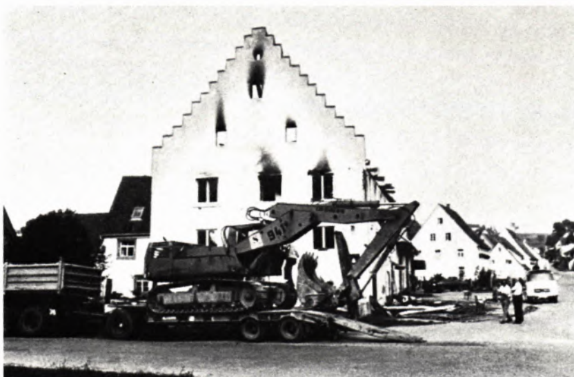
Donaueschingen-Aasen: Gasthaus „Zum Ochsen“

Am 9. 6. 1974 brannte das (vom Landesdenkmalamt zur Erhaltung empfohlene) kleinere Nachbargebäude Nr. 43, am 22. 6. 1974 das (mittlerweile unter Dokumentations-Auflagen zum Abbruch freigegebene) Gebäude Nr. 45 selbst. Ein Planungskonzept für das betreffende Sanierungsgebiet liegt noch nicht vor.