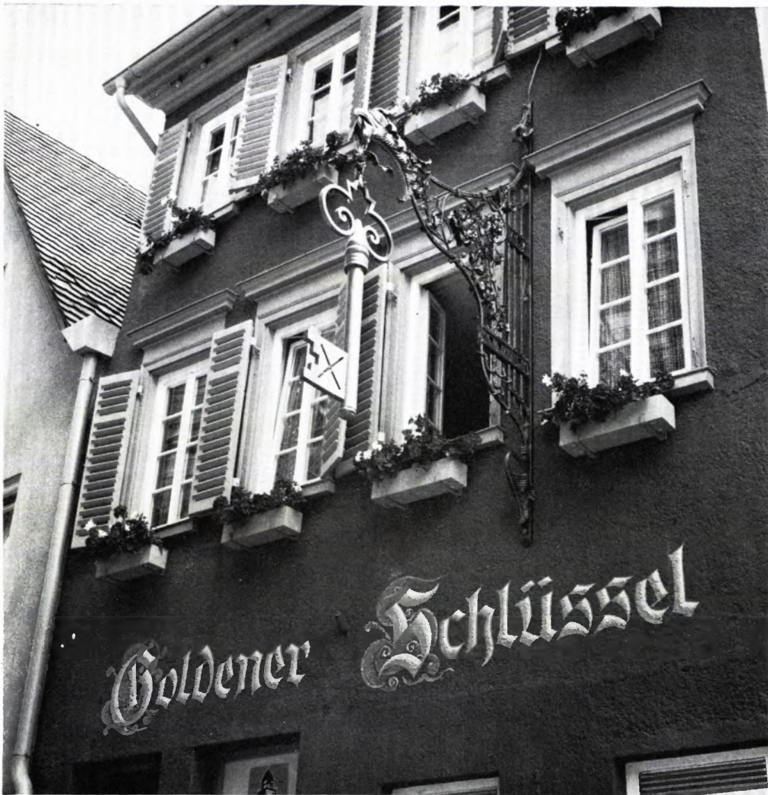
GASTHAUS „ZUM GOLDENEN SCHLÜSSEL“. Der alte handgeschmiedete Ausleger und die ockerfarben gehaltene Schrift geben ein Beispiel dafür, welche Art von Werbeanlage sich schadlos und doch zweckentsprechend in einen alten Straßenraum einfügen läßt.

gelehnt worden waren, einigte man sich auf einen gemalten Schriftzug über dem Erdgeschoß. Als Schriftart wählte man wiederum die Fraktur. Die einzelnen Buchstaben sind ockerfarben. Auf den ersten Blick meint man, daß die zusätzlich mit Blau und Rot ausgefüllten reichverzierten Initialen von mittelalterlichen Vorbildern übernommen sind. Beim näheren Betrachten erkennt man jedoch deutlich den am Jugendstil orientierten Duktus heutiger Ornamentik.