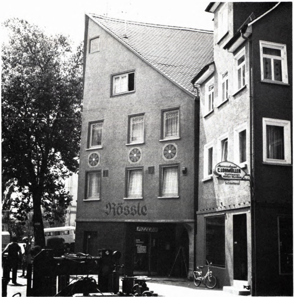
DIE GASTSTÄTTE „RÖSSLE“. Schrift und Rosettendekor üben eine dezent-eindringliche Werbe- und Anzeigenwirkung aus.

Zwei in diesem Jahr unter Beratung des Landesdenkmalamtes entstandene Werbeanlagen, die sich nach unserer Auffassung harmonisch in das Altstadtbild von Rottenburg einfügen, befinden sich am Haus Königstraße 68 und Marktplatz 13. Gemeinsam ist beiden, daß man auf jegliche direkte oder indirekte Beleuchtung verzichtete und stattdessen eine gemalte Schrift wählte. Da ein Verzicht auf Leuchtwerbung im Interesse des Altstadtbildes und in Respekt vor benachbarten Kulturdenkmalen nicht selbstverständlich ist, sollen beide Anlagen hier als nachahmenswerte Beispiele kurz vorgestellt werden.