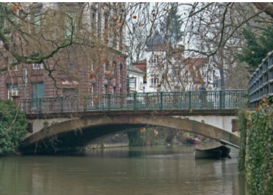
1 Die Brücke über den Hammerkanal in Esslingen.

zungen für die industrielle Entwicklung. Der sehr frühe Anschluss an das Eisenbahnnetz im Jahre 1845 sowie zahlreiche Fabrikgründungen, darunter insbesondere die weit über die Grenzen Württembergs hinaus bekannte Maschinenfabrik Esslingen, prägten die Stadt in den Zeiten der Industrialisierung. Neue Flächen, sogar ganze Stadtteile mussten erschlossen werden, um Platz für die neuen Betriebe sowie Wohnraum für deren Arbeitskräfte zu schaffen.