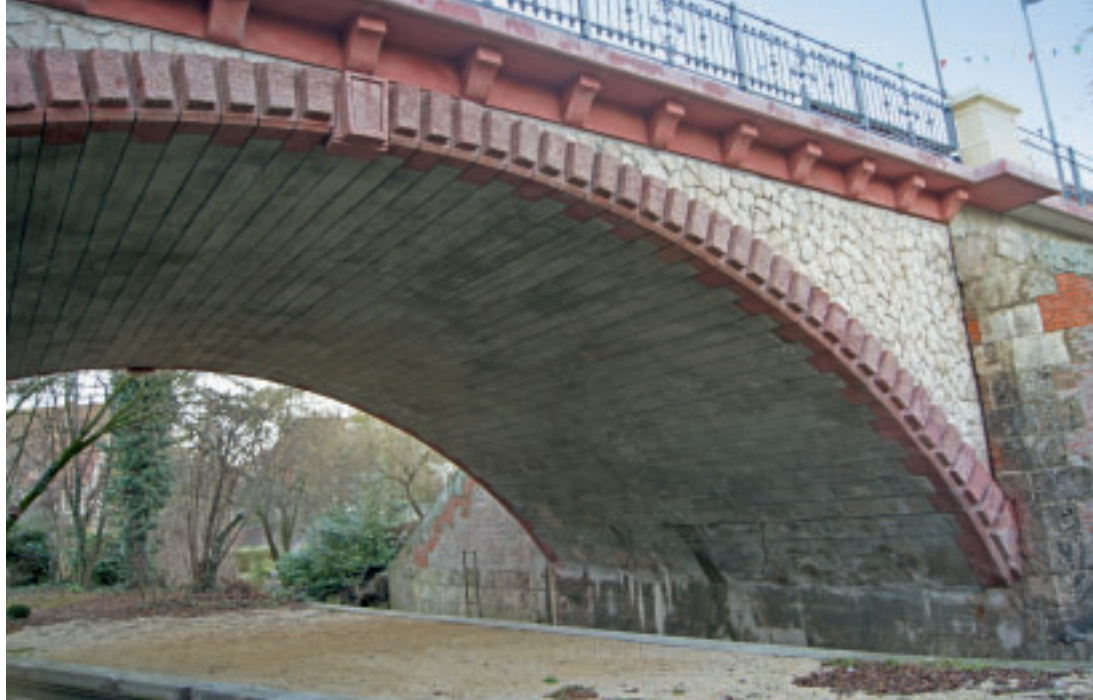
2 Ansicht der Schmiechbrücke in Ehingen mit Quaderimitation sowie Verkleidung der Gewölbezwickel.

weil die Erfahrungen mit dieser Bauweise noch nicht ausreichend schienen. Die Wahl fiel schließlich auf eine Massivbrücke, wobei auf Naturstein verzichtet, dagegen einer Betonbrücke der Vorzug gegeben wurde. Neben den technischen Vorteilen sprachen erwartete Kostenersparnisse in der Ausführung, insbesondere aber im Unterhalt der Brücke für den Beton.