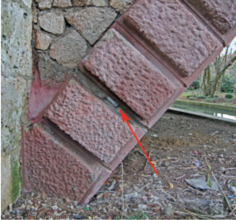
3 Bleiplattengelenk der Schmiechbrücke mit nachträglichem Verguss.