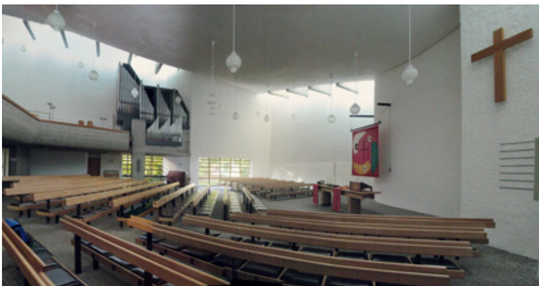
10 Sonnenberg (Stadt Stuttgart), Evangelisches Gemeindezentrum, Baugruppe 1964 bis 1966 nach Plänen Ernst Gisels errichtet. Der Kirchenraum ist durch die Auflösung der liturgischen Zonen charakterisiert.

Landesamt für Denkmalpflege im Regierungspräsidium Stuttgart Dienstszitz Tübingen