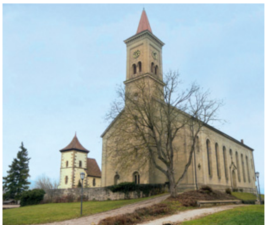
7 Rosengarten-Westheim (Kreis Schwäbisch Hall), Martinskirche, 1848 nach Entwürfen des Haller Kreisbauinspektors Wilhelm Immanuel Pflüger errichtet.

fessionelle Identitäten führten. Im Zuge der badischen Kirchenunion vereinigte man die seit dem 17. Jahrhundert in doppelter – lutherischer wie reformierter – Tradition bestehende evangelische Kirche. Sowohl in Baden als auch in Württemberg hatten diese Veränderungen Auswirkungen auf die Wahrnehmung des Kirchenneubaus als Möglichkeit konfessioneller Positionierungen. Nun verurteilte man die Architektur des Kirchenbaus des 18. Jahrhunderts im Rückblick als zu profan. In Württemberg traf diese Kritik vor allem die abfällig als Kameralamtskirchen bezeichneten spätklassizistischen Bauten, die zu sehr an zeitgleiche Verwaltungsarchitektur (Kameralämter) erinnerten (Abb. 7). Die Kritiker der Bauten forderten erneut eine Sakralarchitektur, also Gebäude mit sakralem Charakter. In Rückgriff auf mittelalterliche Traditionen sollte das sakrale Moment durch Absetzung des Altarraumes vom Gemeinderaum vollzogen werden. Der Altar wurde erneut als Ort sakramentalen Charakters gesteigert und nahm folglich eine hervorgehobene Position im Kirchenraum ein, wengleich die Kanzel ihre Bedeutung für den evangelischen Gottesdienst nicht einbüßte.