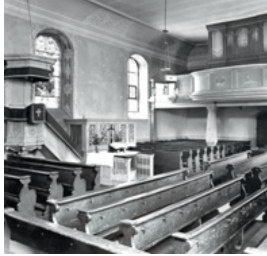
5 Tuningen (Schwarzwald-Baar-Kreis), Michaelskirche, 1728 bis 1731 nach Plänen des Landbaumeisters Maier aus Stuttgart errichtet. Die Innenansicht zeigt Kanzel und Altar mit Altargitter und Kreuzaufsatz.