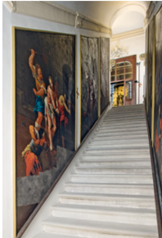
11 Die Hl. Stiege mit flankierenden Bildern der Passion Christi führt zur Kapelle zum Leiden Christi, die auch Sanktuarium genannt wird.

Den Abschluss der Hl. Stiege bildet die Kapelle zum Leiden Christi (Abb. 12), die auch als Sanktuarium bezeichnet wird. Hier hatte die Markgräfin die erworbenen Reliquienschatze untergebracht. Auf dem Vorplatz der Kapelle steht die Nachbildung der Geißelsäule, die in einem mit Gitter verschlossenen Fach ein Reliquienfragment des Originals beinhaltet. Die Kapelle selbst war auf das Reichste ausgestattet. Die Decke ist mit dunklem Samt bezogen und mit silbernen Sternen besetzt und zeigt im Zentrum das Auge Gottes als Symbol der Dreieinigkeit. Die Wände waren mit farbigem Reliefsamt verkleidet, von dem sich nur Reste erhalten haben (Abb. 13). Auf dem Altar steht in der verspiegelten Nische eine Terrakottafigur des Gegei-