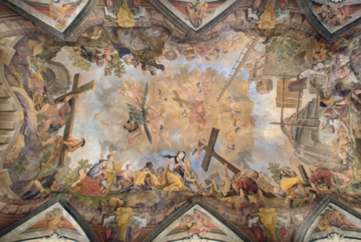
6 Das von Johann Hiebel geschaffene Deckengemälde zeigt in der Glo-riole Christus mit dem Kreuz als Siegeszeichen, die Auffindung des wahren Kreuzes, die Vereh-rung und die Kreuztra-gung sowie die Verkün-dung des Erlösungswerks.