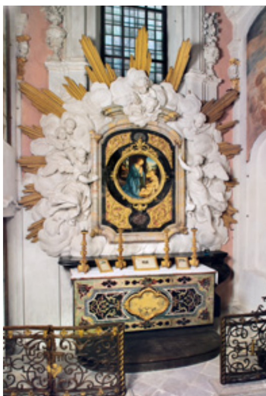
4 Der Seitenaltar zur unbefleckten Empfängnis auf der Altar Bühne mit einer Kopie des Bildes des Florentiner Malers Lorenzo Credi.

suiten wurde dieser Altar 1752 dem Gründer der Piaristen gewidmet, die neben der Schule auch die Betreuung der Schlosskirche übernommen hatten. Das Bild des hl. Joseph von Calasanz, geschaffen von Joseph Melling, zeigt den spanischen Priester und Gründer des Piaristenordens. Die Seitenaltäre auf der Altar Bühne sind links der hl. Anna und rechts der unbefleckten Empfängnis gewidmet. Das Altarbild des Letzteren stammte von Lorenzo Credi und datiert um das Jahr 1480.