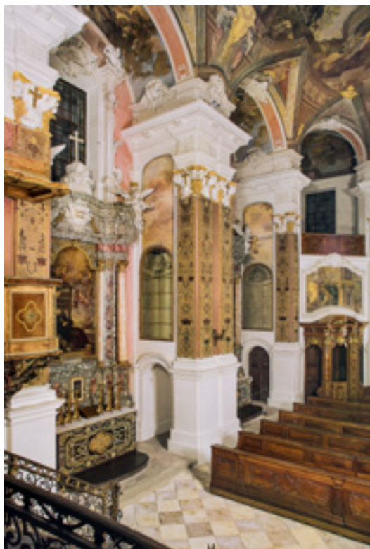
2 Blick von der Orgelepore der Schlosskirche auf den Kirchenraum mit der großzügigen Altaranlage.