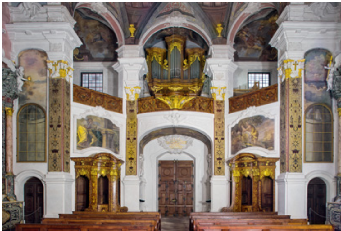
10 Der Blick auf die Emporeseite mit dem Portal zeigt neben der Orgel und den Beichtstühlen das Zusammenwirken der Ausstattungsmaterialien.

Dachform, bei der die Dachflächen zur Hälfte nach innen geneigt sind, um die Firsthöhe zu reduzieren, und mit Entwässerung der innenliegenden Flächen durch den Dachraum.