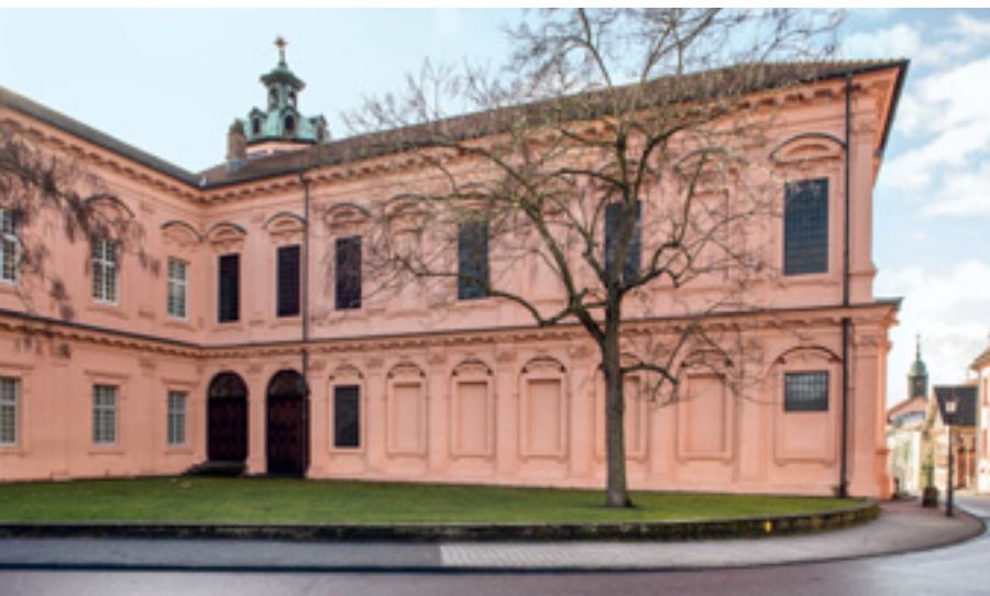
1 Ansicht der Schlosskirche von Nordosten aus mit dem ehemaligen externen Zugang zur Hl. Stiege.

Mutter Gottes eingerichtet hat. Inspiriert durch ihre Romreise folgte 1719 die Errichtung der Hl. Stiege mit der Kapelle des Leidens Christi im Obergeschoss in unmittelbarer Nähe der Privatgemächer. In den Jahren 1720 bis 1723 wurde dann direkt an den Sibyllenflügel anschließend die Kirche zum Hl. Kreuz erbaut, mit der sie ein dem Papst gegebenes Versprechen zur Errichtung einer Pfarrkirche für Rastatt zu erfüllen gedachte (Abb. 1).