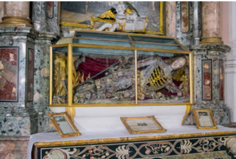
9 Bei den „Heiligen Leibern“ handelt es sich wie hier im Schausarkophag des hl. Theodor auf dem Josephsaltar um Reste der ursprünglich reichen Reliquienausstattung.

Von Sibylla Augustas Reliquienschatzen (Abb. 9) hat sich nur wenig erhalten. So befinden sich die beiden gläsernen Schausarkophage der hl. Theodora und des hl. Theodor auf den hinteren Seitenaltären. Die in Rom aus den Katakomben erhobenen „Heiligen Leiber“ wurden sorgsam gefasst und drapiert ausgestellt. Die Gesichter sind mit gemalten Masken ergänzt, wobei die Ähnlichkeit mit dem Herrscherpaar sicher nicht zufällig war.