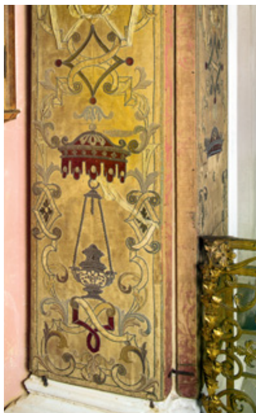
7 Auch die Kanzel weist die hochwertige Textilaus-stattung des Kirchen-raums auf.