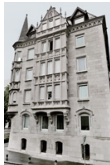
10 Wohnhaus mit Kunststeinfassade in der Olgastraße in Ulm von 1899.