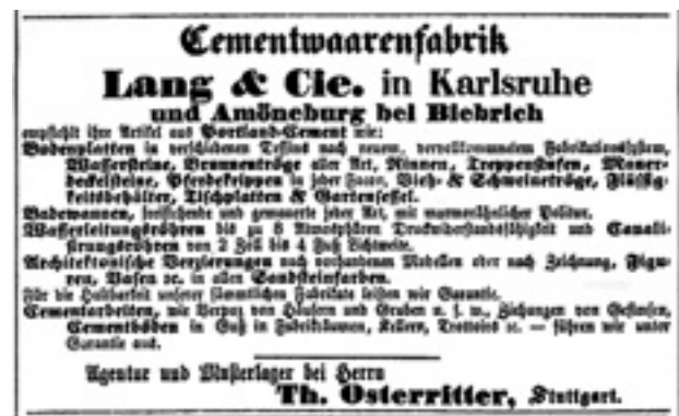
3 Anzeige aus dem Schwäbischen Merkur von 1868.

Eugen Dyckerhoff erkannte als geeignetes Herstellungsverfahren, den erdfeuchten Beton durch Stampfen zu verdichten anstatt ihn zu gießen. Die so bereits Ende der 1860er Jahre bei Lang & Cie. hergestellten Zementwaren besaßen aufgrund ihres niedrigen Wasserzementwertes neben einer höheren Festigkeit vor allem eine hohe Widerstandsfähigkeit gegenüber Umwelteinflüssen. Ursprünglich geht das Stampfbetonverfahren auf den französischen Bauunternehmer François Coignet zurück, der 1855 dafür ein Patent mit dem Namen „béton aggloméré“ erhielt. Eugen Dyckerhoff sah in diesem Verfahren die Zukunft des Baustoffs Beton. Sein Bruder Rudolf unterstützte ihn bei Untersuchungen zur Anwendung des Betons, indem er umfangreiche Versuchsreihen im Labor seiner Portland-Cement-Fabrik Dyckerhoff & Söhne im hessischen Amöneburg für Eugen