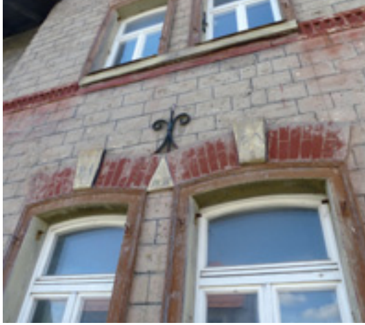
2 Berliner Litfaßsäule aus Zementstein zwischen 1855 und 1860.