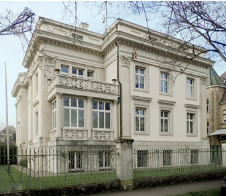
11 Villa Brenzinger in der Goethestraße in Freiburg von 1907.