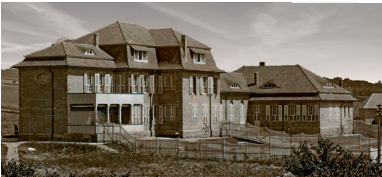
5 Krankengebäude für unruhige Männer MU1, Aufnahme kurz nach der Fertigstellung von Wilhelm Kratt 1910.

Bei der Einrichtung erfuhren Sicherheitsaspekte eine besondere Aufmerksamkeit. Türen wurden je nach Raumnutzung in unterschiedlichen Stärken ausgeführt. Das Schlüsselsystem konzipierte man