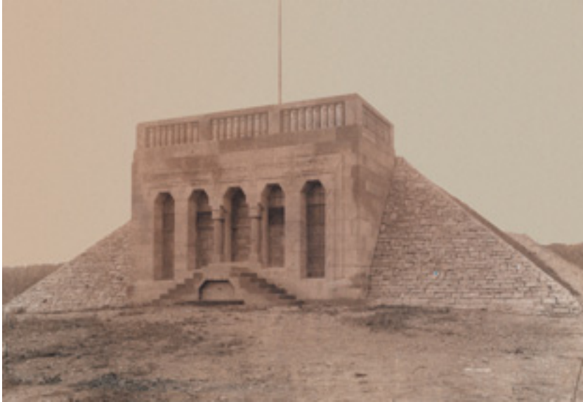
10 Wasserhochbehälter, Aufnahme vor 1906. Wie eine ägyptische Grabstätte wirkt der extravagante Technikbau.

räume abbilden und jeweils einer eigenen Gestaltung gehorchen. Die Einzelformen wie der hufeisenartig aufgeweitete Bogen des Nordeingangs, die unregelmäßig hochreichende Bossenverkleidung des Sockels und die Fachwerkaufbauten des Obergeschosses sind im Jugendstil gerne verwendete Details und in dieser schlüssigen Kombination in den Anstaltsbauten nicht zu finden. Anders als beim Wasserhochbehälter existiert ein Plansatz im Tafelwerk des Badischen Bezirksbauamtes, was für eine Urheberschaft von Julius Koch oder seinem Umkreis spräche.