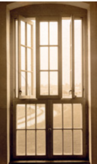
6 Das „Wieslocher Normalfenster“ mit fixierten Flügeln unterhalb und drehbaren Flügeln oberhalb des Kämpfers. Aufnahme vor 1910.

nach Vorbild der Münchner „Irrenklinik“ mit hierarchisierten Generalschlüsseln für das Wachpersonal und die Ärzte. Die eigens entwickelten Fenster wurden gar unter dem Begriff „Wieslocher Normalfenster“ als Patent angemeldet (Abb. 6). Zugeschritten auf die unterschiedlichen Raumgrößen und -formen bestehen an die zehn Typen. Gemeinsam ist ihnen ein spezifischer Aufbau, der eine Sicherung gegen Sturz oder Ausstieg mit guten Lüftungsmöglichkeiten vereint. Die unteren Flügel stehen fest und sind ohne Spezialwerkzeuge nicht zu öffnen; oberhalb des niedrig gesetzten Kämpfers erlauben zwei schmale, hohe Drehflügel das selbständige Öffnen der Fenster durch die Patienten, wobei die Öffnung für die Luftzirkulation ausreicht, nicht aber für einen Ausstieg geeignet ist. Die enge Sprossierung entsprach dem Zeitgeschmack, der dem Fenster als Teil der Fassadengliederung großen Wert beimaß. Die Treppenhäuser wurden in den Häusern der Unruhigen durch wandhohe Holzstabkonstruktionen und etagenweise Absperrungen gesichert. Als Geschirr kam hier kein Porzellan, sondern Holzstoffgeschirr zur Anwendung.