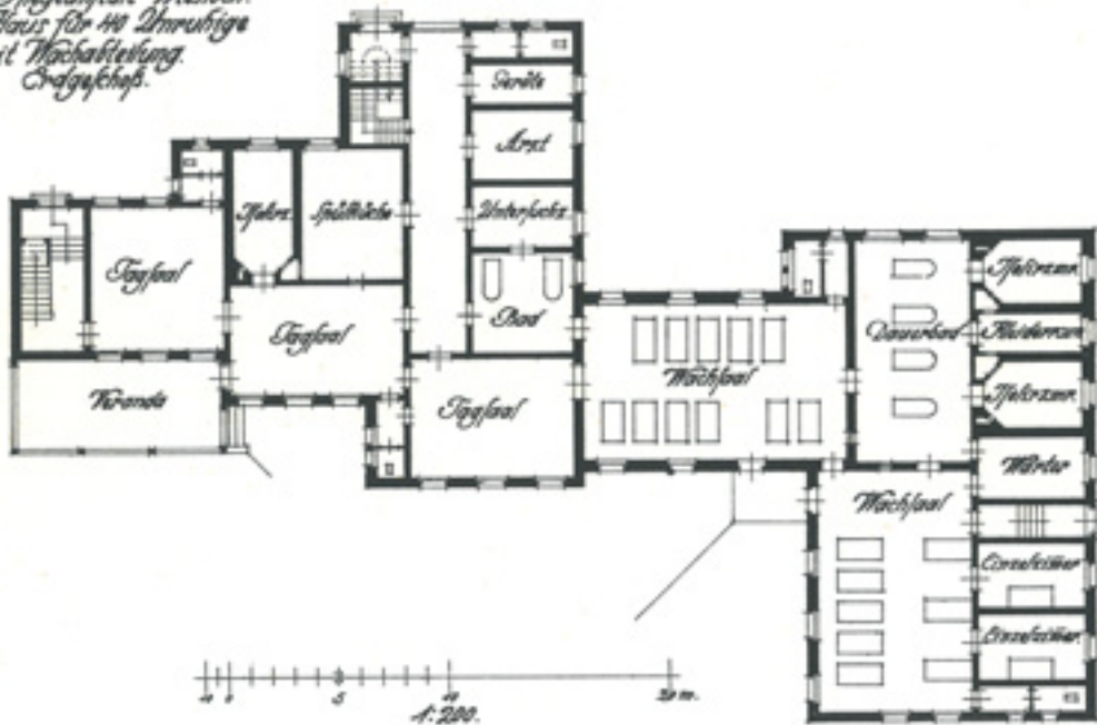
4 Grundriss des Krankengebäudes für unruhige Männer MU1, Druck 1910.

Heil- u. Pflegeanstalt Wäsloch. M.W.A. Haus für 40 Unruhige mit Wächterleitung. Erdgeschoss.