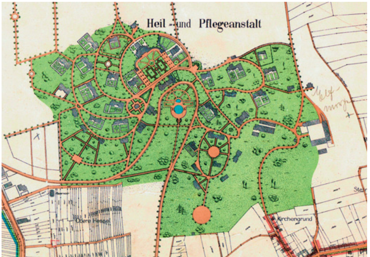
2 Übersichtsplan der Stadt Wiesloch, Ausschnitt, April 1910. Die Lithografie gibt den Planungsstand der gärtnerischen Anlagen nach Entwurf von Paul Schultze-Naumburg 1905 wieder.

pie – als Erholungsfläche, um sie „allmählich an das normale Leben, an die Natur und die menschliche Umgebung zu gewöhnen“ (Stürzenacker). Bei den Gärten für unruhige Kranke wurde der unzuverlässigen Gemütsverfassung mit höheren Einfriedungen und fest im Boden verankerten Bänken Rechnung getragen. Zwischen den Pavillons anzupflanzende Baum- und Gesträuchgruppen sollten nicht nur die Flächen ästhetisch beleben, sondern darüber hinaus eine schalldämpfende Wirkung zwischen den – mitunter lauten – Häusern der Unruhigen und den Landhäusern der Ruhigen entfalten.