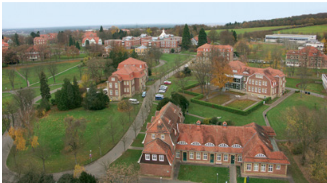
7 Krankengebäude für männliche Epileptiker ME und halbruhige Männer MH1, vorn das Werkstattegebäude, Aufnahme 2008.

Der Barockstil war ganz allgemein seit etwa 1890 zur Inspirationsquelle historisierender Architektentwürfe avanciert und erfreute sich einer zu-