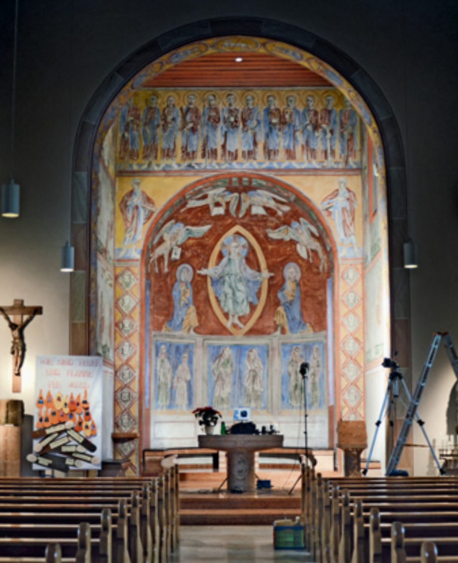
4 Chorraum, Ansicht während der Untersuchung.

Im Jahr 2010 wurde in die Kirche eine neue Orgel eingebaut, deren Oberflächen vom Künstler Hermann Geyer, dem Sohn von Wilhelm Geyer, gestaltet wurden.