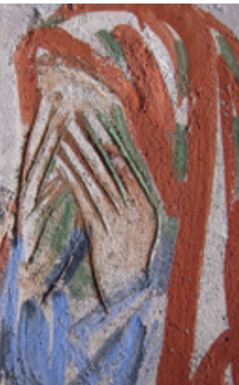
6 Kopf der Trauernden rechts der Kreuzigungs-szene.

um Bestand, Zustand und Schäden an den Malereien auch grafisch erfassen zu können. Hierzu wurde vom Landesamt für Denkmalpflege, in Zusammenarbeit der Fachgebiete Restaurierung und Bauforschung, Baudokumentation und Fotografie, der Grundriss der Kirche vermessen, aus dem sich eine Nummerierung zur Einteilung der Wandbereiche (Bereichseinteilung) entwickelt. Anschließend wurde die Chorausmalung in etwa 2 qm großen Bildausschnitten durchfotografiert, sämtliche Aufnahmen eingemessen und abschließend zu den fertigen Bildplänen montiert (Abb. 5). Für die „Bereichseinteilung“ von Schiff und Chor mit einer Abwicklung der Wandflächen wurden Buchstaben und Nummerierungen vergeben, die eine Lokalisierung und Zuordnung sämtlicher Einzelaufnahmen, Befunde und Schriftstücke zu einem klar definierten Bereich ermöglichen.