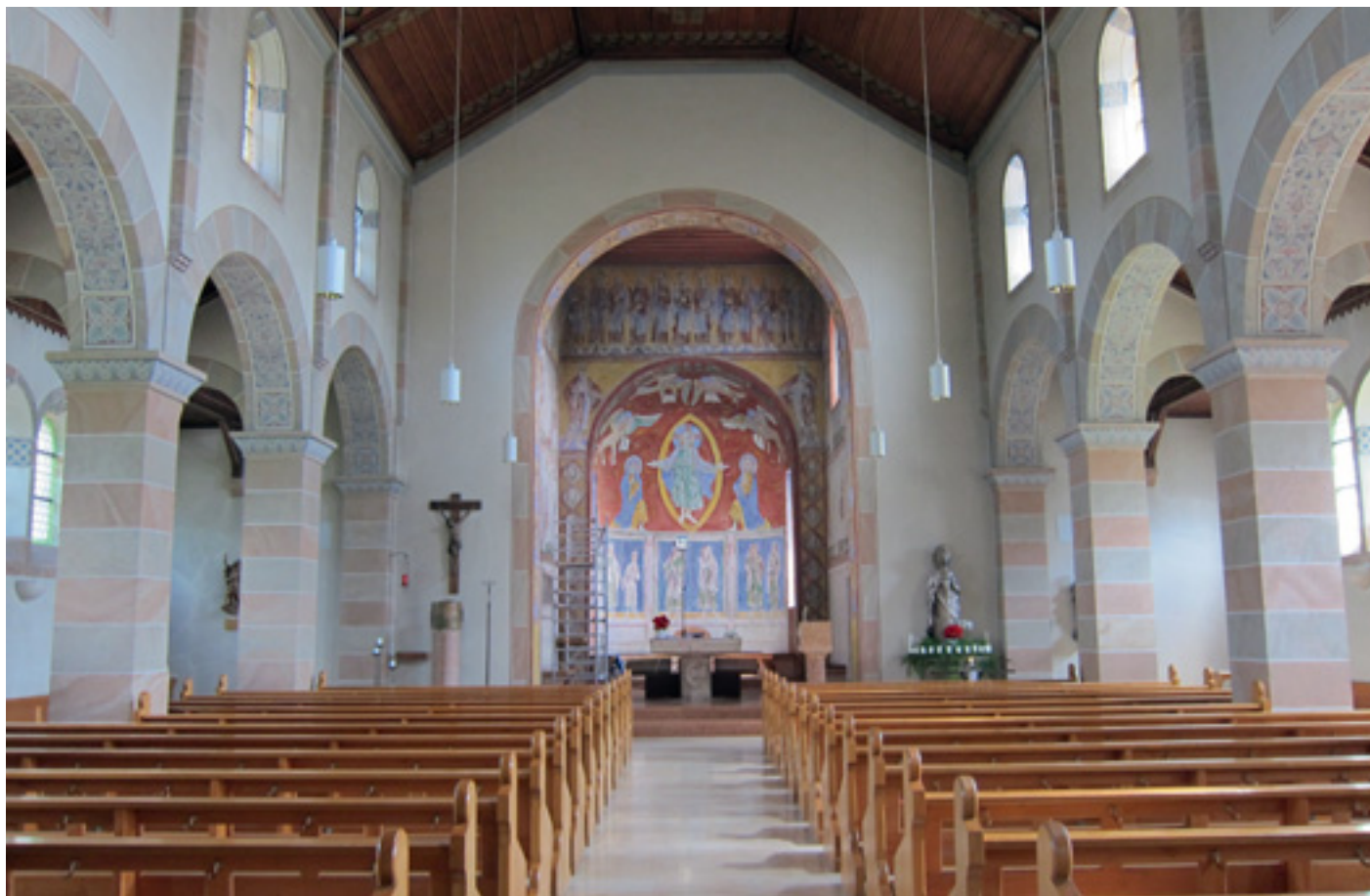
2 Innenansicht, Blick zum Chor.

lassen sich allein durch die Freilegung und Rekonstruktion dieser Raumgestaltung durch die Restaurierung von 1983 gewinnen. Demnach waren sämtliche Fensterlaibungen und Kapitelle mit einer ornamentalen Malerei versehen. Die Steinpfeiler waren mittels Lasuren farbig gefasst, um den Effekt mehrfarbiger Natursteine zu imitieren. In dieser Weise wurden auch Steinimitationen auf Putzflächen ausgeführt.