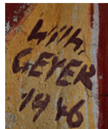
3 Signatur Wilhelm Geyers.

In den 1980er Jahren kontaktierte das bischöfliche Ordinariat das Landesdenkmalamt, da man einen Abriss und einen größeren Kirchenneubau für die wachsende katholische Bevölkerung in Blaubeuren anstrebte. Da sich die Denkmalpflege allerdings vehement gegen dieses Vorhaben stellte, folgte 1981/84 stattdessen eine weitere Renovierungsphase. Diese beinhaltete das Einbringen einer Drainage und eines neuen Fußbodens inklusive Fußbodenheizung sowie die Erneuerung der Dachdeckung. Außerdem erfolgte eine Absenkung der Orgelempore, verbunden mit einer Neugestaltung des Aufgangs. Eine wesentliche Veränderung des Erscheinungsbildes im Kircheninneren brachte die Freilegung der Malereien von 1914 und eine an diesen Fassungsbestand angelehnte Überarbeitung der Malereien im Schiff.