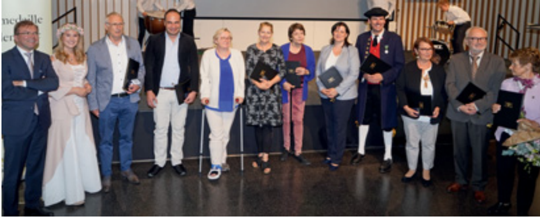
Verleihung der Heimatmedaille Baden-Württemberg am 6. September 2019 in Winnenden.