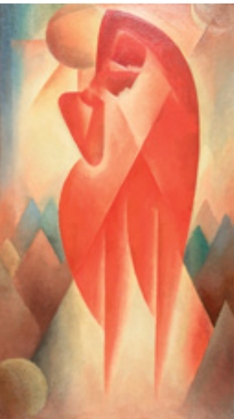
Gottfried Graf (1881–1938): „Schreitendes Liebespaar I“, 1919, Stadt Mengen.

Stuckateure oder Handwerker aus der Schweiz und dem Elsass tätig waren. Ähnliche Spielräume scheinen ebenso bei der Interpretation der regionalen Spezifik einer Kunst um 1300 nötig. Freilich kommt ein breit angelegter Überblick zur Kunst- und Kulturgeschichte, wie ihn der vorliegende Beitrag als hervorragende Leistung bietet, nicht ohne derartige Vereinfachungen aus.